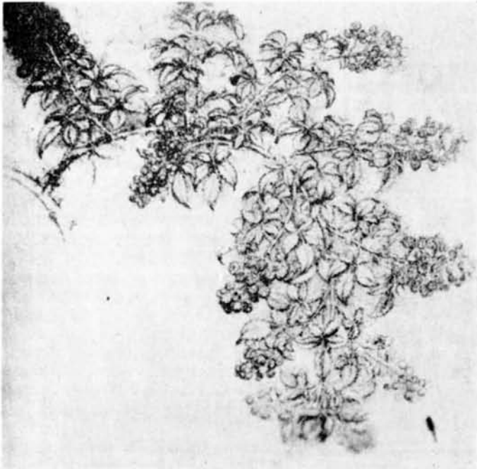
Rama de zarza, Leonardo de Vinci

Con mi facilidad para llevar el pensamiento a épocas muy lejanas, aquellas humildes flores me hicieron pensar en clases de Botánica durante el Bachillerato y durante los estudios de Farmacia, en viejos herbarios, en corolas gamopétalas y dialipétalas, en corimbos y en umbelas, en estambres y pistilos. Porque además las plantas tienen un gran poder evocador, como vamos a ver con el breve resumen de un cuento de Andersen que también entonces se me vino a la memoria.