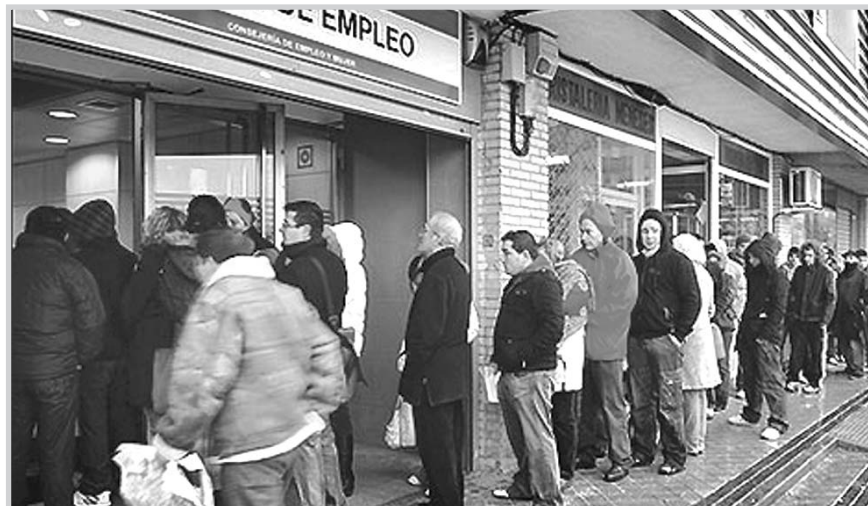
Demandantes de empleo.

disminuyó, además de en Albacete , en Ciudad Real , con 682 personas menos; y en Toledo , con 708 menos; mientras que aumentó en Cuenca , con 157 parados más; y en Guadalajara , con 125 más.