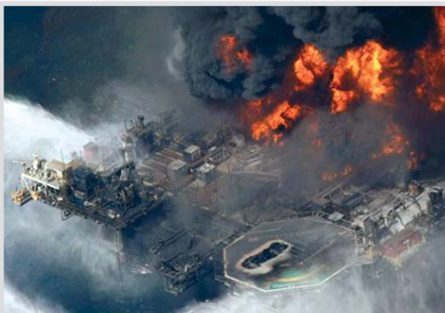
Imagen de la plataforma en llamas.

En Estados Unidos están viviendo su particular "Prestige" , con la rotura de una de las plataformas petrolíferas en el Golfo de México , una zona de gran riqueza pesquera y mariscadora , lo que acerca la situación más a Galicia que a Alaska , en donde se produjo el desastre del Exxon Valdez . La gran diferencia es que el Gobierno Federal ha conseguido que la empresa responsable de la plataforma, British Petroleum , se haya apresurado a asumir los costes para tratar de paliar y solucionar la situación . Claro, no es lo mismo una de las mayores compañías del mundo que la empresa que fletó el viejo petrolero que ennegreció la costa cantábrica, desde Portugal a Francia .