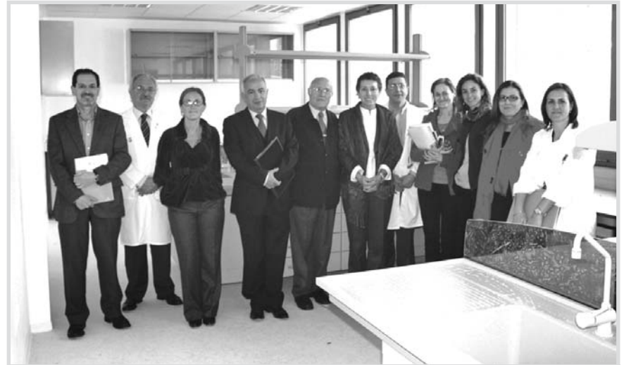
Asistentes a la reunión de seguimiento de la Unidad de Investigación Oncológica Traslacional.

dos en las dos líneas de investigación permiten aglutinar a las diversas áreas de investigación básica y clínica de los centros hospitalarios de Albacete y aumentar la masa crítica de investigadores que se reúnen en torno a