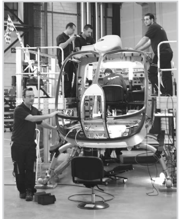
Trabajadores de Eurocopter, en Albacete.

bierno de Castilla-La Mancha destinará para esa inversión 11,2 millones de euros; así como otros 3,4 millones en la empresa Aernova, que invertirá 42,5 millones de euros en la instalación de una planta industrial en la localidad toledana de Illescas, y permitirá la creación de 271 empleos.