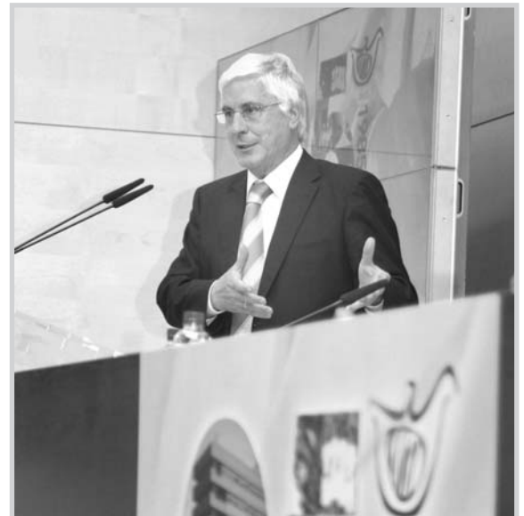
José María Barreda.