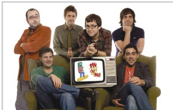
El equipo de Muchachada Nui, al completo.

dar la iniciativa de la reforma del Estatuto de Autonomía de Castilla-La Mancha para garantizar una reserva estratégica que asegure el desarrollo presente y futuro". El 13 de abril de este año, se reunió con motivo de la reunión de la Comisión Constitucional del Congreso de los Diputados.