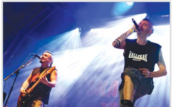
Ska-p, durante su actuación.