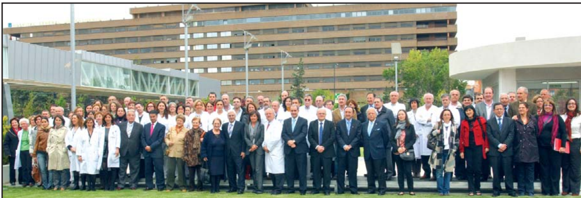
El presidente, en el centro, junto a buena parte de los responsables de los servicios hospitalarios.

Se duplicará la superficie, con dos nuevos edificios, e incorporará nuevos servicios sanitarios de vanguardia