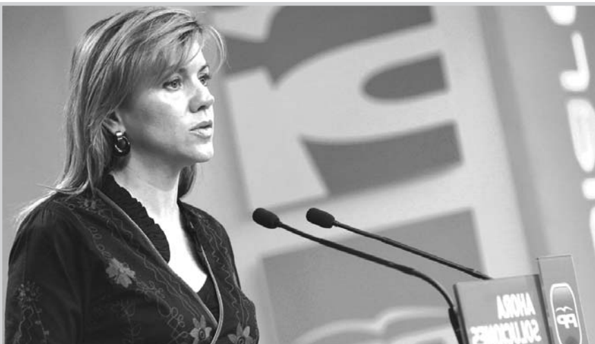
María Dolores Cospedal.