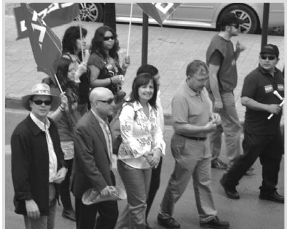
La alcaldesa, junto al presidente del Consejo Económico y Social.

Entre las reivindicaciones también figuró el rechazo al aumento de la edad de jubilación a los 67 años, así como la oposición al recorte de oferta de empleo público.