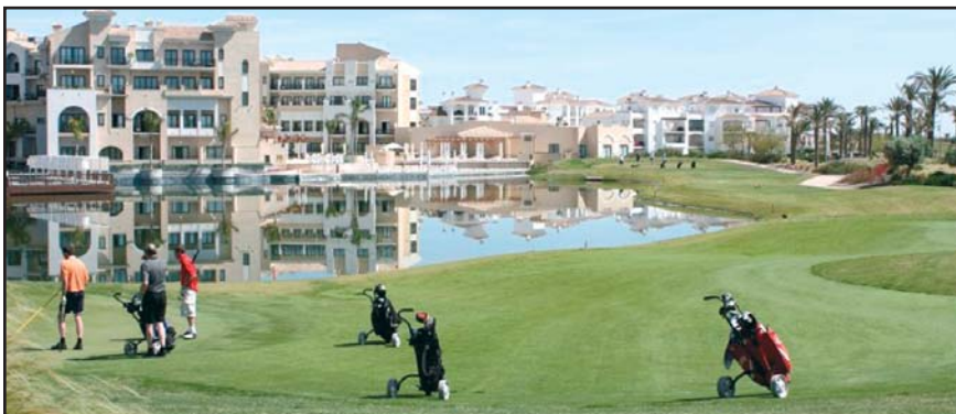
Campo de golf de Polaris World.

A pesar de haber solicitado un informe sobre qué agua se destina al riego de 17 campos de golf de Murcia, el Gobierno regional sigue sin conocer el destino del agua derivada al Segura y en Murcia reaccionan queriendo conocer cómo se usa en Castilla-La Mancha