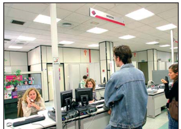
Oficina del Sepecam.

El número de parados se situó en 42.171. (Pág. 2)