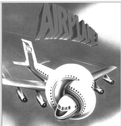
Aterriza como puedas.