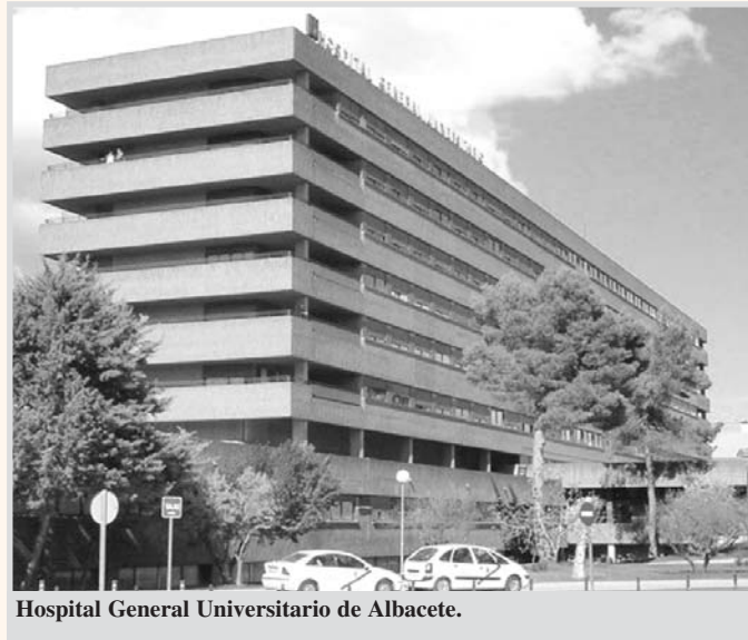
Hospital General Universitario de Albacete.

El hospital está lleno de profesionales (en estos casos, se suele añadir: excelentes), que son esos funcionarios que tanto alarman también a los mismos que abominan de los impuestos; tampoco deben dudar de solicitar sus diagnósticos y cuidados. En estos días, con la crisis, no para de referirse el sector anti público