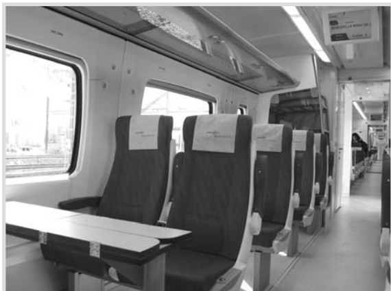
Mejores acabados y más comodidades.