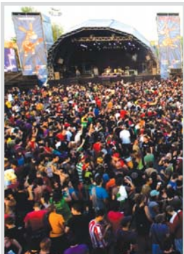
Público asistente a uno de los conciertos.