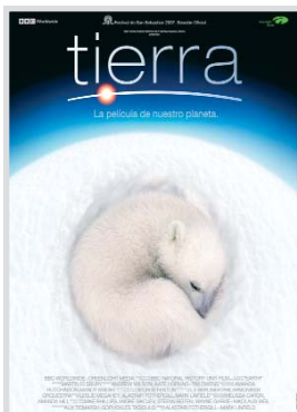
Tierra, la película de nuestro planeta.

Los actos se han programado en cuatro plazas, cuatro parques y jardines, además de la Caseta de Los Jardinillos y la Posada del Rosario. Además, todas las pedanías del municipio contarán con una actuación.