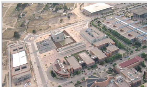
Vista aérea del Parque Científico y Tecnológico.

En lo que va de año, se han incorporado al Parque Científico y Tecnológico cinco empresas, y otra está en proceso de evaluación.