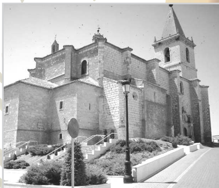
Iglesia del Salvador de La Roda.