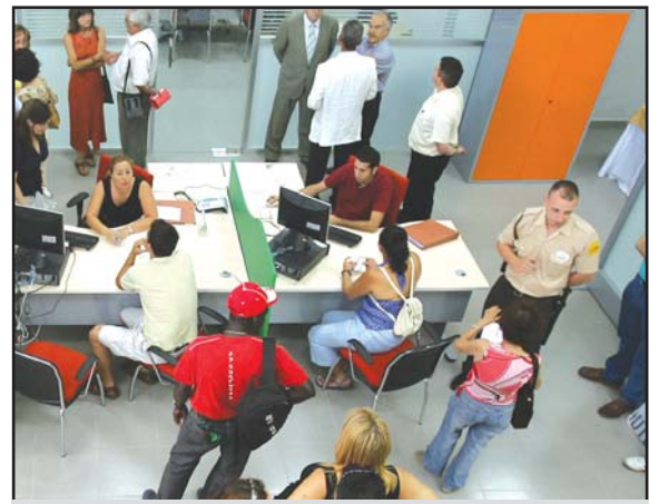
Oficina de paro.

El acumulado del segundo trimestre es de 2.212 parados menos