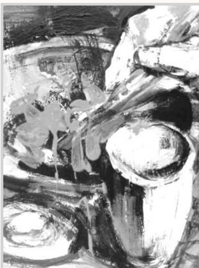
Uno de los cuadros de Miwako Yamaguchi.

dades presenta la exposición " Territorio, paisaje y cultura: Recursos turísticos de la provincia de Albacete ", muestra cartográfica y fotográfica. Hasta el día 15 de julio.