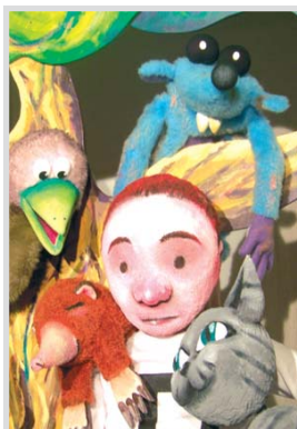
Títeres Sol y Tierra.