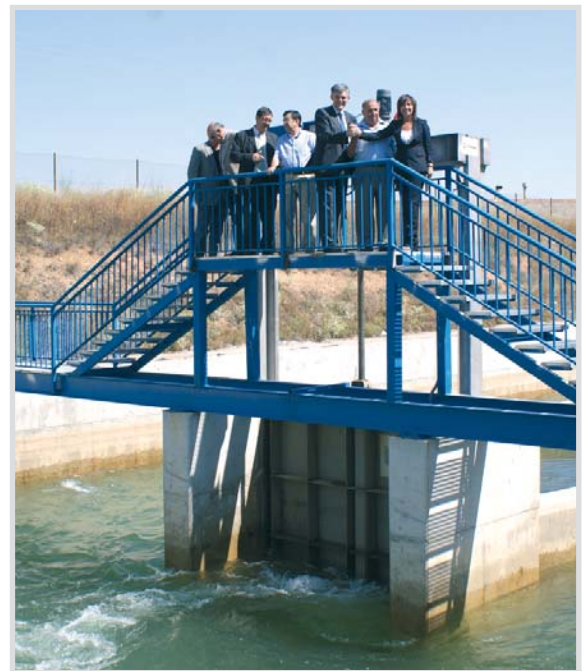
Un momento de la visita a la zona regable de Los Llanos.

En el canal, el agua lleva una serie de elementos como algas, brozas, ramas y otros elementos, que tapan la superficie de las