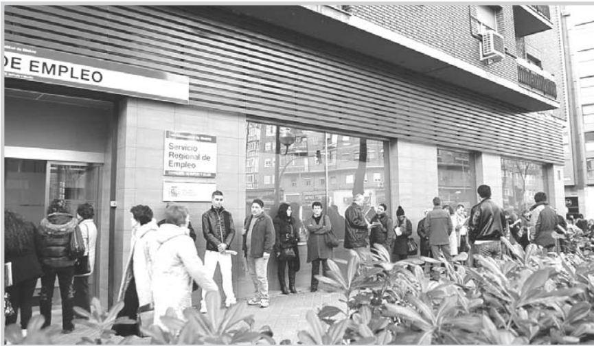
Cola del paro.

El paro disminuyó, en junio, en Albacete, Castilla-La Mancha y España . En la provincia, el desempleo bajó, con respecto a mayo, en 1.156 personas, lo que supone un descenso del 2,78% . El número de parados se situó en 40.364 . Con respecto a junio de 2009, el desempleo aumentó un 14% , con 4.967 parados más.