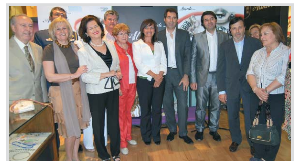
Asistentes al lanzamiento de la "Pulsera de Albacete".