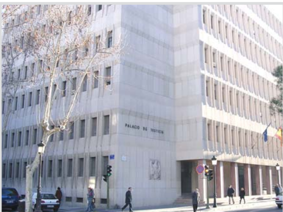
Palacio de Justicia.