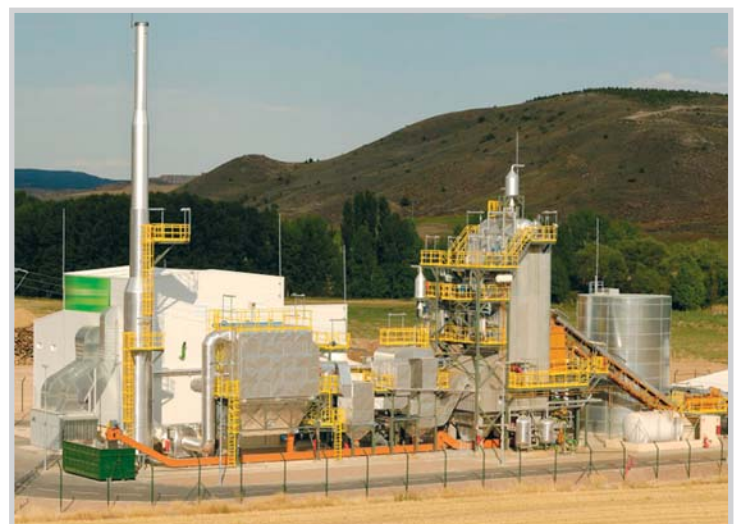
Planta de biomasa.

Aunque el desarrollo de energía termosolar -que tampoco será exce-