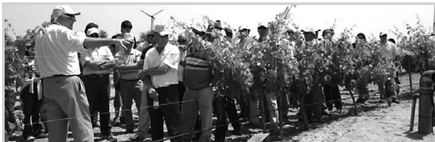
Unos de los recorridos en la finca Las Tiesas.

A lo largo de cinco rutas, los asistentes pudieron conocer las diferentes áreas de investigación