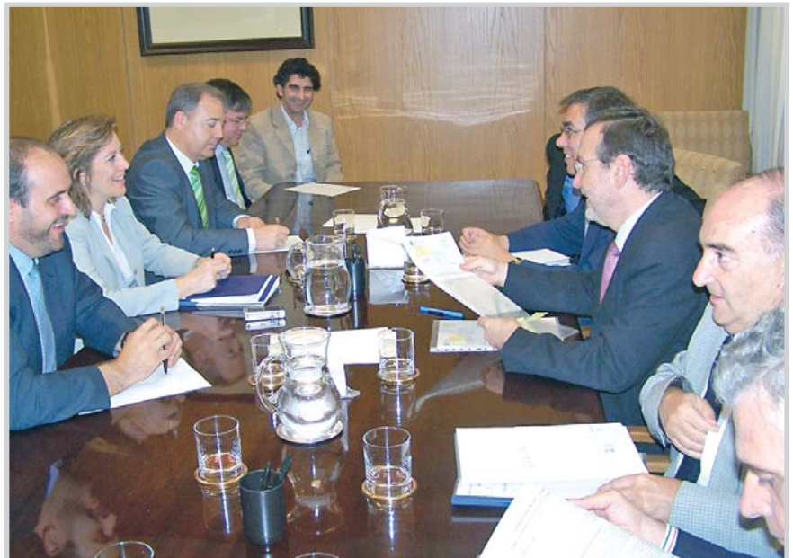
Reunión de la Comisión Mixta, en Hellín.

impacto medioambiental, porque contará con una potabilizadora que dará lugar a un gran ahorro en las economías de escala y todo ello cumpliendo con el objetivo fundamental de garantizar el abastecimiento de los 23 municipios de Murcia que sufrieron restricciones en 2003.