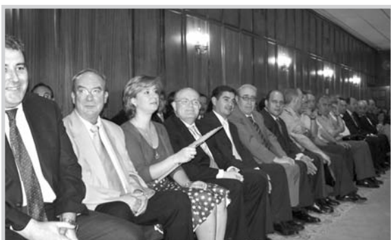
Autoridades y representaciones institucionales se dieron cita en el nombramiento del nuevo fiscal jefe.