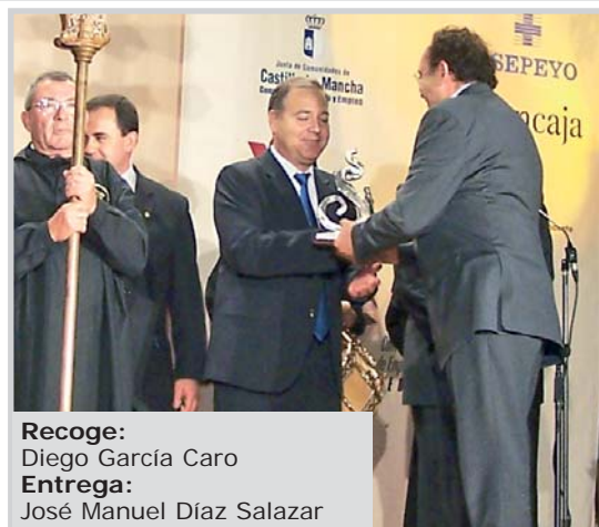
Recoge: Diego García Caro Entrega: José Manuel Díaz Salazar