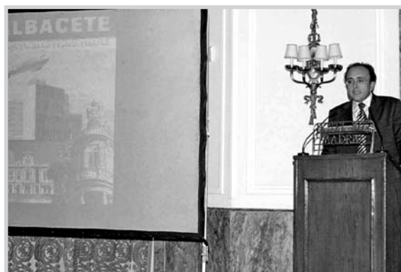
El consejero de Industria.

Por último, apuntó la importancia del capital humano que la UCLM está formando. "Proporciona algo muy importante que es el talento, algo muy importante en un momento en el que cultivar y retener talento es fundamental".