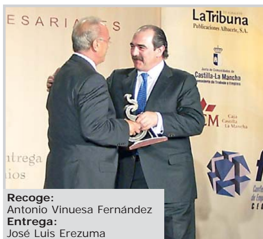
Recoge: Antonio Vinuesa Fernández Entrega: José Luis Erezuma