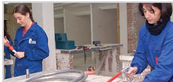
Talleres de empleo femenino.

Cada vez más, los centros educativos demandan servi-