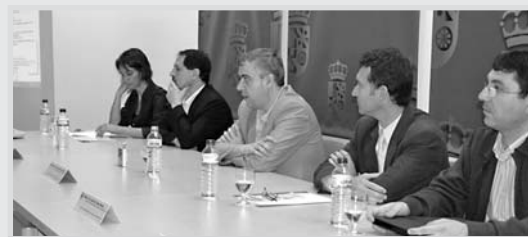
Un momento del curso.