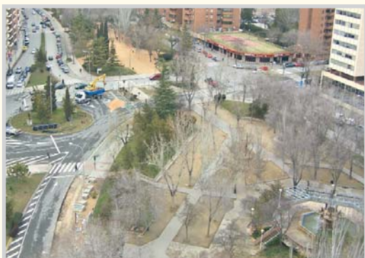
En la foto de arriba, los emplazamientos actuales de la rotonda de El Sembrador (ángulo superior izquierdo) y la Fuente de las Ranas (inferior derecho); en la de abajo la recreación virtual.