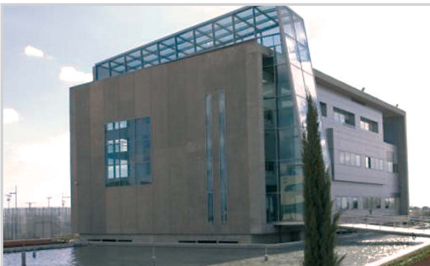
Parque Científico y Tecnológico de Albacete.

"La innovación es fundamental para que los empresarios dispongan de mayores oportunidades de competir". En este sentido son destacables los esfuerzos que realizan tanto el Gobierno de Castilla-La Mancha como las asociaciones empresariales para apoyar las iniciativas de los emprendedores y la incorporación de las nuevas tecnologías a los procesos productivos de las empresas.