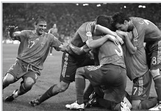
Los jugadores españoles celebran uno de los goles.

España: Casillas, Sergio Ramos, Pablo Puyol, Pernía, Xabi Alonso, Senna (Cesc), Xavi, Luis García (Raúl), Fernando Torres y Villa (Joaquín).