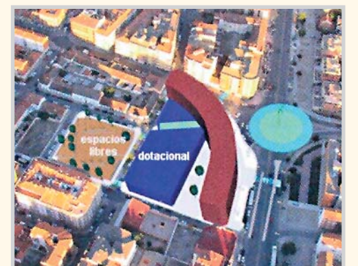
Zona de las Cocheras de Aviación.