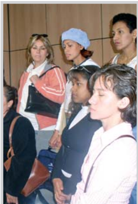
Ayudas para la integración de familias.

Un total de 554 familias de la región se beneficiaron durante el pasado año del Ingreso Mínimo de Solidaridad, una prestación económica que tiene como fin dotar de una