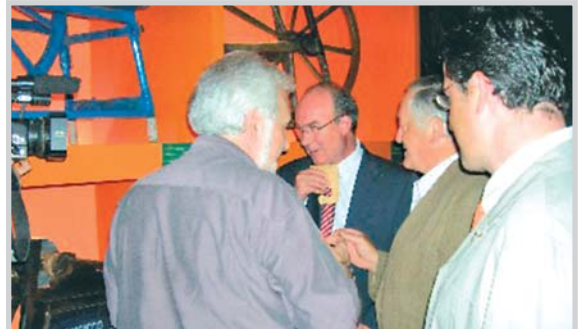
Un momento de la inauguración de la exposición.

La exposición se compone de 16 piezas que muestran la evolución de este oficio artesano