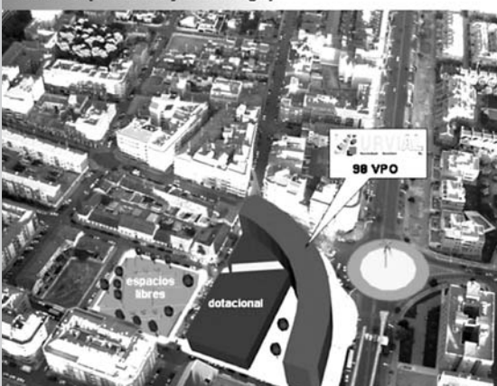
Zona de construcción de viviendas en las Cocheras de Aviación.