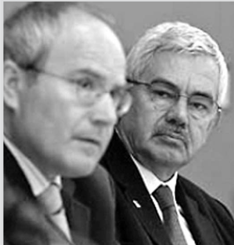
José Montilla y Pascual Maragall.

Eso viene a mostrar que no andan tan descaminados los que dicen que los políticos catalanes han ido por un lado y los ciu-