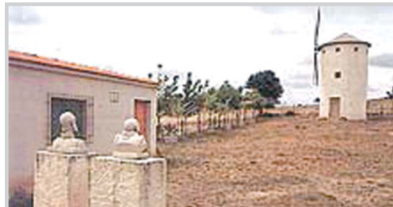
Molino de la Bella Quiteria.