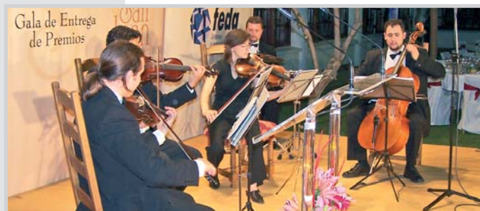
La velada estuvo amenizada por un quinteto de cuerda.