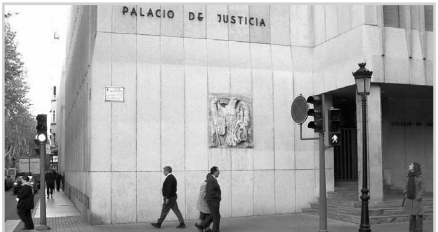
Actual Palacio de Justicia de Albacete.