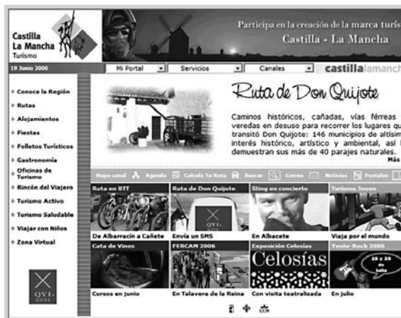
Web de Turismo de Castilla - La Mancha.

En la quinta, las IV Jornadas finalizaron en los programas de mejoras de las plantaciones de cereales como la cebada, el trigo harinero, el ajo morado y las plantas leguminosas.