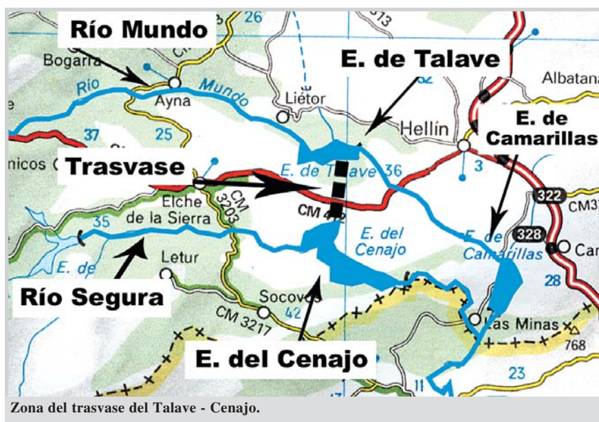
Zona del trasvase del Talave - Cenajo.