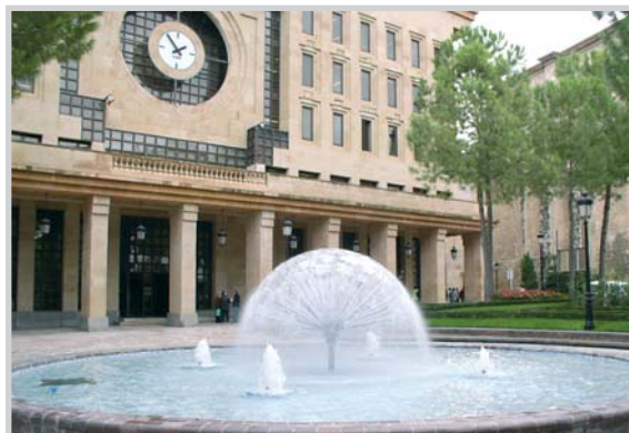
Ayuntamiento de Albacete.

El grupo Popular señaló que el alcalde ha tenido que recurrir a la subida "injusta y desmesurada el recibo del IBI" para hacer frente a la deuda del Ayuntamiento y que ha retrasado su pago en 20 años. Desde el punto de vista del concejal esto es "una irresponsabilidad" por parte del equipo de Gobierno.