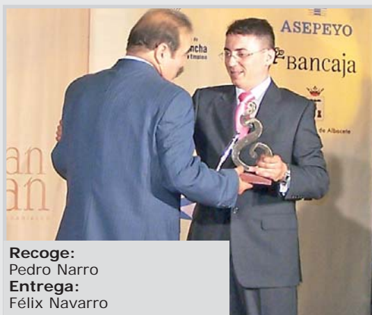
Recoge: Pedro Narro Entrega: Félix Navarro