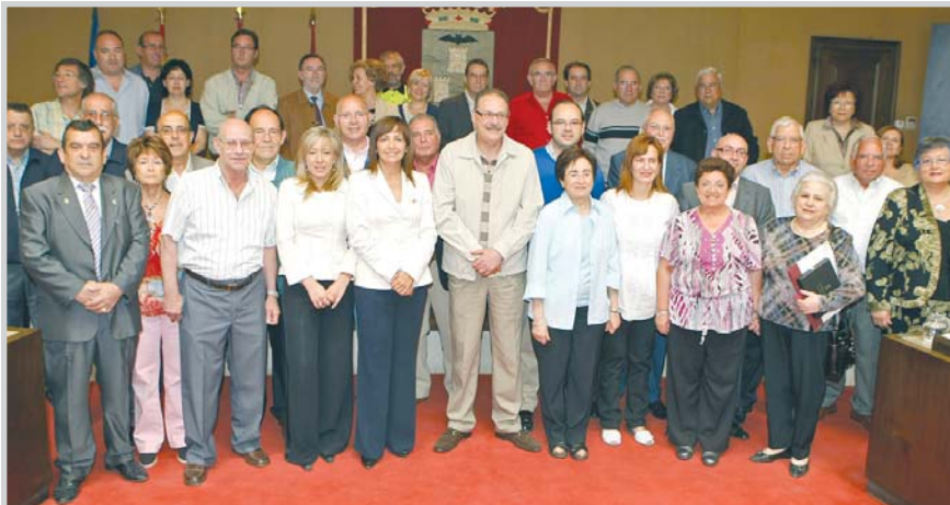
La Corporación Municipal junto a los jubilados reconocidos.

La alcaldesa recordó que las pensiones no bajarán este año y que las mínimas aumentarán