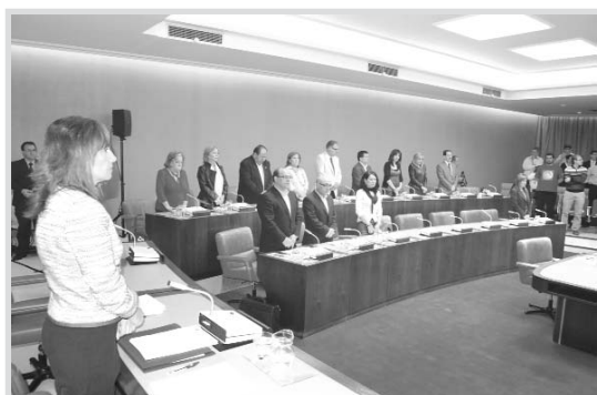
Un momento del minuto de silencio.