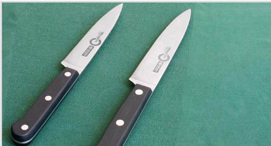
Cuchillos presentados con el logotipo del III Centenario de la Feria de Albacete.