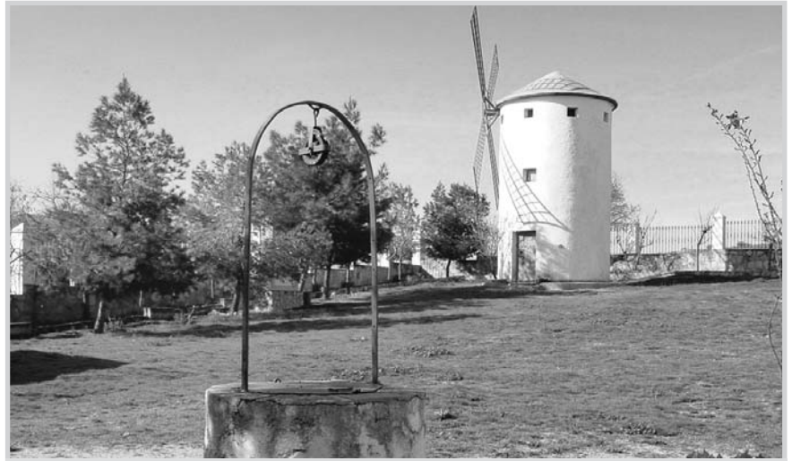
Molino de la Bella Quiteria, en Munera.