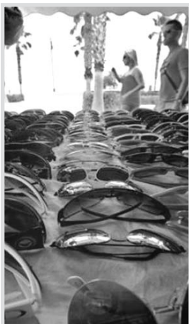
Gafas no homologadas, en un mercadillo.

Las personas mayores también deben utilizar gafas de sol, ya que sus ojos están más debilitados y, por tanto, más expuestos a la acción nociva de los rayos solares. Se debe abandonar la idea de que las gafas de sol son sólo para los adultos, ya que la visión de los niños debe protegerse tanto o más que la de los mayores. En los casos en los que el niño no quiera llevar gafas, se le puede poner un sombrero o una gorra provista de una amplia visera, puesto que nunca debe estar expuesto prolongadamente al sol con la cara descubierta.