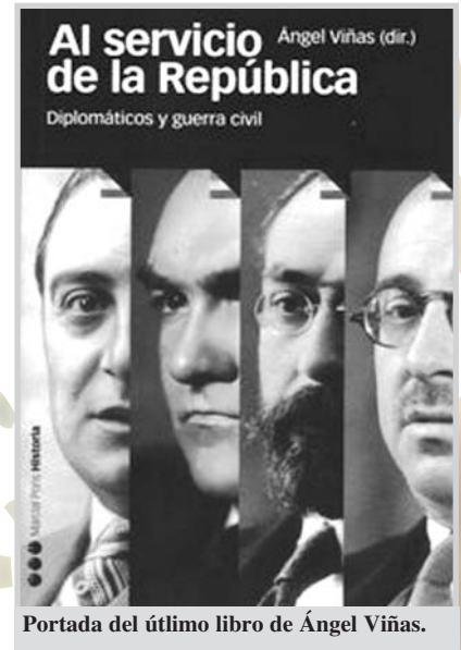
Portada del último libro de Ángel Viñas.

jará la fecha "en que tendremos el enorme lujo de contar con Pedro" , al que deseó un pronto restablecimiento. Con ello, una nueva ovación para Pedrés y la firma de Casañ en el libro de honor se cerró el acto.