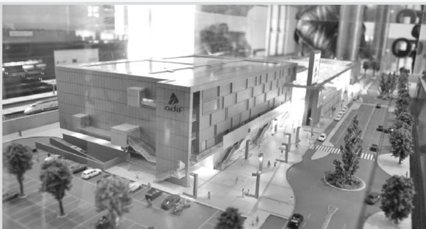
Maqueta de la estación de Albacete.

Además de servicios de transporte, se desarrollarán actividades culturales, de ocio y comerciales. De hecho, cuenta con 41 establecimientos dedicados a estas actividades.