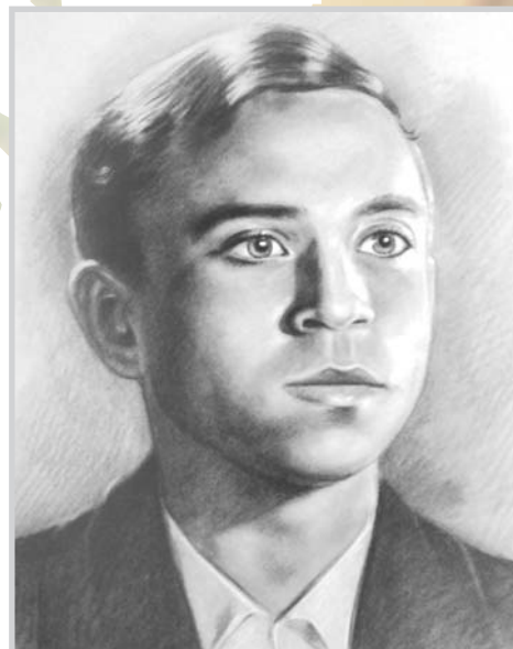
Ilustración del poeta Miguel Hernández.