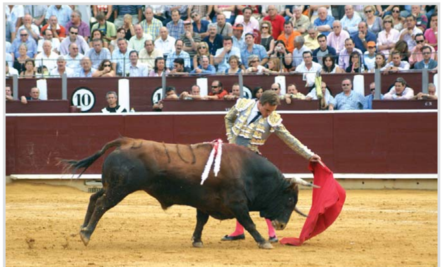
Un momento de una pasada edición de la Feria Taurina de Albacete.

El ciclo, que comenzaba al cierre de esta edición, se desarrolla los jueves, a partir de las 19:00 horas, desde el 28 de octubre hasta el 25 de noviembre, en la sala de conferencias de la Facultad de Educación del campus de Albacete.