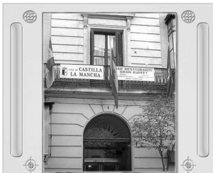
La Casa de Castilla- La Mancha en Madrid.