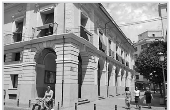
En Almansa se urbanizarán varias calles.

ejecución”. Por lo tanto, “la diligencia sigue siendo una constante en la elaboración y tramitación de los planes provinciales, no sólo porque estamos hablando de obras muy necesarias en los municipios, sino porque los fondos procedentes de otras administraciones exigen ser gestionados con total eficacia para no perder un solo euro”, añadió.