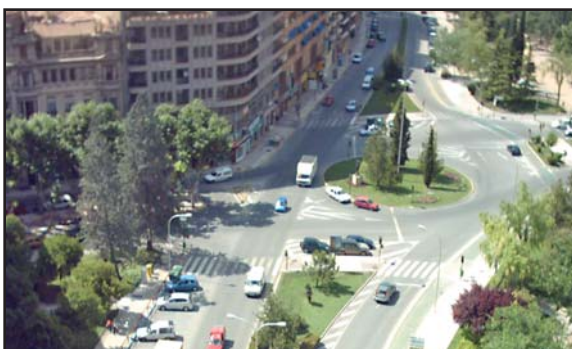
Plaza de El Sembrador.

Las obras del aparcamiento subterráneo de El Sembrador, que comenzarán a principios de marzo,