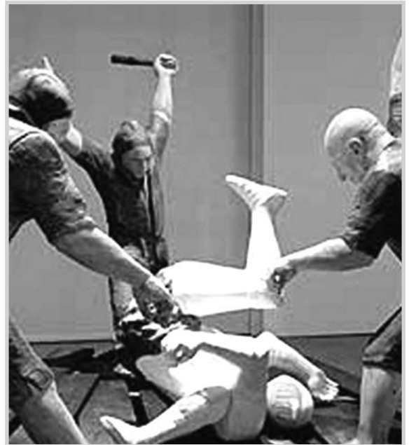
Imagen de la obra "Las tres dimensiones de El Quijote".

la presencia de un conocido castellano-manchego, el toledano Rafael Canogar (1935), representado en esta ocasión a través de la obra que ha denominado 'Don Quijote' (técnica mixta sobre madera, pan de oro, acero corten y bronce), pieza original e inédita