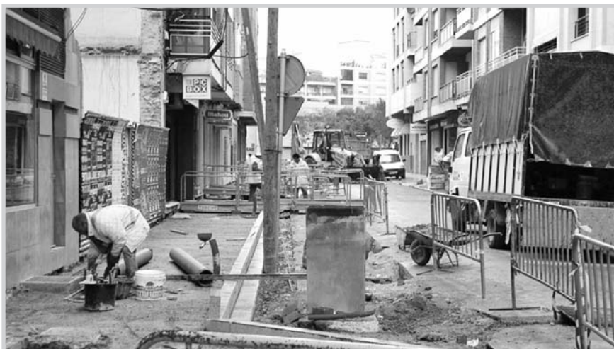
Pavimentación de calles.