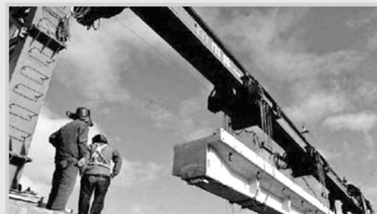
Una máquina colocando traviesas.

Estas obras están englobadas dentro del proyecto de actuaciones de seguridad para las circulaciones ferroviarias entre Albacete y Alicante. Durante los trabajos, en los que participaron más de 50 operarios, el servicio ferroviario estuvo cortado once horas.