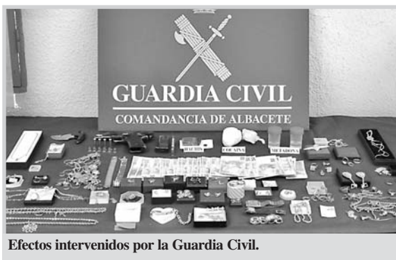
Efectos intervenidos por la Guardia Civil.

Unidad, y de la Guardia Civil de Motilla del Palancar y de Quintanar del Rey, procedieron al registro del domicilio del detenido y de un mesón de su propiedad. En estos lugares le han sido intervenidas varias joyas, por no presentar el detenido ningún tipo de factura, ni acreditar su legítima procedencia. Se trata de 32 anillos, 17 pares de pendientes, nueve cordones, seis gargantillas, seis pulseras y otras joyas, al parecer de oro, así como bisutería, y dos botes que contenían metadona.