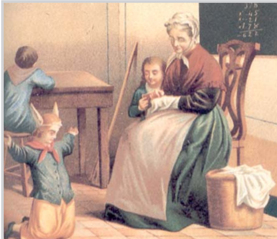
Uno de los paneles que muestra la exposición "La letra, con sangre entra".

del Niño, dirigido por Juan Peralta , acogerá hasta el 18 de abril una exposición que consta de varios paneles en los que se refleja lo que ha supuesto la disciplina escolar a lo largo del tiempo.