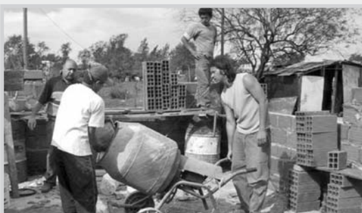
Trabajadores de la construcción.

Selia Puñal recordó que los programas fueron Albatros, módulo de nuevas tecnologías de la información, módulo de soldadura, garantía social muebles modulares, garantía social ayudante de cocina, curso de monitor de educación ambiental, de medios didácticos I y II, y curso de formador ocupacional I y II.