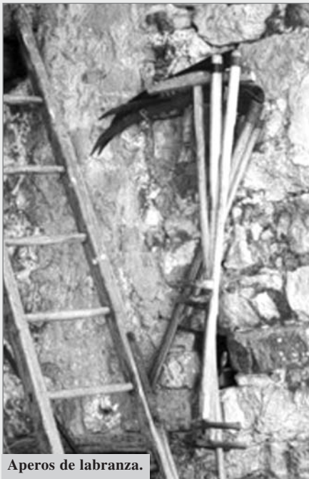
Aperos de labranza.