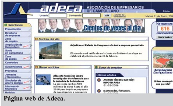
Página web de Adeca.