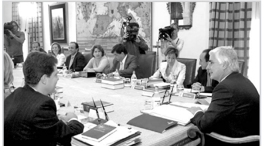
Reunión del Consejo de Gobierno.

La Estrategia Territorial de Castilla-La Mancha será un conjunto de estudios y propuestas que ofrecerán un diagnóstico de la situación actual de la comunidad autónoma y de sus potencialidades; definiendo un modelo de desarrollo territorial y proponiendo medidas para alcanzar los objetivos previstos; configurando áreas de ordenación territorial de escala intermedia y ofreciendo orientaciones pa-