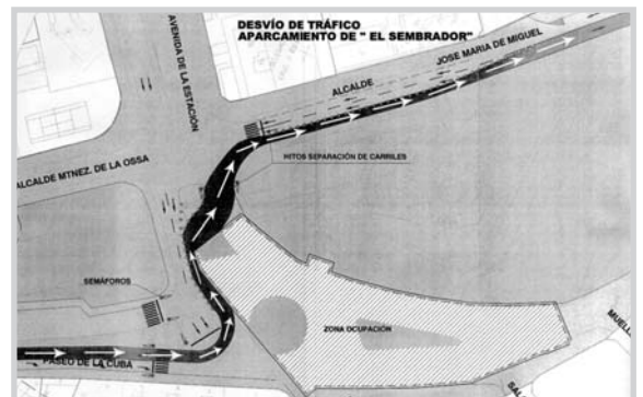
Desvíos del aparcamiento de El Sembrador.

Por último, a la calle Salamanca no se podrá acceder desde la calle Alcalde Conangla, por lo que al tratarse de una vía de sentido único quedará cortada al tráfico, aunque estará abierta para poder acceder a los garajes ubicados en ella.