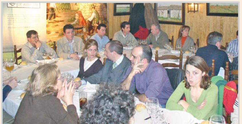
Aprecu compartió una comida con los periodistas.

garantía 'AB. Cuchillería de Albacete', recordando los primeros contratos para uso firmados por el Ayuntamiento y cuatro empresas cuchilleras.