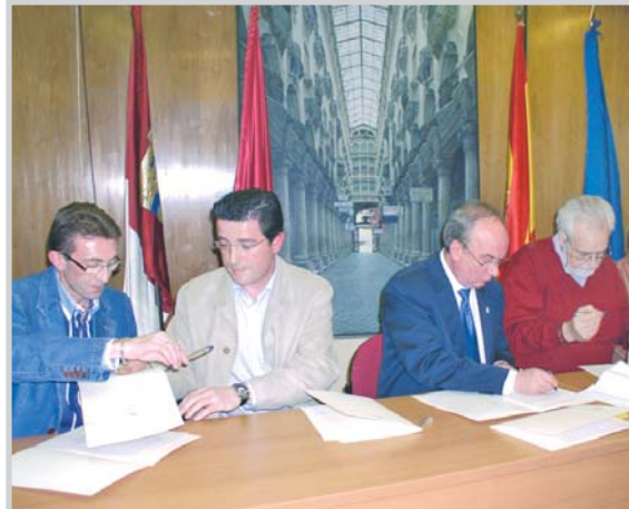
El alcalde firmó con cuatro empresas el contrato de uso de la marca de la cuchillería.

Una campaña nacional servirá para darla a conocer al consumidor