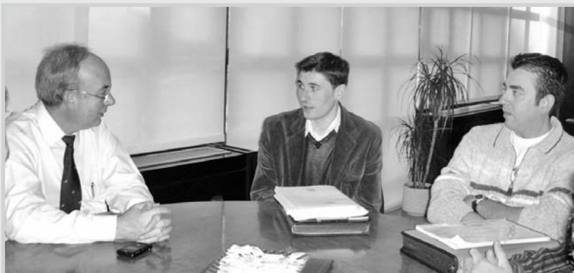
El alcalde se reunió con los representantes de los aspirantes a la Policía que no pudieron desarrollar las pruebas en Murcia.

Provincial y el Ministerio de Defensa, y finalmente podrán desarrollar las pruebas. El alcalde les felicitó por esta nueva oportunidad y por el tesón con el que han defendido sus derechos.