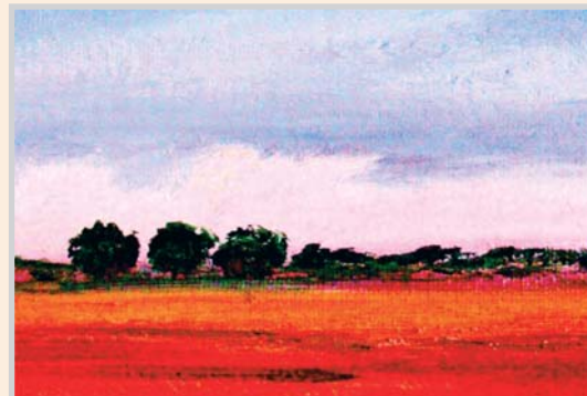
Una de las obras expuestas.