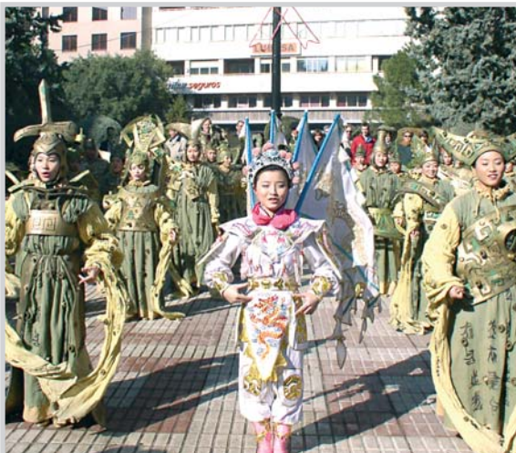
El Gran Circo Nacional Chino se presentó en el Altozano.

conseguirse en El Corte Inglés y en las taquillas del circo y el precio de éstas ronda entre los 15 y los 42 euros.