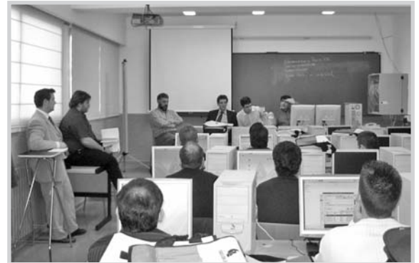
El taller sobre Molinux fue un éxito.

Se celebrará el 15 y 16 de febrero en la localidad de Valdepeñas