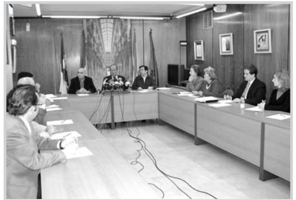
Reunión del Consejo de la Gerencia de Urbanismo.

Culminar el PGOU, satisfacer las necesidades de vivienda en la ciudad y aprobar el nuevo POM, principales objetivos