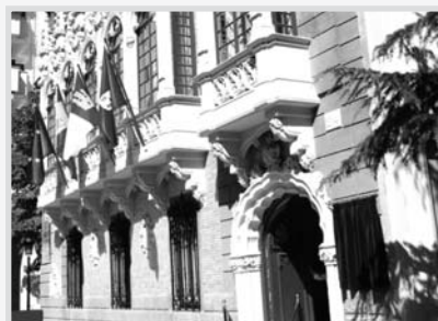
Museo de la Cuchillería.