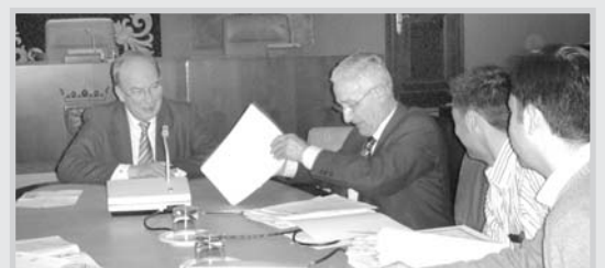
Un momento de la firma de las escrituras.

Castell , destacó en este acto que hasta el momento son 135 las plazas puestas a la venta, sobre un total de 263 que finalmente compondrán la oferta municipal, de la que ya han sido adquiridas más de un centenar.