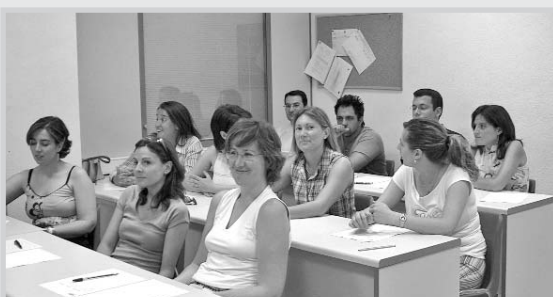
Alumnos de "Contabilidad de costes", en el Aula de Formación de la Cámara.

Continuando con la programación de actividades formativas previstas para el ejercicio 2006, la Cámara de Comercio e Industria de Albacete, desarrollará nuevos cursos en febrero.