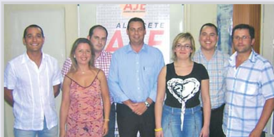
Junta directiva de Aje.

pyme y mejora del tejido empresarial de Albacete, gracias al convenio firmado hace un año con el Ayuntamiento.