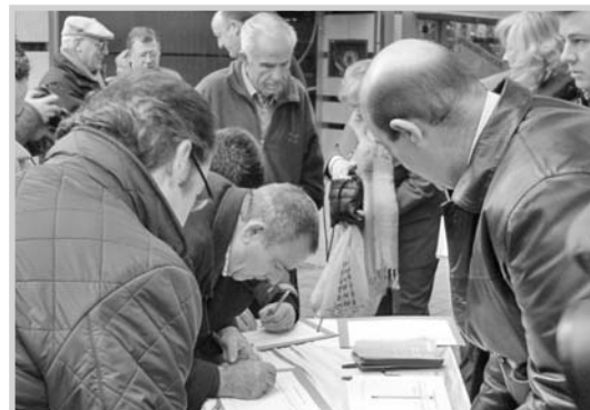
El Pp recoge firmas para pedir un referéndum sobre el Estatut .

rios representantes de su partido, aseguró que con esta iniciativa quieren "exigirle a José Luis Rodríguez Zapatero que retome el acuerdo alcanzado con los nacionalistas catalanes porque es inconstitucional, injusto e insolidario". Además, manifestó, "nuestro fin principal es que Castilla-La Mancha no se convierta en una comunidad de segunda categoría".