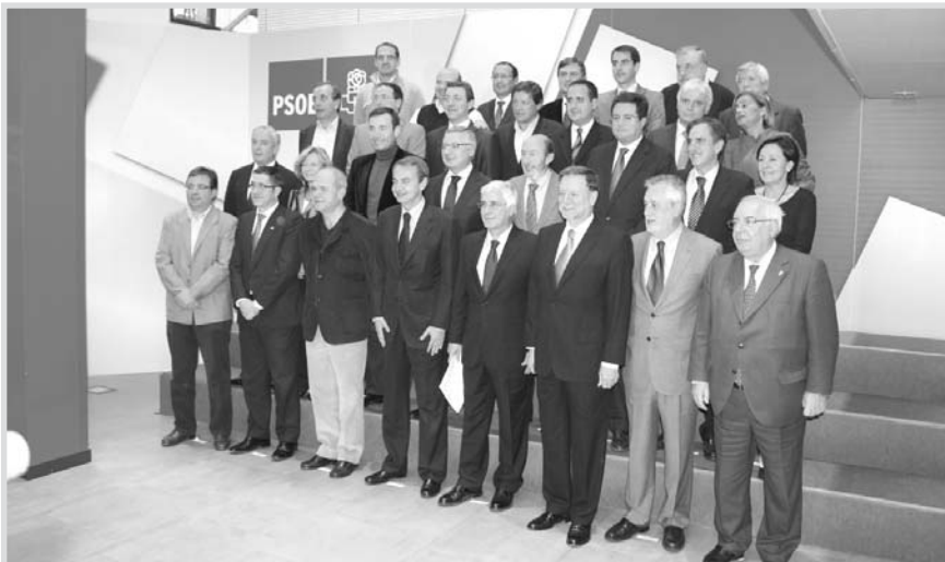
Consejo Territorial del Psoe.

Además de la reforma de las políticas activas de empleo, el presidente regional también anunció que el Gobierno de España tiene en su agenda otras prioridades, como políticas en relación con los autónomos y la Economía Social, así como las políticas de conciliación, “ya que es habitual que en épocas de crisis las mujeres paguen las facturas más elevadas”.