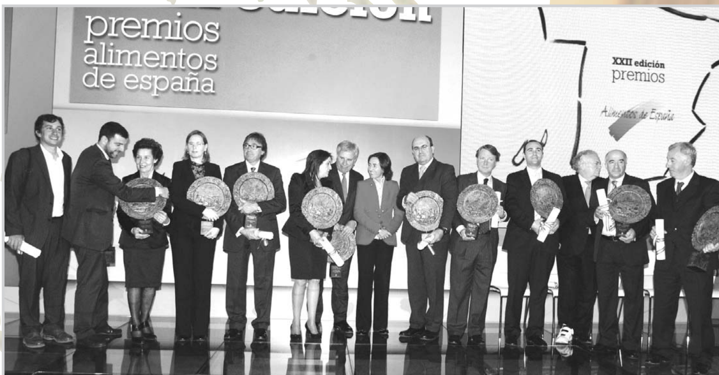
Premiados en la XXII edición de los Premios Alimentos de España.

En este caso, además de atender personalmente el stand entre ella y su marido fue éste el que llevó el peso de la representación en los cuatro días de jueves a domingo- que duró el certamen. Sobre todo en los contactos con empresarios, clientes y distribuidores del sector, así como en varios de los actos, charlas y conferencias y en las diversas publicaciones de la Feria y los medios de comunicación generalistas que cubrieron la misma.