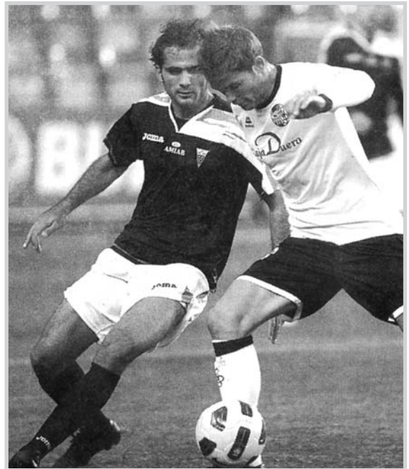
Verza intenta parar a un contrario.

trario y esperando alguna jugada aislada. Peor es lo del Alba , sin apenas capacidad para generar peligro arriba.