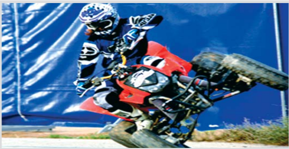
Imágenes del Motor Show Xtreme.