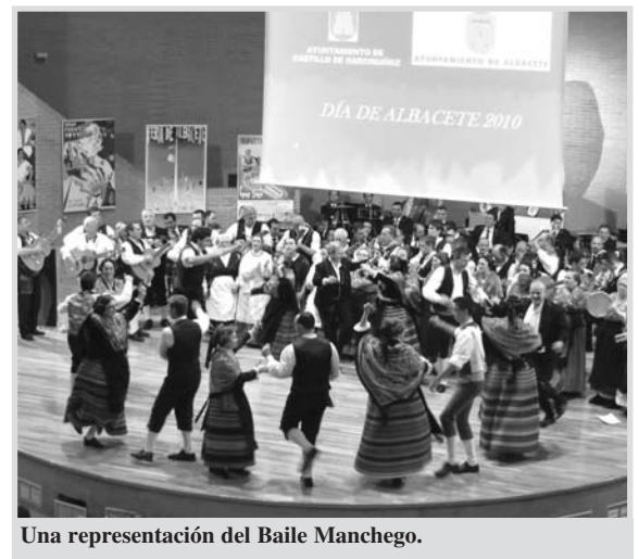
Una representación del Baile Manchego.