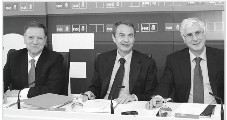
Marcelino Iglesias, José Luis Rodríguez Zapatero y José María Barreda.

El presidente aseguró que el Gobierno regional va a hacer un esfuerzo muy importante para que cerca