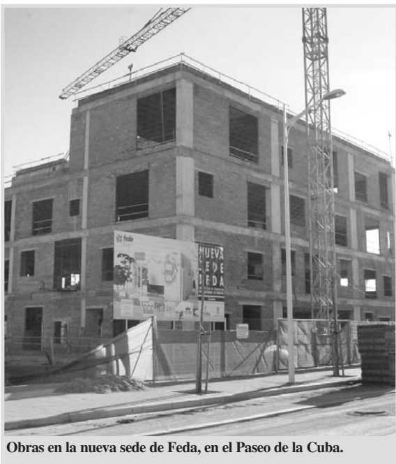
Obras en la nueva sede de Fedat, en el Paseo de la Cuba.

El acuerdo de iniciar negociaciones fue propuesto, en Pleno, por el Partido Popular, que obtuvo los votos favorables de Psoc e Iu.