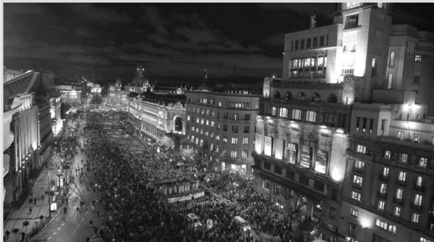
Imagen de la manifestación de Madrid.

La propuesta para debatir en el Pacto de Toledo parte de la base de que ha aumentado la esperanza de vida de los españoles. Es cierto, pero no solo porque se vivan más años; también porque han dejado de morir muchos niños, jóvenes y adultos. Si cuatro personas viven hasta los 80 años, la esperanza de vida es 80; si una muere a los 40, la esperanza del conjunto es de 70; si fallece a los 20, es de 65; y si lo hace al nacer es de 60. Y se debe extrapolar. Pero eso debe de ser un motivo de satisfacción para todos, no un castigo a dos años de trabajos forzados para quienes sobreviven.