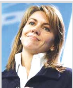
María Dolores Cospedal.

La feria Low Cost, que pretende ser una salida para las miles de viviendas que no encuentran comprador, se ha marcado unos objetivos altísimos. Nada menos que 50.000 visitantes esperan los organizadores, en tres días. Recientemente, una feria similar, celebrada en Barcelona, consiguió unos 25.000 visitantes. En proporción a la población de ambas ciudades, o provincias, es una barbaridad; y más si se tiene en cuenta que Barcelona cuenta con toda la oferta de la costa. Si se consigue ese nivel de asistencia, habrá sido todo un éxito. Quedarse muy por abajo, pues eso, un fracaso. Habrá que esperar las cifras oficiales y contrastadas, porque es de suponer que no se consideren visitantes de la feria todos los que vayan al hipermercado o a las tiendas del centro comercial Imaginalia.