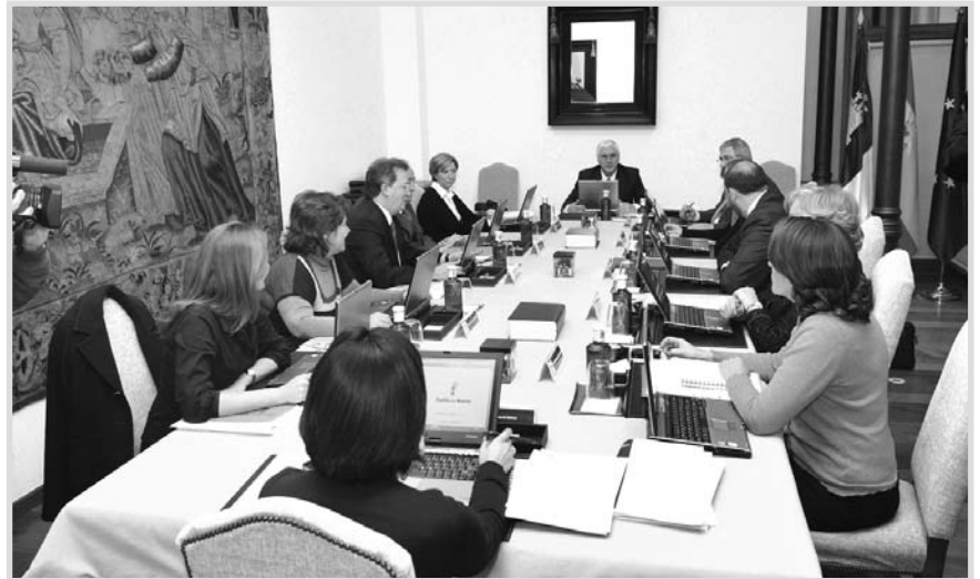
Consejo de Gobierno de Castilla-La Mancha.

decidido presentar alegaciones ante el Gobierno de España. Según informó la Junta, las alegaciones se basan en razones de ordenación urbanística, planificación territorial, protección del patrimonio, desarrollo