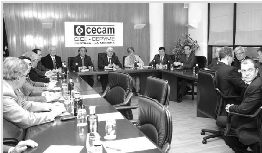
El presidente Barreda, durante la reunión con los dirigentes del CECAM.

Por otro lado, el plan pretende facilitar el acce-