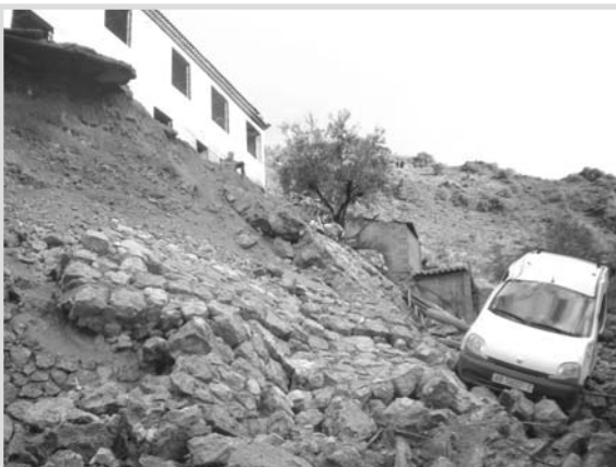
Imagen de la calle Barranco Alto, en Ayna.

➤ Final nacional: Del 24 al 28 de junio, en Palma de Mallorca. Participarán los tres primeros clasificados en Castilla-La Mancha.