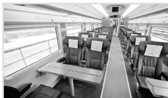
Interior de uno de los vagones de pasajeros.

Los servicios de Alta Velocidad de Renfe en el corredor Madrid-Valencia podrían ahorrar anualmente unos 950.000 desplazamientos de automóviles y 6.000 vuelos de aviación comercial.