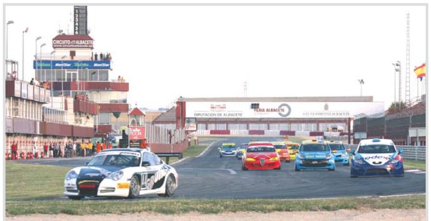
Un momento de la prueba de GT.

La carrera de GT fue todo un espectáculo de colorido y sonido de los bólidos