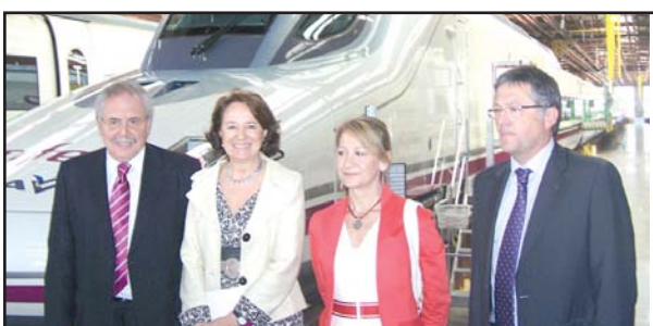
Presentación de los trenes Ave Madrid-Levante.

En una primera fase, el tren de ancho variable S-130 alcanzará los 250 kilómetros por hora