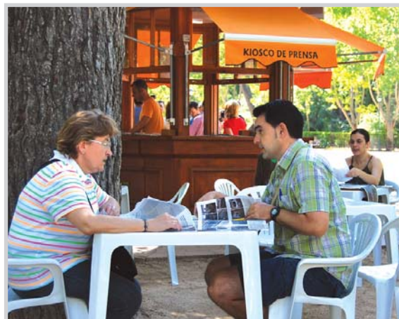
Quiosco de prensa del parque Abelardo Sánchez.

El año pasado, con un quiosco menos -el de la Fiesta del Árbol no se abrió por obras en el parque-, utilizaron este servicio 27.863 personas.