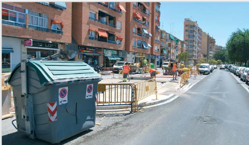
Algunos de los contenedores que quitarán cerca de la Feria.

ofrezca más monolitos y el 10% para la que ofrezca más placas. Otro aspecto, puntuado con el 15%, es la mejora en la oferta de nueva señalizaciones, es decir, la de los recursos turísticos que, actualmente, están en proyecto o en ejecución, como, por ejemplo, el Centro de Interpretación del Agua y el Museo Nacional del Circo. Y, por último, con el 5%, las mejoras económicas y el cumplimiento de una determinada solvencia económica por parte de la empresa.