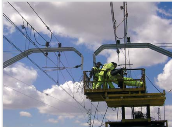
Unos operarios ultiman la catenaria de la alta velocidad.

Se trata de una fase previa para la realización de pruebas de tráfico ferroviario