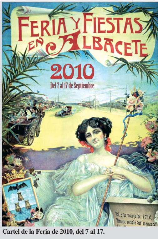
Cartel de la Feria de 2010, del 7 al 17.

La Feria de Albacete, este año, seguirá siendo del 7 al 17 de septiembre, como de costumbre. No hay ningún tipo de ampliación oficial ni prolongación del programa. Ocurrirá como en otros años que el fin de la Feria ha coincidido con viernes o sábado: que el recinto ferial se mantendrá abierto, aunque con la Puerta de Hierros cerrada, la Virgen en la Catedral y el calendario ferial liquidado. Lo único que se prorroga de forma oficial es el operativo de limpieza y vigilancia. No obstante, se estudiarán (y aprobarán) determinadas solicitudes de celebración de espectáculos, como es el caso de una novillada en la plaza de toros y de un concierto musical. No se puede ir contra la tendencia natural de tratar de ampliar las fiestas, especialmente en lo que toca a los más jóvenes, que son los que aún se quedan con ganas, aunque el cuerpo esté a punto de desfallecer. Para los que querían 20 días de fiesta (hasta el 26), una mala noticia. Será como en las últimas décadas, de once días, del 7 al 17. La propinilla ya la pone cada uno.