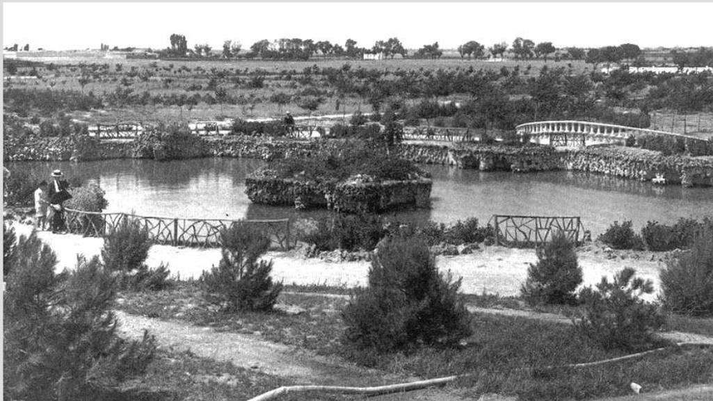
Imagen de los inicios del Parque Abelardo Sánchez, llamado Parque de Canalejas.

La historia del parque comenzó el tres de agosto de 1910, cuando el Pleno del Ayuntamiento de Albacete aprobó su creación. Seis meses después, el 23 de febrero de 1911, se inició la plantación de los árboles. En un principio, se denominó Parque de Canalejas , en honor al ex presidente del Gobierno, José Canalejas , asesinado en 1912. Durante el Franquismo, se llamó Parque de los Mártires , y fue con la llegada de la democracia cuando pasó a denominarse con su nombre actual, Abelardo Sánchez , en honor al alcalde que promovió su cons-