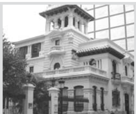
Cámara de Comercio.

La actividad finalizará con el coloquio que se genere entre los asistentes con las cuestiones y dudas que hayan podido surgir durante la exposición.