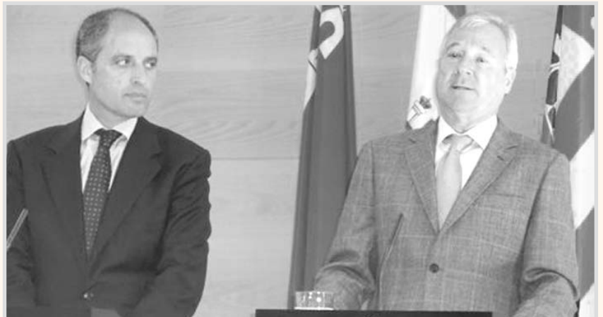
Francisco Camps y Ramón Luis Valcárcel.

En referencia a la toma en consideración, en el Pleno de las Cortes de Castilla-La Mancha, de la Proposición de Ley del Agua de Castilla-La Mancha, Valcárcel manifestó que “esto es España, el Tajo es un río español y la Constitución dice que esos recursos son de todos los españoles”.