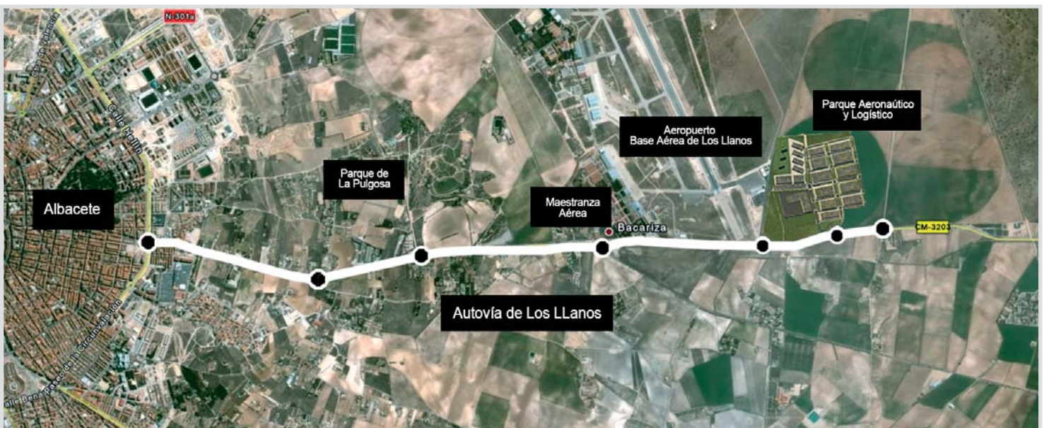
Trazado de la autovía de Los Llanos.

copter, ITH e INAER. Tiene una superficie total de 500.000 metros cuadrados, de los que 230.000 ya están ocupados.