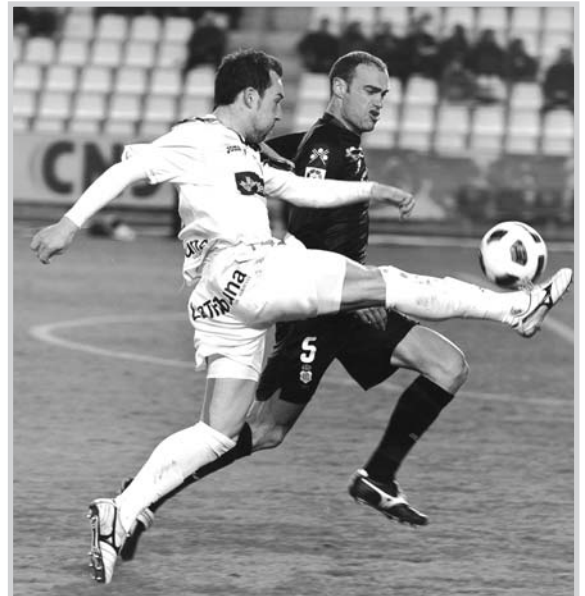
Tato intenta controlar el balón.

da amarilla, dejando a su equipo con diez. Fabricio desvió el penalti a Verza para mantener al Recre en el partido. Con casi media hora por delante y uno más, el Alba intentó buscar el tanto del triunfo. A falta de un cuarto de hora para el final, una falta sacada con rapidez por Antonio López pilló por sorpresa a la defensa onubense y el disparo de Verza desde la frontal se convirtió en el 1-0.