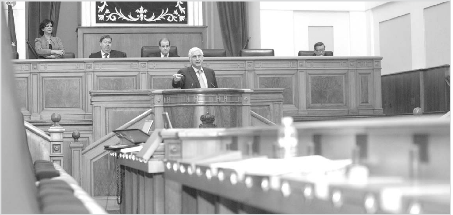
Imagen de José María Barreda ante los escaños vacíos del Partido Popular, en la sesión de las Cortes regionales.

El Pleno de las Cortes de Castilla-La Mancha vivió uno de los capítulos más vergonzosos de los últimos tiempos. Se desarrolló durante el debate de la Proposición de Ley del Agua de Castilla-La Mancha, cuyo contenido, que fue defendido por el presidente regional, José María Barreda , recoge las reivindicaciones que en materia de agua contenía la reforma del Estatuto de Autonomía, que no salió adelante en el Congreso de los Diputados por la falta de apoyo del Partido Popular, que votó en contra.