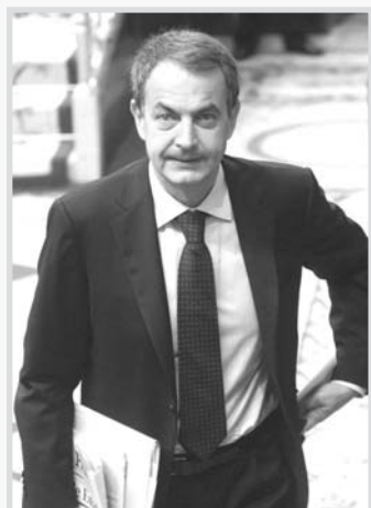
José Luis Rodríguez Zapatero.

No había en el Hemiciclo parlamentario más de cincuenta