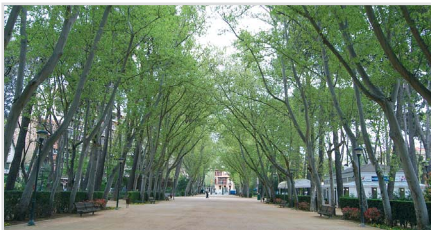
Imagen del paseo central del Parque Abelardo Sánchez.