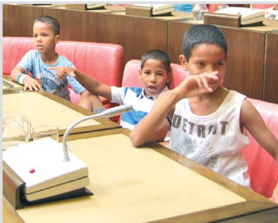
Unos niños saharauís del programa Vacaciones en Paz.

La presidenta de la asociación señaló que si la crisis económica golpea de forma dura a los países desarrollados, los pobres lo padecen peor, y muestra de ello es la situación en la que llegaron a Albacete los niños saharauís en el programa de verano Vacaciones en Paz. Muchos de ellos tuvieron que ser tratados por anemia y otros problemas alimenticios.