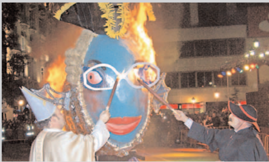
Entierro de la Sardina, el Miércoles de Ceniza.

congregó el Miércoles de Ceniza a numerosos albaceteños y comparsas. Ataviado de riguroso negro, el cortejo fúnebre partió de San José de Calasanz, donde se había instalado la capilla ardiente y el velatorio. A su llegada a la Plaza del Altozano, se leyó la popular sentencia y se procedió a su incineración para despedir definitivamente a don Carnal dándole la bienvenida a doña Cuarema.