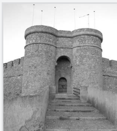
Castillo de Chinchilla.