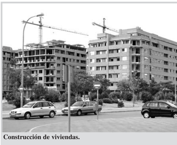
Construcción de viviendas.