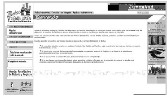
Página web de Vivienda Joven.

vienda; el portal " www.viviendajovenclm.com ", que permite acercar los servicios a los ciudadanos sin necesidad de desplazarse a las oficinas, y ayudas económicas para los gastos de Notario y Registro.