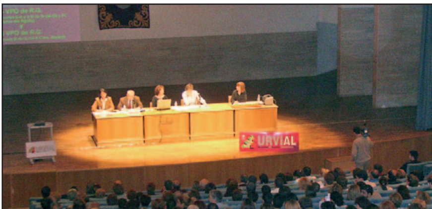
Sorteo de Viviendas Protegidas de Urvial, en el Auditorio Municipal.