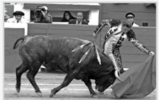
Pasión Gitana, desafortunado en La México.