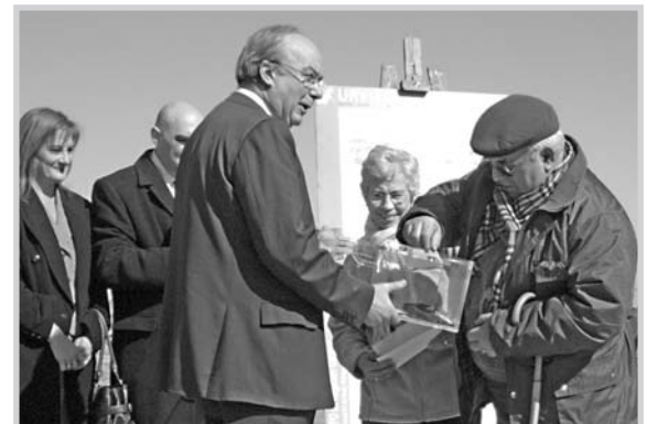
El alcalde junto a los propietarios de las nuevas viviendas que se construirán en la Hoya de San Ginés.

tos pisos, que correrá a cargo de la empresa Fomento de Construcciones y Contratas, supone una inversión cercana a los nueve millones de euros. Se trata de viviendas con una dimensión media de 90 metros cuadrados, que se han sorteado entre solicitantes del régimen general (32), futuros matrimonios (24),