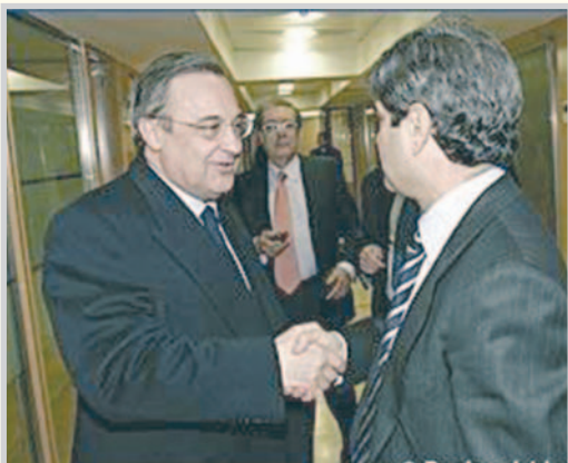
Florentino Pérez y Fernando Martín, su sucesor.

La que se armó con la dimisión de Florentino Pérez, el ya ex presidente del Real Madrid. Crió a un monstruo llamado los galácticos y se lo han llevado por delante, para dejar paso a alguien que tratará de meterlos en cintura o desprenderse de ellos. Ahora, ya habrá pocos que no vean en la renuncia de Camacho un acto de coherencia ante una situación disparatada. Cuando le negaba el permiso a un galáctico para viajar, llamaba al presi y éste consentía. ¿A quién llamarán ahora?