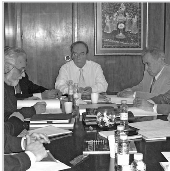
Miembros del Consorcio del Museo de la Cuchillería, durante el último pleno.

La Diputación ultima la adquisición de cuchillos de los siglos XVIII, XIX y XX para su donación