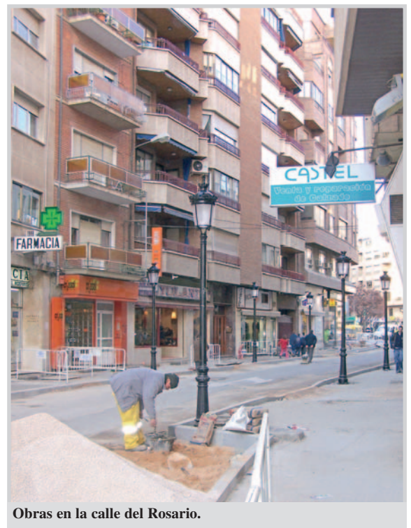
Obras en la calle del Rosario.

Con estas actuaciones habrán concluido los trabajos de la primera fase del Plan de Revitalización del Comercio, para la que se habían previsto 1,3 millones de euros. Todavía quedarán unos 300.000 euros que se emplearán en el año 2007.