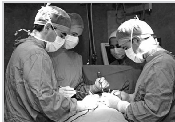
Intervención a una paciente con cáncer de mama.