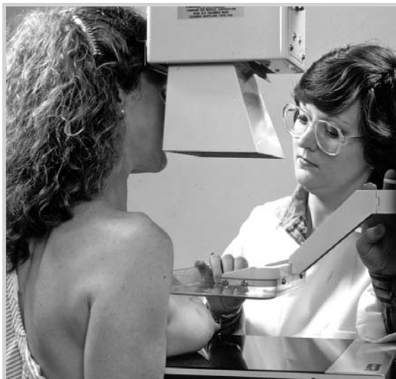
La prevención es la mejor defensa.

El presupuesto que la Junta de Comunidades destina a esta campaña es de 1.568.743 euros. Además, este año, con el fin de reducir los posibles casos de cáncer, la primera cita que se realizará cuando se observe una imagen radiológica no concluyente será de seis meses, en lugar de un año como había sido hasta ahora.