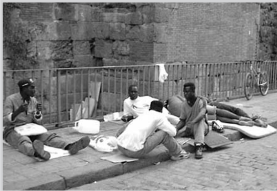
La inclusión social de los inmigrantes, a estudio.

El director del servicio apuntó que durante 2005 el Observatorio, que lleva un año y tres meses en funcionamiento, ha trabajado en los proyectos “Incentivos de grupos juveniles en el barrio de El Pilar”, “Módulo de igualdad de género”, “Estudio del padrón en 2004” y “Ciudad Educadora”. Los resultados de estos estudios, dijo Susías, se ofrecerán en abril.