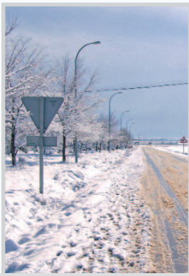
Agua y nieve en los campos.

bién estaban llegando a sus últimas reservas, con todo lo que ello puede significar para el abastecimiento de agua potable, que la economía de Villarrobledo se basa principalmente en la agricultura y de ésta, el viñedo, porque para algo es la mayor ex-