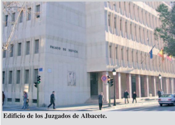
Edificio de los Juzgados de Albacete.

Así lo han establecido los ministerios de Justicia y de Interior