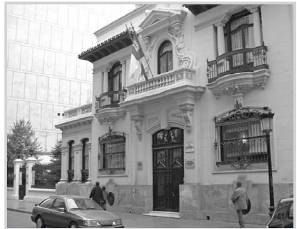
Edificio de la Cámara de Comercio, sede del Colegio Electoral de Albacete.

documento con el sello de la empresa y firmado por la persona que acredite poder suficiente para otorgar representación a favor del designado.