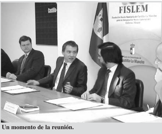
Un momento de la reunión.

“También, se aprobó un importante convenio con el IMSERSO y la ONCE, suscrito por este Ayuntamiento, para la creación de cuatro nuevas licencias del servicio de taxis accesibles, que hará posible que los compromisos de cooperación e integración social de las personas con discapacidad sigan marcando una realidad para la que seguimos trabajando día a día, con un compromiso de la ciudad con el futuro de las personas con capacidades reducidas”.