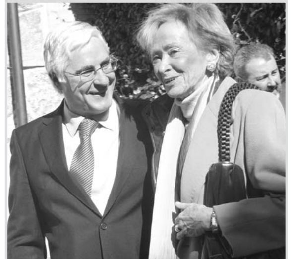
José María Barreda y María Teresa Fernández de la Vega.

“Todos juntos, el Gobierno, la Unión Europea, la colaboración de las comunidades autónomas como ésta