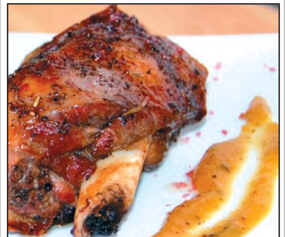
Cordero con salsa de membrillo y cebolla confitada.