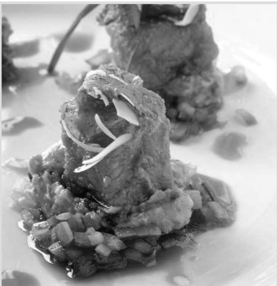
Paletilla de cordero a la menta.