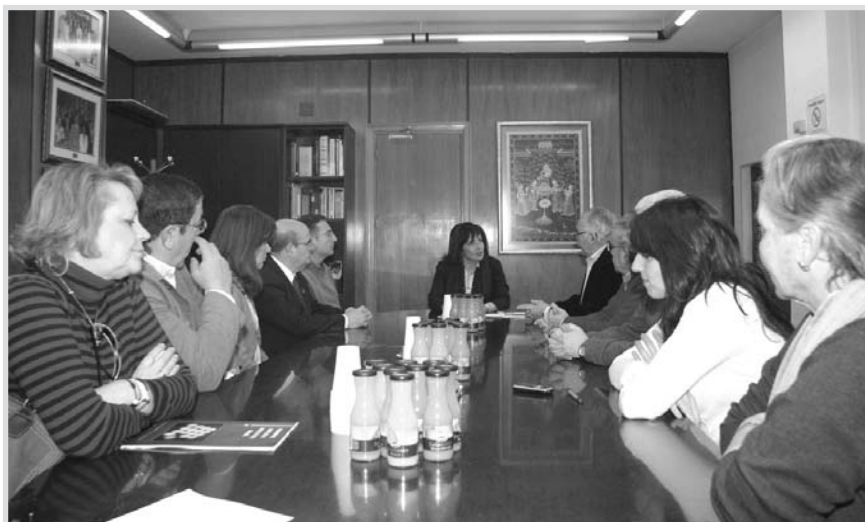
Un momento de la reunión.

Así, la alcaldesa recordó cómo una de las primeras actuaciones que llevó a cabo como alcaldesa fue la entrega al movimiento vecinal de su discurso de toma de posesión como señal de compromiso con la ciudadanía y de forma de liderar un gobierno de forma participada. “El Plan de