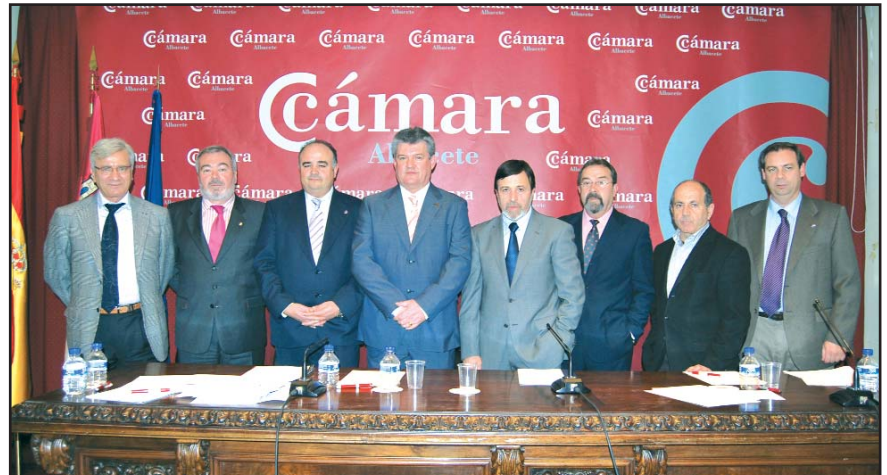
El comité ejecutivo, con los presidentes entrante y saliente, en el centro.