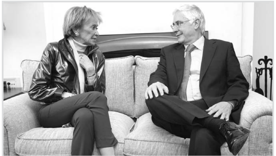
María Teresa Fernández de la Vega y José María Barreda.

A juicio de la vicepresidenta, lo que los ciudadanos de Castilla-La Mancha quieren y necesitan es que el Estatuto se apruebe