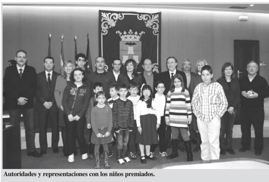
Autoridades y representaciones con los niños premiados.

en que disminuyen las prestaciones de bajas por enfermedad. "Si antes un trabajador cobraba el 100% desde el primer día de baja, ahora no cobrará los tres primeros días", a excepción de que ésa sea su única baja laboral al año y, en cuyo caso, en lugar del 100% lo que percibiría es la proporción del salario base, sin incluir sus complementos.