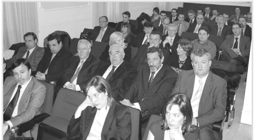
Los miembros de Pleno que eligieron al comité ejecutivo.