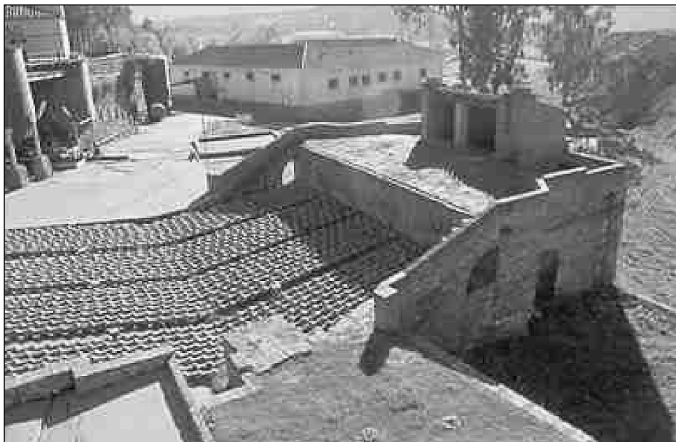
FOTOGRAFÍA 1. Hornos Bustamante (S. XVII). Explotaciones de cinabrio (Almadén).