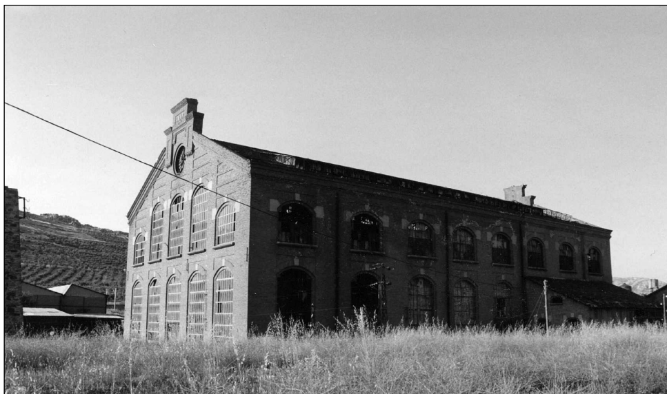
FOTOGRAFÍA 4. Apartadero Calatrava. Central Termoeléctrica (Puertollano).