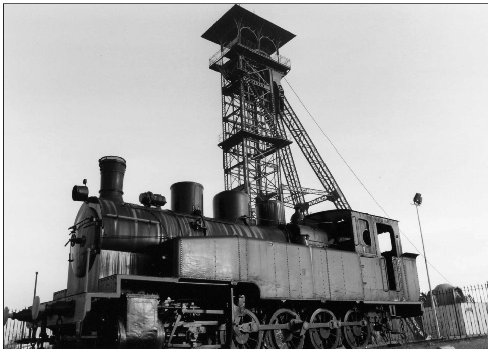
FOTOGRAFÍA 3. Museo de la Minería al Aire Libre. Pozo Norte y «La Gorda» (Puertollano).