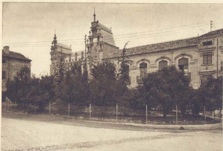
Plaza de Cristóbal Sánchez

Pujante su comercio, próspera su industria, Albacete cuando terminen las obras de construcción de la línea de Baeza a Utiel dispondrá de un nudo tan importante de comunicaciones férreas que no encontrará competencia en los mercados.