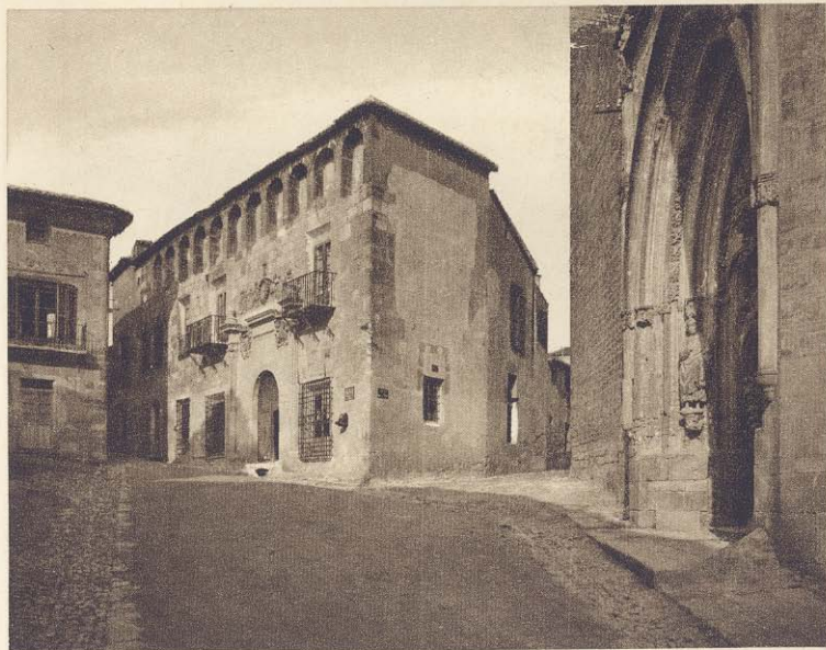
Chinchilla - Una calle

HOTEL REGINA - Pensión completa 10 ptas.