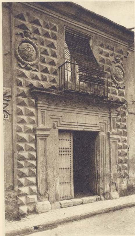
Casa de los Picos