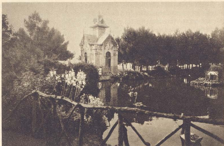
Parque de Canalejas