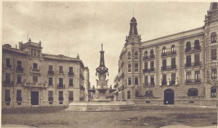
Plaza de Canalejas