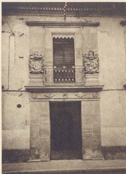
Una casa señorial