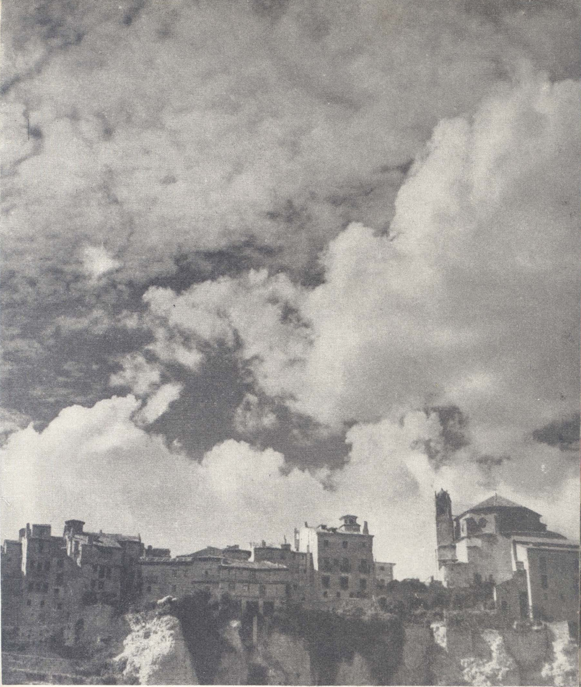
Iglesia de San Pedro