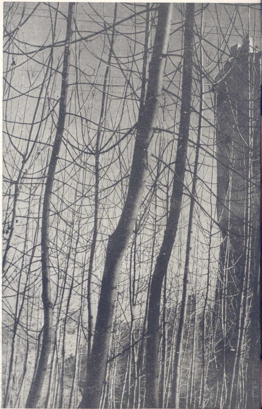
Casas en la hoz del Júcar