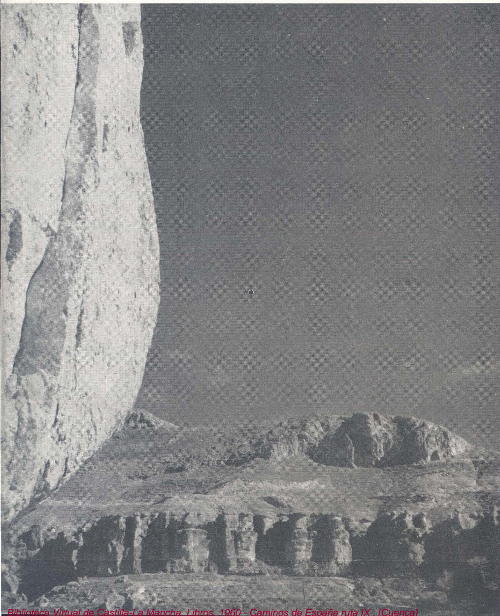
Paisaje de Cuenca