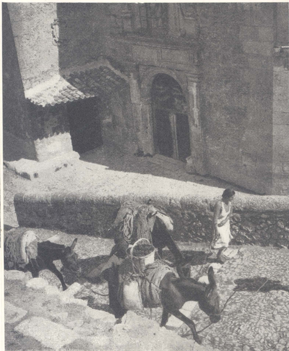
Convento de las Descalzas