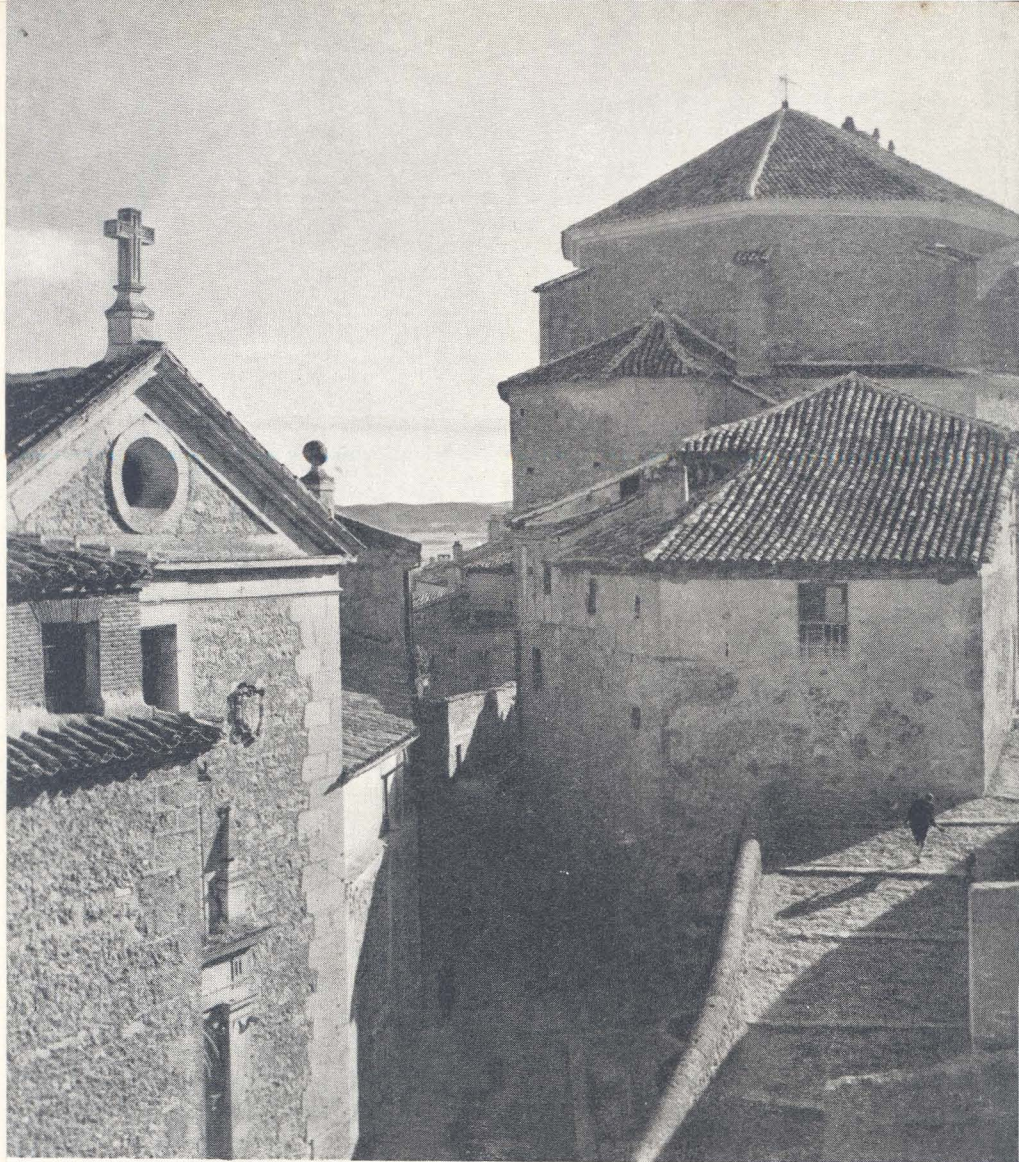
Bajada de las Descalzas