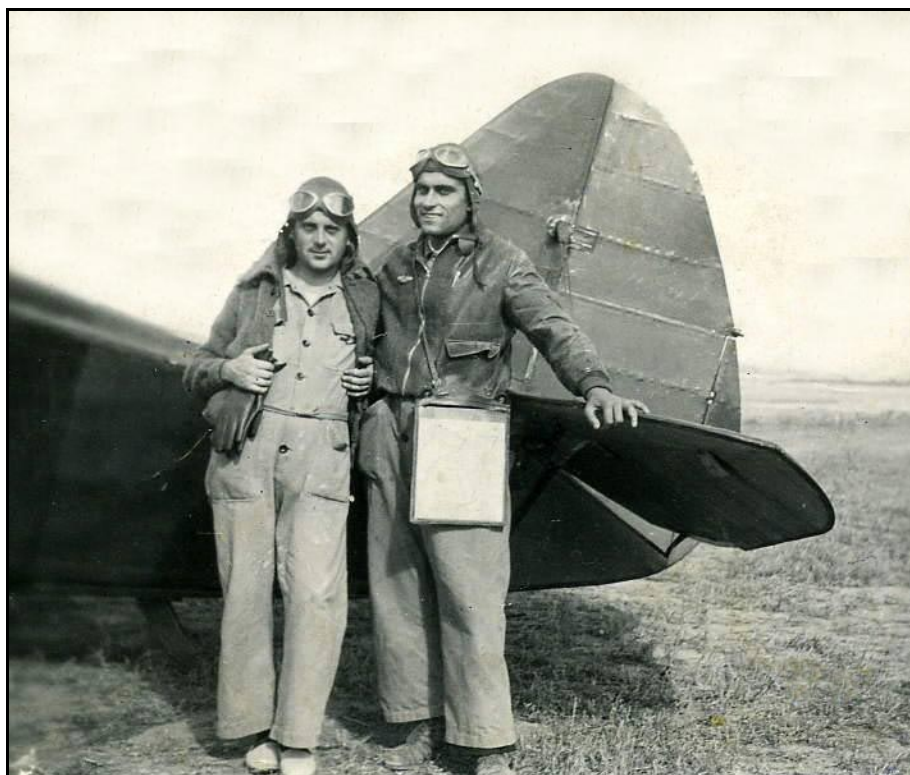
Con un compañero junto a la cola de su avión