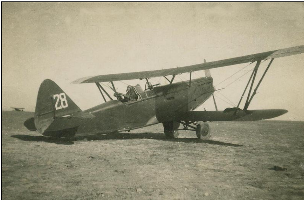
Bombardero ligero ruso Polikarpov RZ “Natacha”.

Su aparato fue derribado por fuego antiaéreo sobre la localidad de San Blas, al noroeste de Teruel, cuando su escuadrilla efectuaba una operación contra las tropas franquistas, tratando de dificultar su avance por la carretera que conducía a la capital.