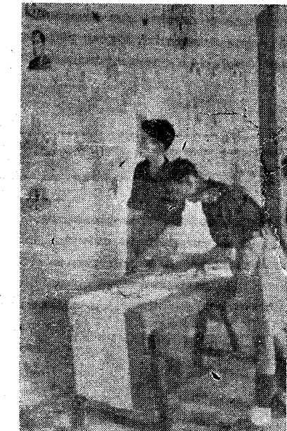
Los camaradas de las Falanges Juveniles admirando los trabajos presentados.

nuales siguientes: "Arado Romano", "Pied de Rey", "Nivel de Alfabíl", de la Escuela núm. 9.