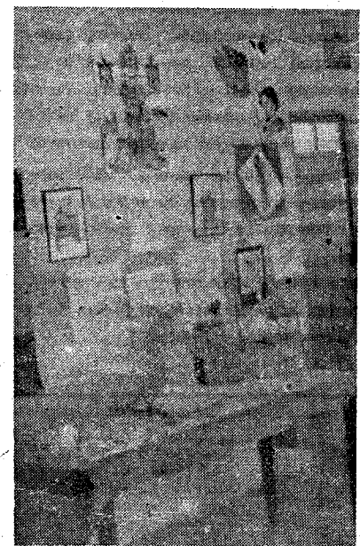
Un detalle de la Exposición del Frente de Juventudes de Manzanares.

Comenta las distintas fases del hacer diario de la Escuela, la psicología infantil y su alma pura, demostrada en esos pasajes típicos de sus pinturas y dibujo.