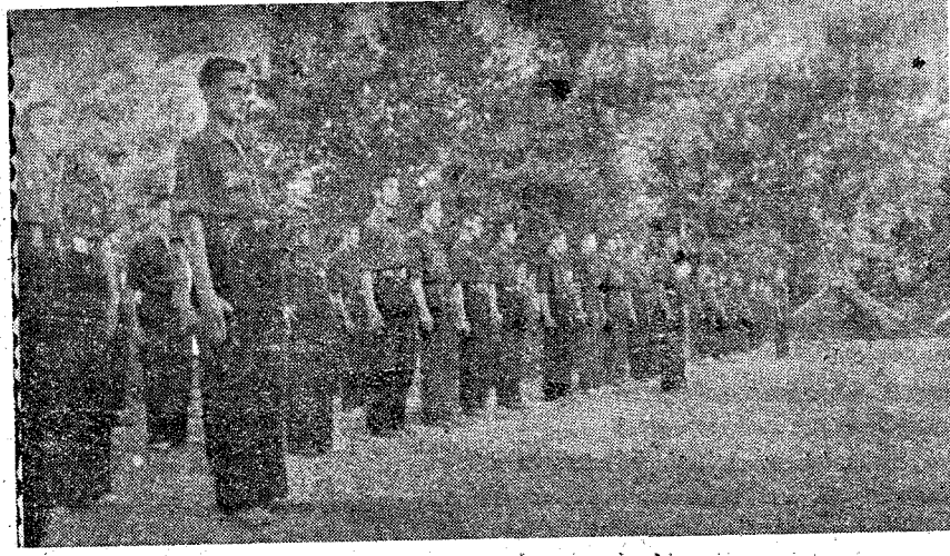
En la disciplina del Campamento se forma la juventud manchega al servicio decidido de España y de la Falange.

Otra vez nuestra provincia tiene su Campamento del Frente de Juventudes. Lo decimos con orgullo, pues para todos los que aman la Falange deben tener bien grabada en sus mentes que en esas ciudades de Iona repartidas por los campos de España, durante la época de verano, se forjan las juventudes al temple de una fe ardorosa, que llevan dentro de su alma un destino que cumplir.