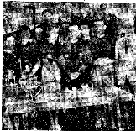
Autoridades y jerarquías que asistieron al acto inaugural de la Exposición del Frente de Juventudes

Visitamos el día 8 la Exposición, donde una Escuadra de las Falanges Juveniles de Franco monta la guardia y se