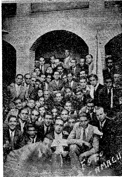
Asistentes a los Ejercicios espirituales celebrados en Moral de Calatrava en la "cancha", dispuestos a reverdecir con brioso coraje y ardoroso entusiasmo, las mayores actuaciones de sus mejores tiempos; ya que pudimos ostentar dignamente el título de uno de los equipos de verdadero renombre regional. Los segundos consolidarán su fina clase, de-rochando la sabiduría futbolística de que son peculiares.—C.