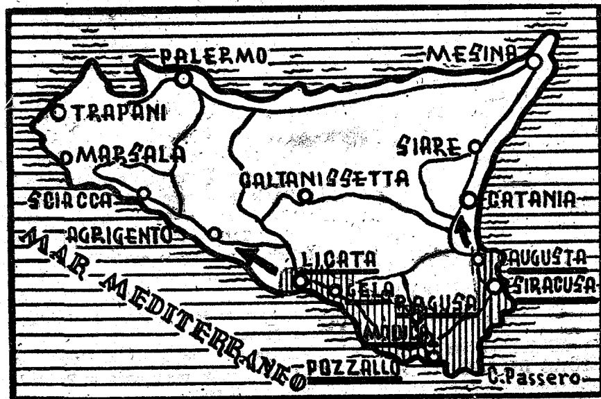
Gráfico de la isla de Sicilia, donde se producen las actuales operaciones