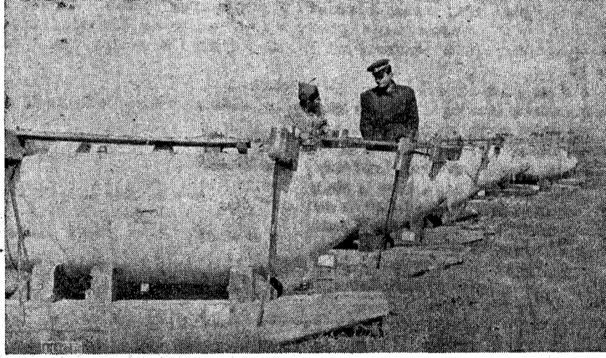
En los aerodromos de Sicilia, largas filas de bombas esperan el momento de ser transportadas a los aparatos del Eje