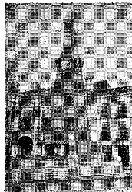
Monolito levantado en la Plaza de José Antonio de Manzanares dedicado como Cruz a los Caídos de esta localidad y que en breve será inaugurado.

Ayer lunes, cumpliendo órdenes del Sindicato Nacional del Espectáculo, y organizado por la Obra de Educación y Descanso, se celebraron funciones en los dos Cines de la localidad, proyectándose magníficas películas, con un 80 por 100 de rebaja a beneficio de los productores.