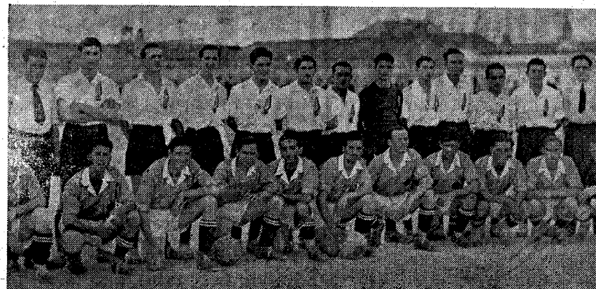
Del partido jugado entre el equipo de la Maestranza de Artillería de Madrid y el de Educación y Descanso de Valdepeñas en el que resultó vencedor el segundo por dos tantos a uno.

VALDEPEÑAS, 9.—Por mediación del Sindicato Provincial de la Vid, han sido concedidas diversas partidas de carbón a las empresas: Bodegas Bilbainas, S. A.; Domecq y otras. La Delegación Provincial comunica que todas las peticiones de carbón para las industrias relacionadas con este ramo, han de hacerse por conducto de ella.