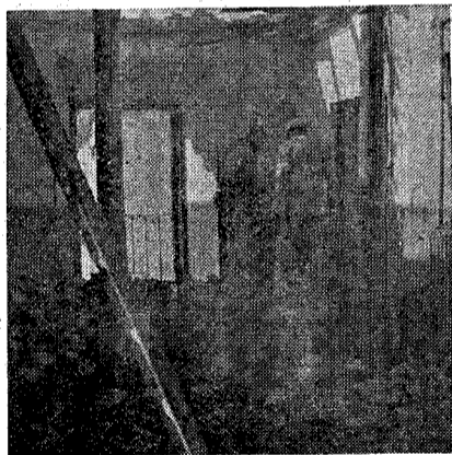
Una de las habitaciones de la casa siniestrada.

Próximamente a las cuatro y media de la mañana de hoy, se declaró un incendio en la casa número 9 de la calle de Caballeros, esquina a la del Camarín, propiedad de don Rafael Sanz. El fuego afectó únicamente al piso alto, vivienda