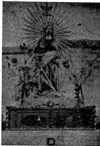
Venerada imagen de San Bernabé, Patrón de Arenas de San Juan

Esta normalización en el aspecto particular, está en vías de franca realización, pues si al principio hubo serias dificultades por no existir aperos de labranza, ni yuntas ni ganados de otra clase y además ser las cosechas de los años 1939 y 1940 francamente deficientes, sin embargo hoy las cosas han cambiado y los habitantes de Arenas sin vivir en la opulencia, han reconstruido en su mayoría sus haciendas particulares,