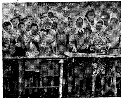
El Mayordomo (x) de Santa Quiteria y un grupo de lindas muchachas haciendo la "Caridad"