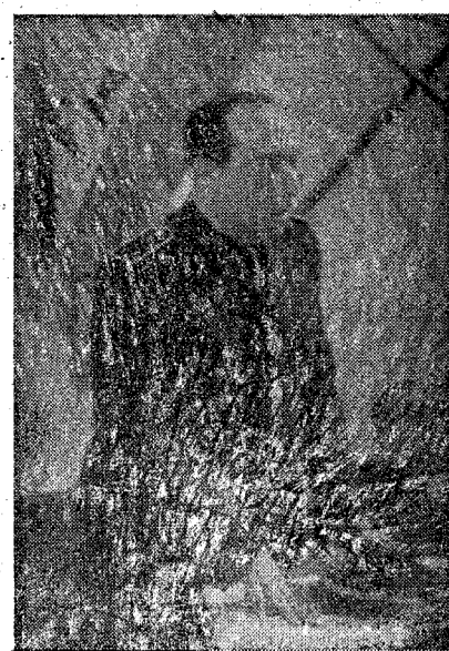
El camarada Delegado Provincial Sindical en un momento de su discurso

En la mañana del domingo, fueron cumplimentados por el Jefe local de Fa-