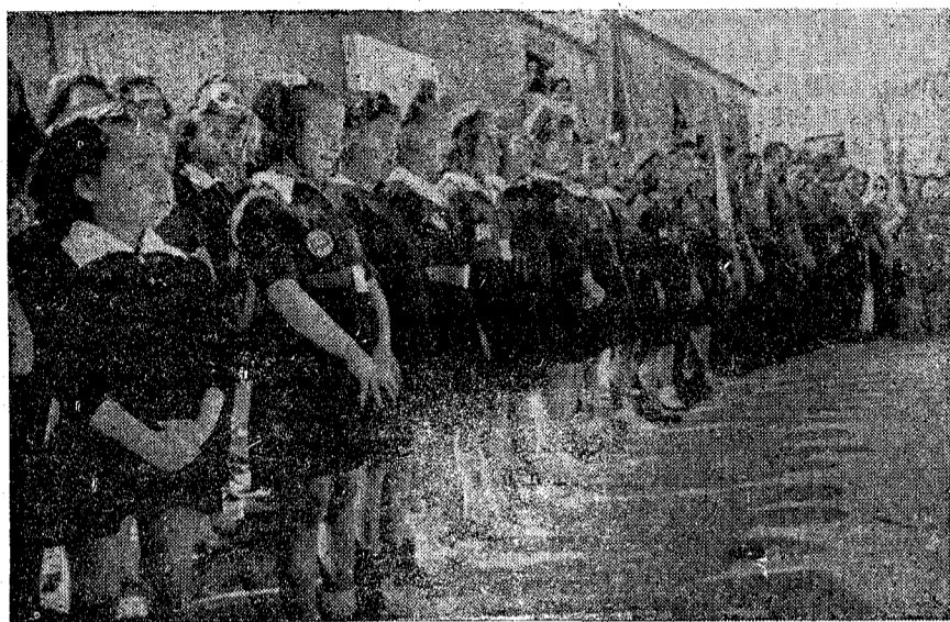
Grupo de flechas femeninas presenciando el acto nacionalsindicalista de ayer