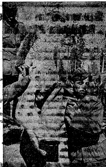
Ha llegado el buen tiempo. Los soldados de la División Azul se despojan de sus prendas de invierno

LISBOA.—Ni aún los más optimistas hubieran podido imaginar el éxito real de público y de calidad en el espectáculo que ha obtenido la velada gimnástica hispano-lusa. El Coliseo es un caserón gigantesco con más de 20.000 personas que de Teatro. El precio de las localidades era más bien caro, superior desde luego, al de cualquier otro programa en Lisboa. Esa noche, la feria popular está en pleno furor de los días inaugurales. La gimnasia rítmica como espectáculo, no deja de ser a cierta altura de la exhibición, un tanto aburrida para el espectador ordinario, aunque apasione al entendido.