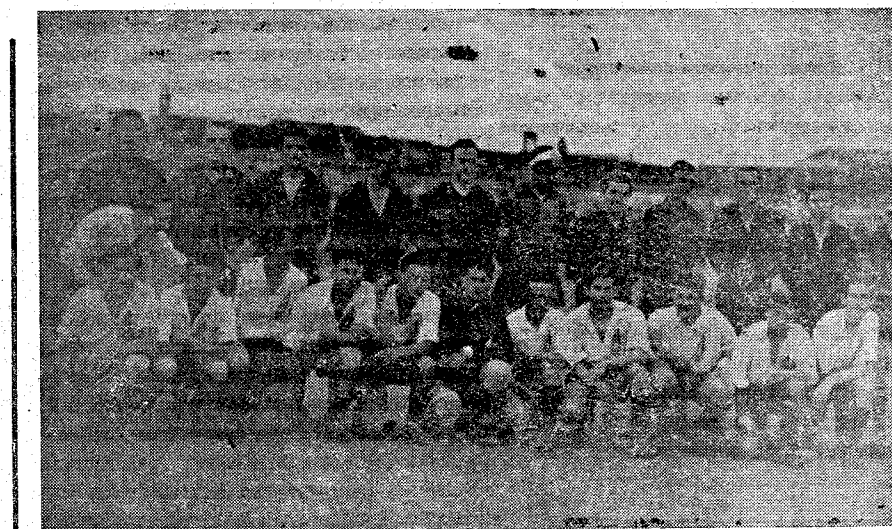
Equipo de Educación y Descanso de Valdepeñas (abajo) que venció por 9 a 0 al equipo de Defensa Química de Madrid (arriba).