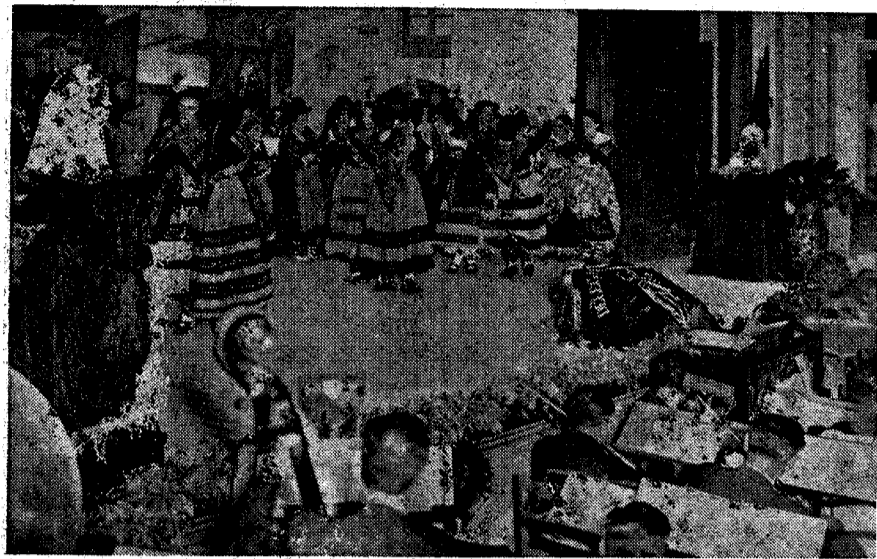
Un momento del retablo manchego "Tierras llanas" representado anoche en el Teatro Cervantes por el Cuadro de "Educación y Descanso"

En la primera parte actuaron el sexteto de la Obra Sindical y los hermanos Valencia