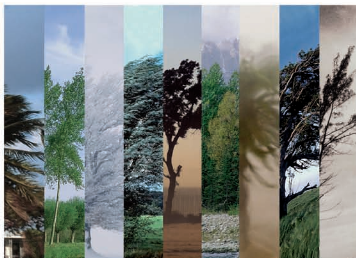
España - Francia - Italia - Alemania - México - Brasil - Reino Unido - Portugal - Estados Unidos - China - Rusia - Catar - Egipto

40 países. El mismo viento. Iberdrola. Líder mundial en energía eólica.