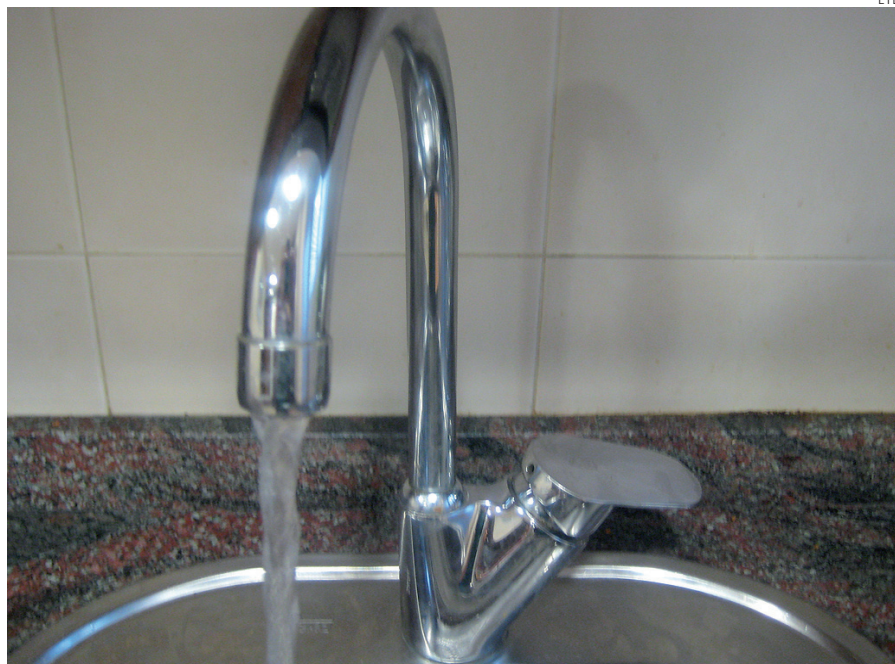
Asgeco pide al gobierno entrante que desarrolle políticas para incentivar el ahorro de agua.

Además, esperan que el Gobierno actual asuma su