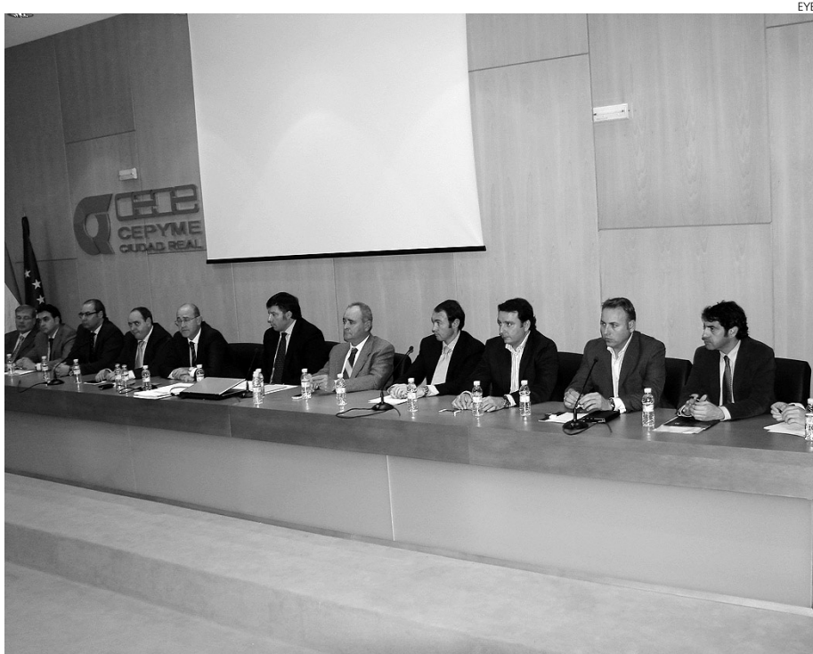
Momento de la celebración de la primera junta directiva.

La mitad corresponden a la "hipoteca" de la actual sede, mientras que el resto procede de otros compromisos