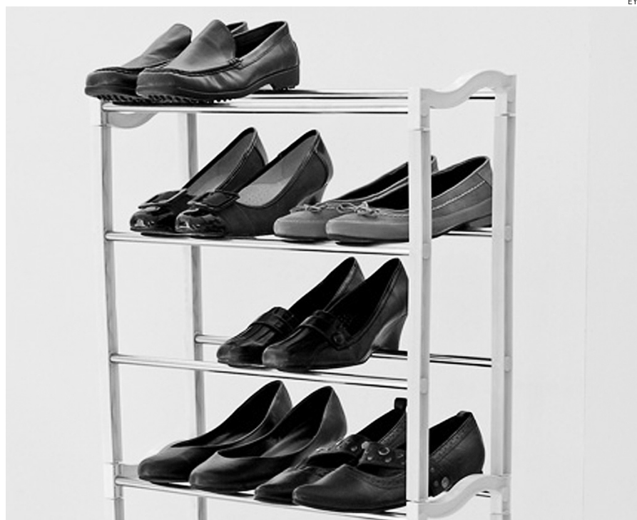
El calzado y vestido ha sido uno de los grupos más inflacionistas de la Región.

CCOO insiste que los incrementos salariales pactados no son nada responsables de estas subidas tan injustificadas en el nivel de precios. Según la última estadística del Registro de Convenio, tenemos que el incremento salarial pactado hasta octubre asciende a 1,95% en Castilla-La Mancha, muy lejos del dato in-