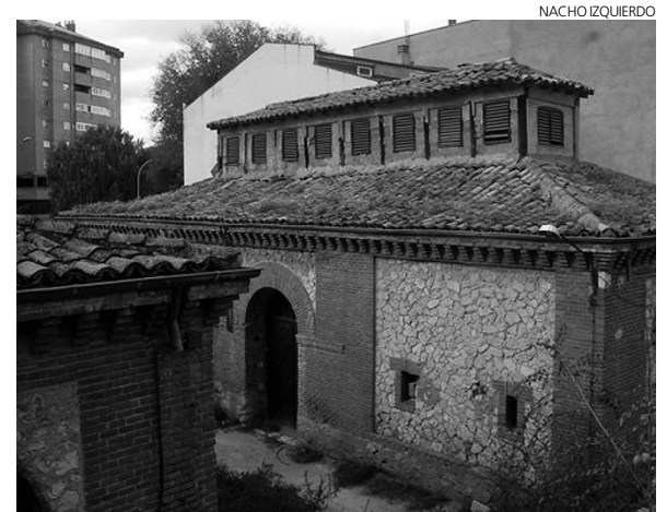
Las naves esperan una remodelación desde 2008.

Además de las obras de rehabilitación de los inmuebles, adecuación de los mismos y construcción de nuevos espacios y elementos que den una nueva imagen y utilidad a la parcela, la empresa también se ha comprometido a llevar a cabo diferentes obras incluidas como mejoras del proyecto. Así, Obras Coman proveerá en equipamiento básico del museo y el mostrador de la tienda, así como un tabique móvil.