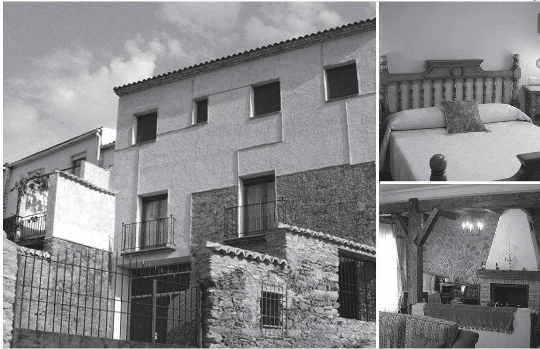
La casa rural está situada en la localidad de Horcajo de los Montes