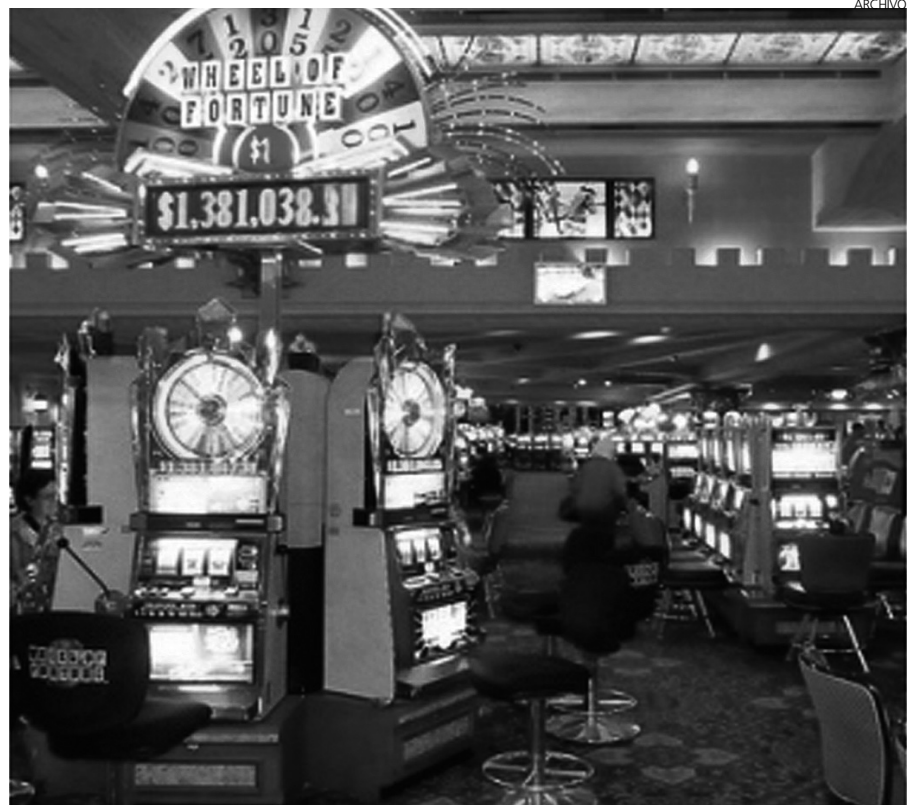
Los salones de juego presenciales tienen un futuro complicado.