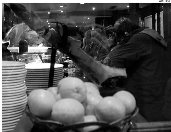
La hostelería prevé un final de año duro.

TALAEXPRES S.L. AMPLIACIÓN DE CAPITAL 30.093,80 euros RESULTANTE SUSCRITO 120.195,01 euros