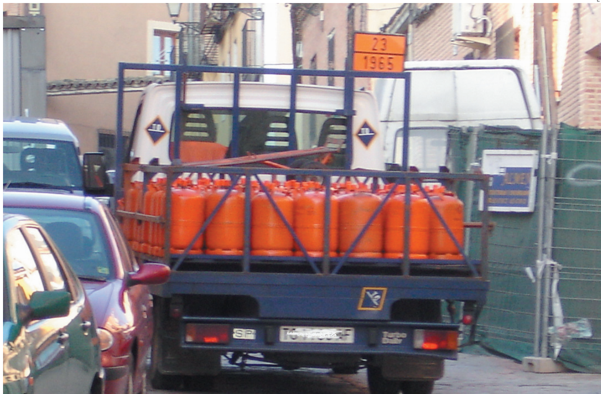
Las aguas siguen bajando revueltas en el sector del butano.

El próximo día 29 los distribuidores celebrarán junta directiva en la que se decidirán las medidas de presión que llevarán a cabo