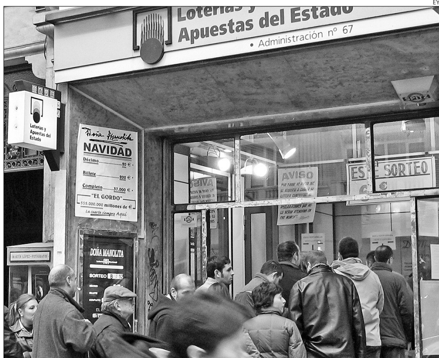
La lotería de Navidad sigue siendo una tradición.

Todas las provincias han sido agraciadas en alguna ocasión o varias con el primer premio de los sorteos que se ce-