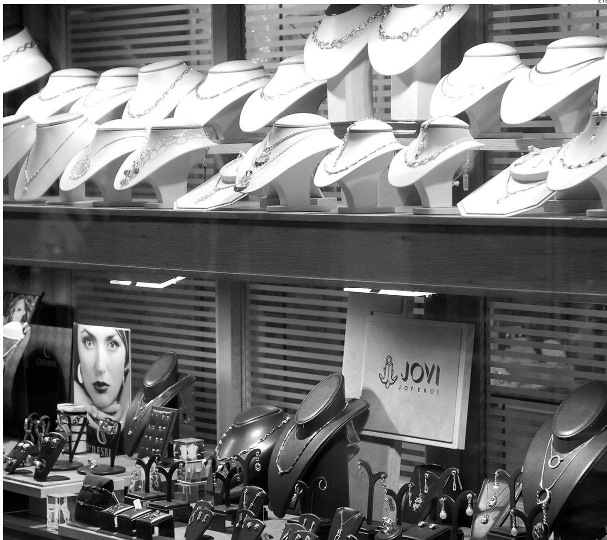
Las joyerías están sufriendo muchos robos últimamente y el sector dice que la situación es insostenible.

Aspectos como la seguridad, la competencia desleal y la caída en el consumo, son los que más preocupan en estos momentos