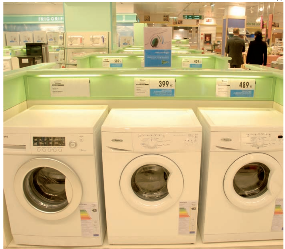
La gente apura al máximo la vida útil de sus electrodomésticos.

Un problema al que hay que añadir que parte de las subvenciones todavía no se han cobrado.