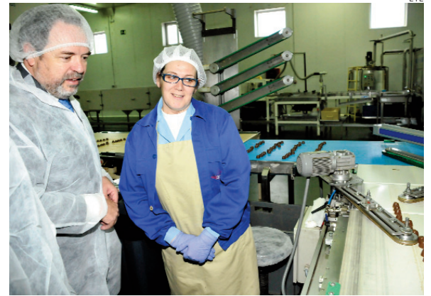
El consejero en su visita a una empresa.