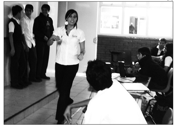
Las matriculaciones en FP han subido algo en la Región.