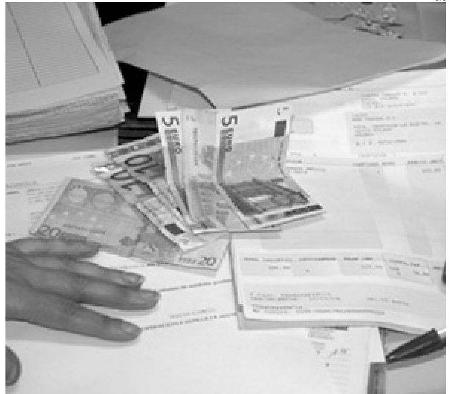
Muchas empresas privadas sí están obligadas a auditar sus cuentas.

unas condiciones) las administraciones públicas están exentas, salvo las entidades mercantiles que pertenezcan a éstas y estén sometidas al derecho privado.