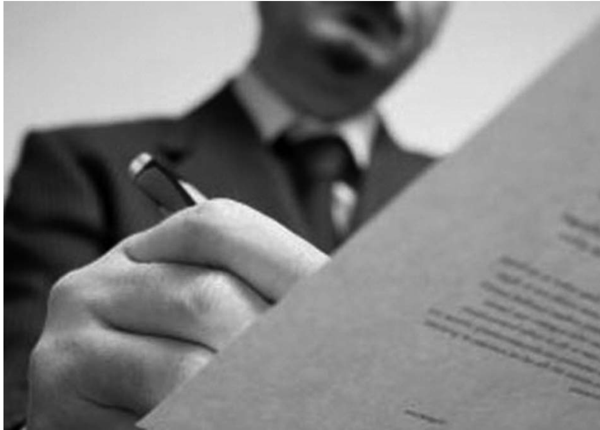
Los notarios afrontan una nueva etapa normativa.

Una novedad en lo que hasta ahora era el sistema legal de recursos a la autorización o inscripción y que con casi toda probabilidad obligará a la Dirección General de Registros y Notarados a emitir alguna instrucción con el objeto de aclarar dudas interpretativas.