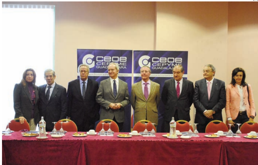
El consejero se reunió con la Confederación de Empresarios de Guadalajara.