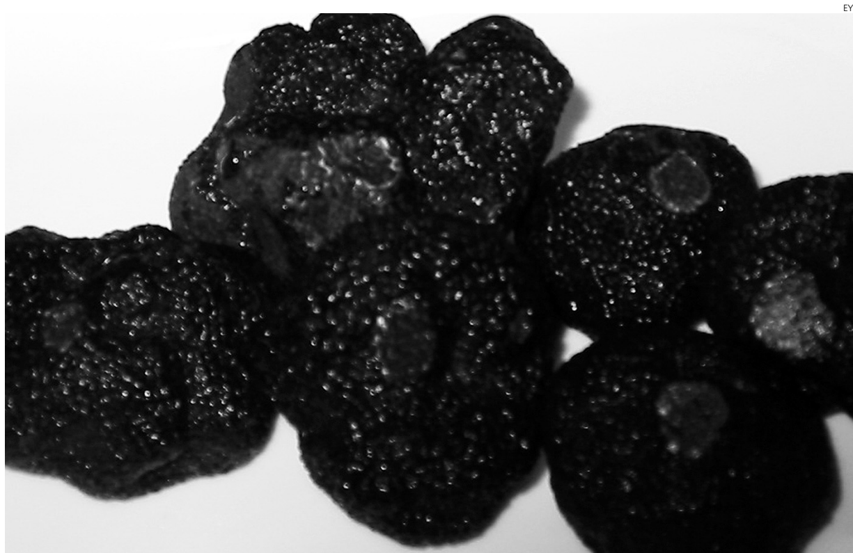
La trufa negra es un manjar exquisito.

Asimismo, también se están empezando a dar a conocer tratamientos de belleza mediante trufas, además de existir igualmente jabones, cremas para la cara, geles de baño, leche exfoliante o geles corporales. Es decir, un sinfín de posibilidades que dan una mayor salida aún a este producto para los truficultores.