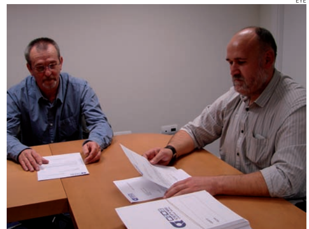
Reunión mantenida en Ciudad Real.