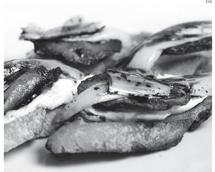
Los pinchos forman parte del encanto de este restaurante.

RESTAURANTE DE PINTXOS LUGAR: C/ Las Norias, 30 LOCALIDAD: Almansa (Albacete) TELÉFONO: 967 318642