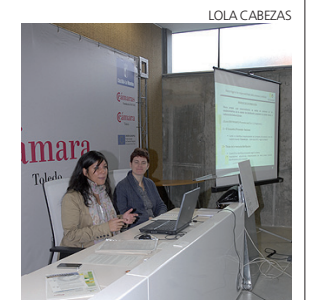
Momento de la jornada sobre envases.

Según la legislación todas las empresas que ponen un envase en el mercado deben ser responsables de su gestión.