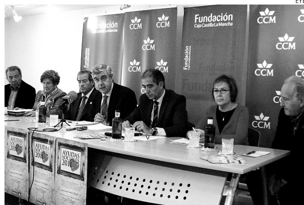
Un momento de presentación de las ayudas.

CCM está recortando por todos los lados, hasta en su Obra Social, pues el Programa de Ayudas Sociales de 2011 ha contado con una inversión reducida del 30%. En términos globales son más de 400.000 euros menos, pasando de los 1,3 millones de euros a los 890.500 euros, tal y como ha avanzado el presidente del Patronato de la Fundación Caja