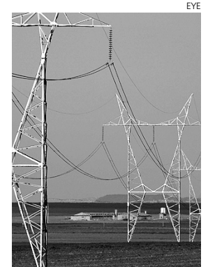
En la imagen de arriba, tendido eléctrico.

El despliegue de las redes inteligentes en Castilla-La Mancha ha empezado en las localidades de Socuéllamos y Santa Cruz de Mudela (Ciudad Real), donde la compañía energética instalará 10.000 contadores inteligentes antes de que termine este ejercicio. Estos nuevos contado-