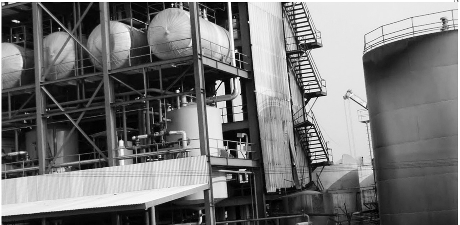
Las alcoholeras tienen una importante función para dar salida al vino de calidad inferior.

En la actualidad la cotización del vino en nuestra Región ha crecido un 20% en relación a campañas anteriores, lo que está permitiendo mantener la actividad de los viticultores