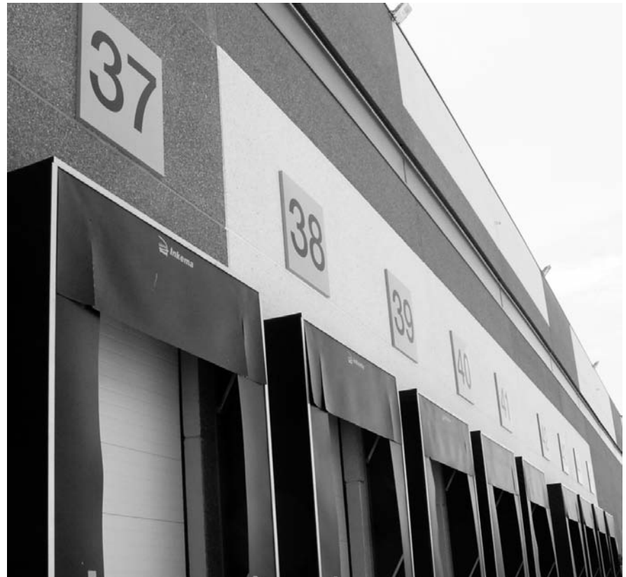
Castilla-La Mancha ha sido un punto de atracción para los operadores logísticos.

"lamentablemente se está produciendo en la creación de nuevas empresas, y por ende de nuevos operadores logísticos, ha sufrido un parón en los últimos años. Incluso la tendencia en la última década a la concentración de compañías también se ha ralentizado". Por otra parte se ha generado un deterioro en las flotas, y el servicio y las compañías en el futuro deriva en una pérdida de la competitividad.