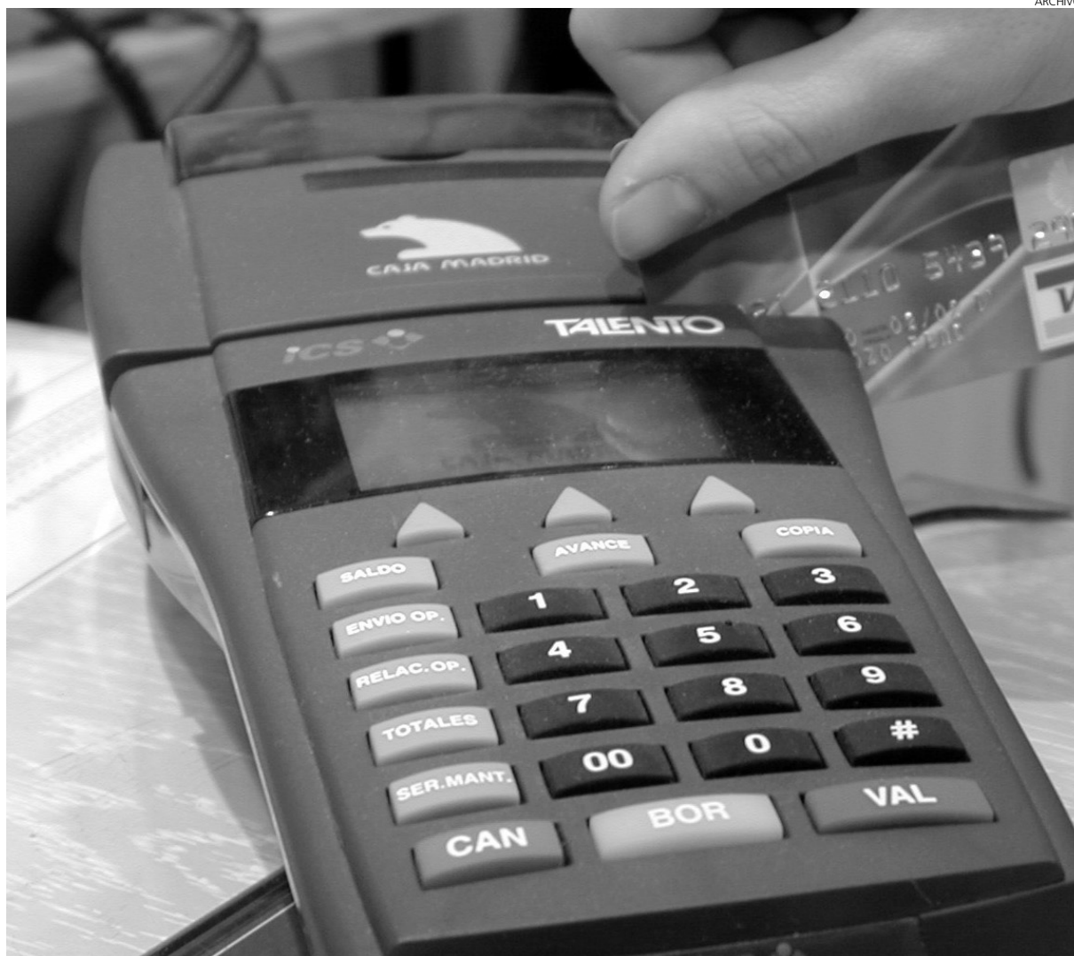
La cuantía media de las compras realizadas en 2010 con tarjeta a través de ServiRed no supera los 52 euros.

Una circunstancia que, sin embargo, no impide que la utilización del "dinero de plástico"