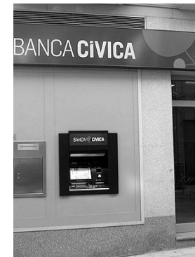
Banca Cívica lanza un nuevo producto.

El Depósito Rotación III se dirige exclusivamente a personas jurídicas y contempla dos importes posibles de contratación: 100.000 o 300.000 euros por operación. Cada cliente podrá contratar un má-