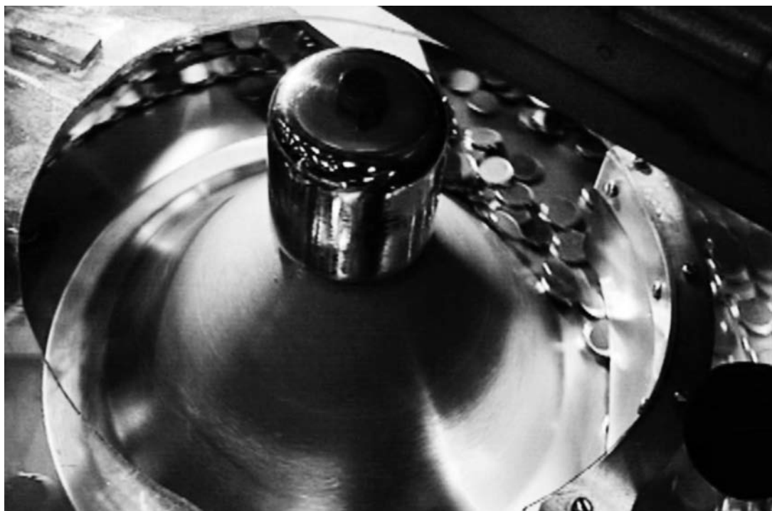
La coyuntura económica aumenta el atractivo de países hasta hace poco secundarios.

Saber cuáles serán en los próximos años supone un reto de especial trascendencia económica