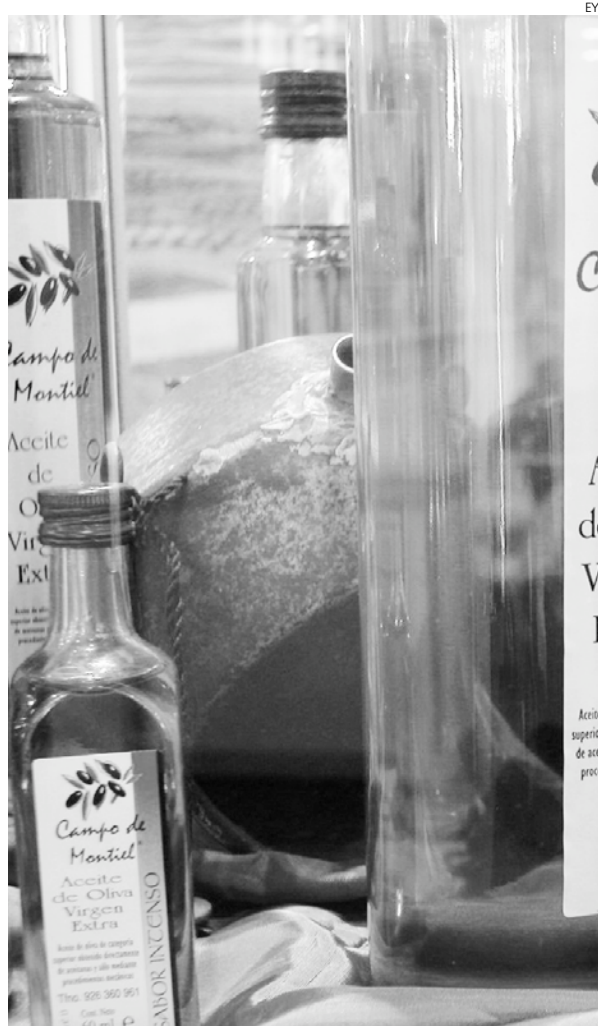
El vino es uno de los productos más vendidos en Italia.

productos más vendidos, fundamentalmente nuestras empresas comercializan equipamiento eléctrico, seguido de productos agroalimentarios, como aceite y bebidas, así como productos químicos.