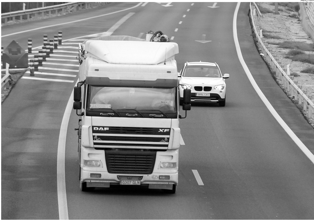
Los transportistas por carretera siguen teniendo menos trabajo.