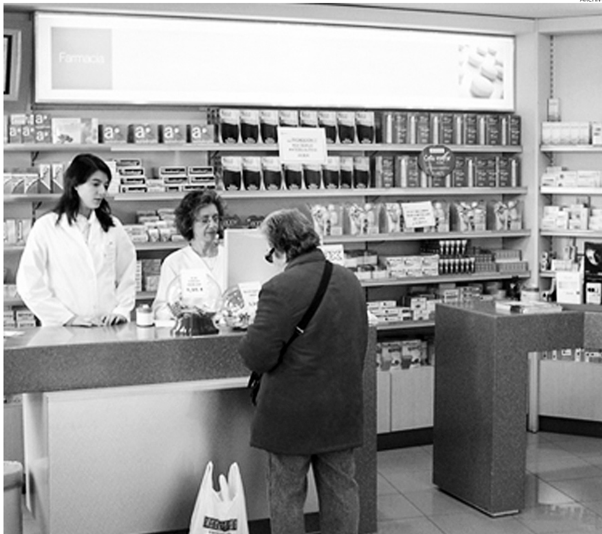
El consumo de medicamentos con marca sigue siendo mayoritario en las farmacias.

Una situación agravada por la entrada en vigor del Real Decreto 4/2010, en el que se contempla una bajada de un 30% en precios de los medicamentos genéricos, y que además de no conseguir aumentar la penetración de éstos en el mercado ha mermado aún más los ingresos de los fabricantes. "Sólo las medidas legis-