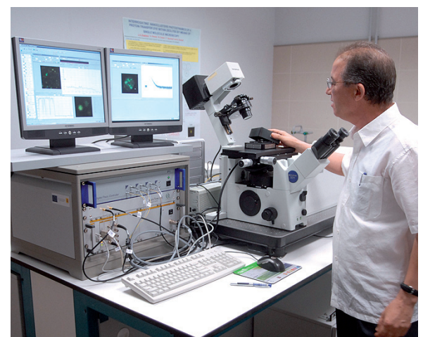
La Región está a la cola en investigación y desarrollo.

Es la tercera comunidad autónoma que menos recursos destina a este capítulo en relación a su PIB, concretamente el 0,68% , muy lejos del 3% previsto en la Estrategia de Lisboa para 2010. PÁG. 9