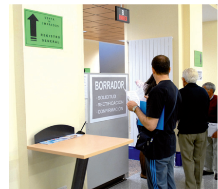
Los ingresos por IVA siguen cayendo.