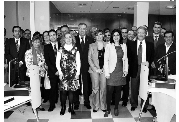
Momento de la inauguración de la nueva oficina.