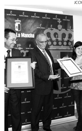
Momento de la entrega de los certificados.

"El 1-1-2 tiene como misión atender, de manera gratuita y durante todos los días del año, la llamadas de emergencia que realicen los ciudadanos que vivan en Castilla-La Mancha o transiten por nuestra región y los profesionales que lo componen facilitan una respuesta adecuada a cada situación de urgencia con una actuación coordinada y eficaz" recordó.