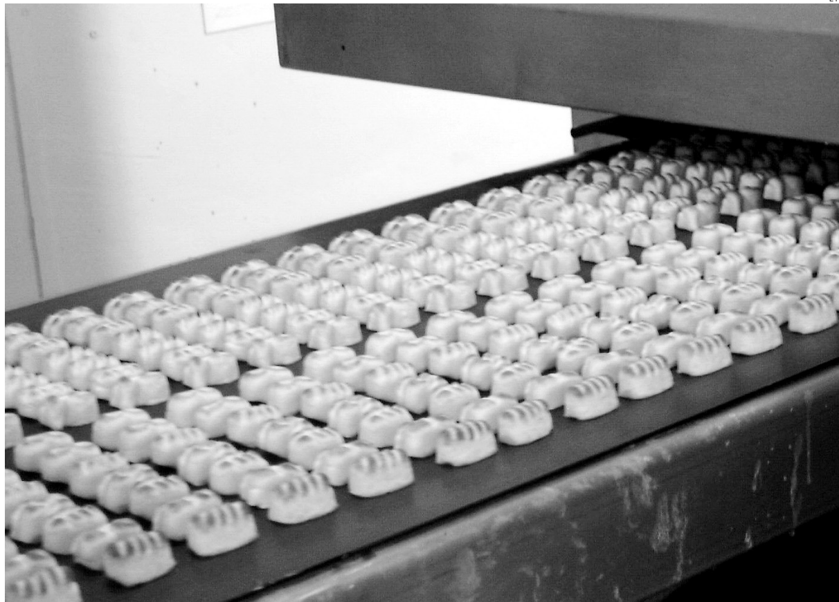
Los fabricantes de mazapán preveen alcanzar las cifras del año pasado.

A tenor de esta circunstancia, el presidente habla de expectación ante lo que se avecina en el sector. "Yo estoy con miedo porque no sé lo que puede suceder y a