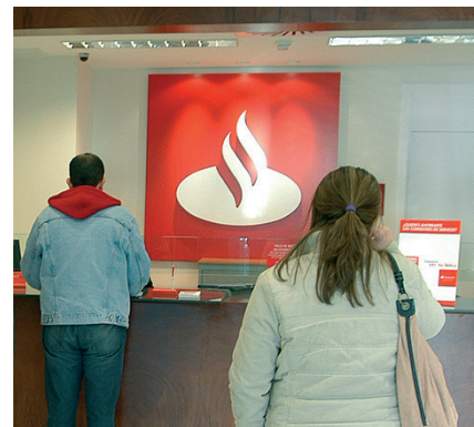
Las quejas contra los bancos aumentan.