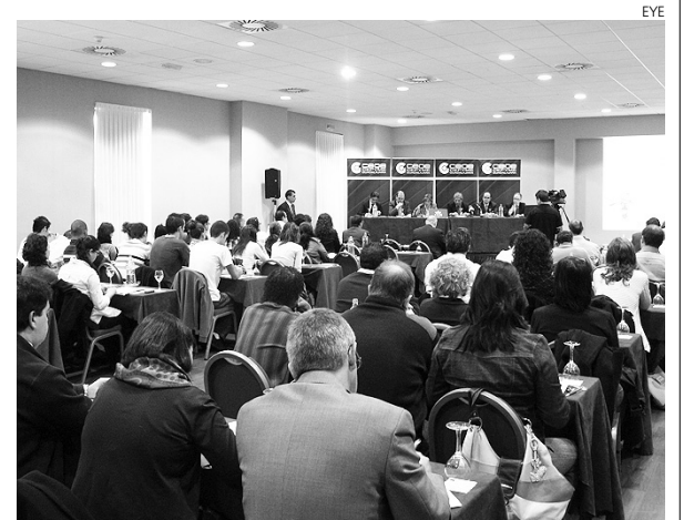
Jornada de comercio exterior de Cepe Cypyme Guadalajara.

Los empresarios, a su vez, han conocido como son las distribuciones, los importadores, mayoristas, almacenes y Peggy-backs, así como sus derechos y obligaciones. Además, los ponentes han mostrado la gran distribución como una alternativa a la exportación.