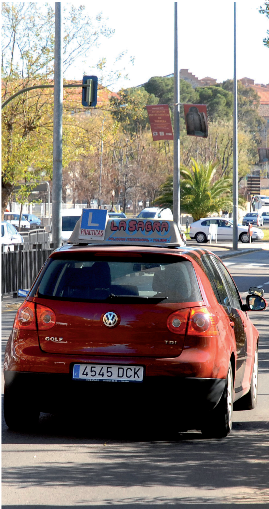
Las autoescuelas no están pasando un buen momento porque ha caído la demanda.

Solana va más allá y cree incluso necesaria una mayor formación del profesorado hasta llegar a una total especialización. “Hay que formarse para la situación actual y conside-