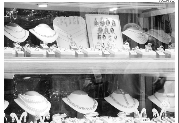
Los joyeros se defienden ante posibles robos.