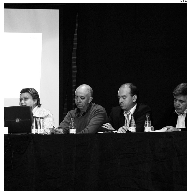
Momento de la asamblea de ADEL.