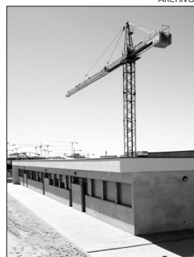
Obras del CAI de Santa María de Benquerencia.

Una vez procedido a la apertura de plicas, la Mesa de Contratación tiene que proceder a valorar cada una de las cuatro ofertas pre-