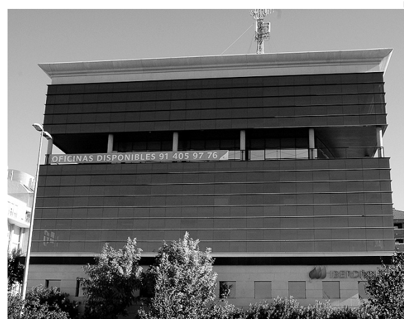
Sede de Iberdrola.

Durante los últimos años, la Empresa ha mejorado los tiempos de interrupción en