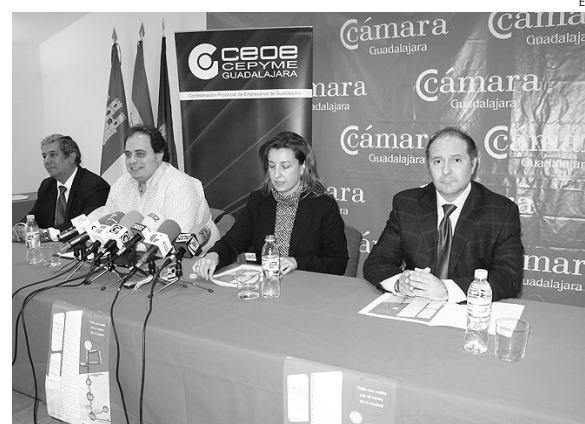
El comercio de Guadalajara intenta revitalizarse.