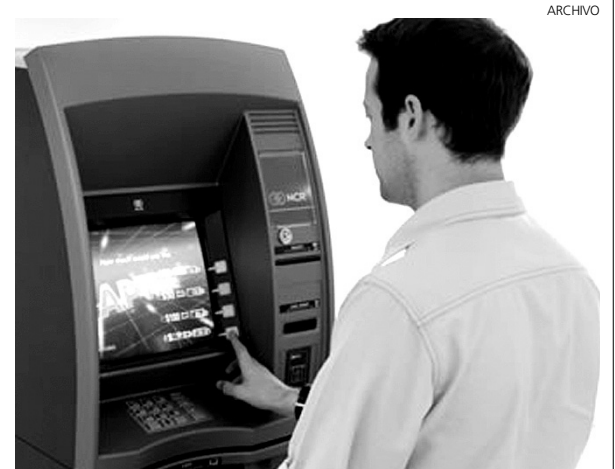
Más comisiones por usar las tarjetas.

También advirtieron que el próximo año 2011 será complicado, ya que según los expertos, confluyen un entorno macro económico complicado, en el que la recuperación no acaba de despegar, y un escenario en el que se ha reducido significativamente el negocio bancario, según el propio Banco de España.