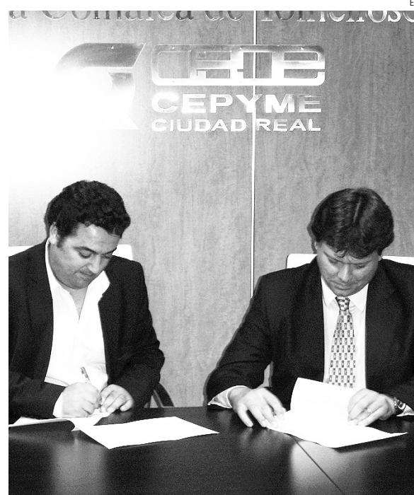
Convenio entre empresarios de Tomelloso e ICURIS.