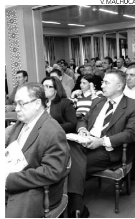
Asistentes a la presentación de la Guía Natura 2000.

Durante su intervención, el dirigente agrario insistió en que la relación directa de los agricultores y ganaderos con el medio natural permite luchar contra la erosión.