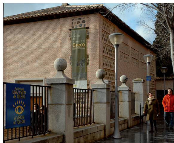
Real Fundación de Toledo.

Actualmente hay más de una veintena de registros en los que se pueden consultar los datos de estas organizaciones, mientras que en la mayoría de la UE están centralizados en un único órgano. PÁG. 5