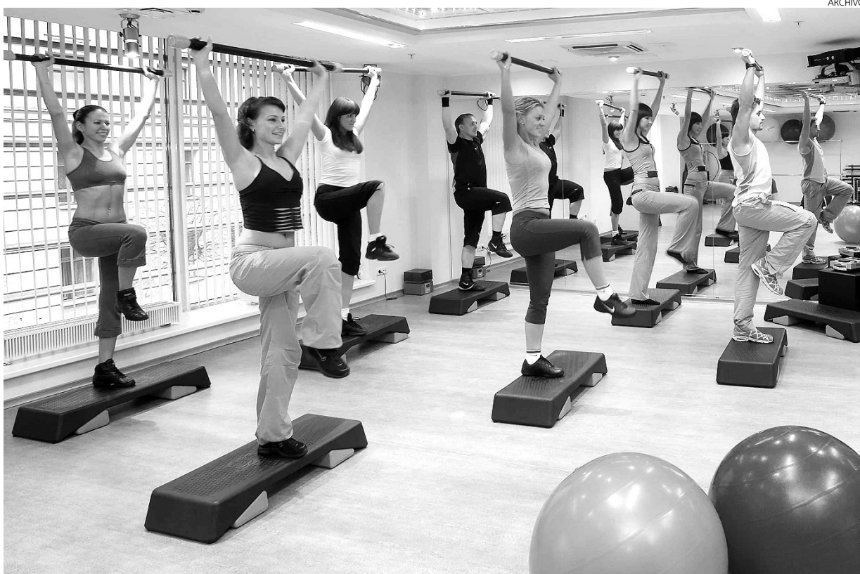
El uso de la música en los gimnasios da un valor añadido a estos negocios.

Más de 2.700 gimnasios de España, de la mano de la SGAE