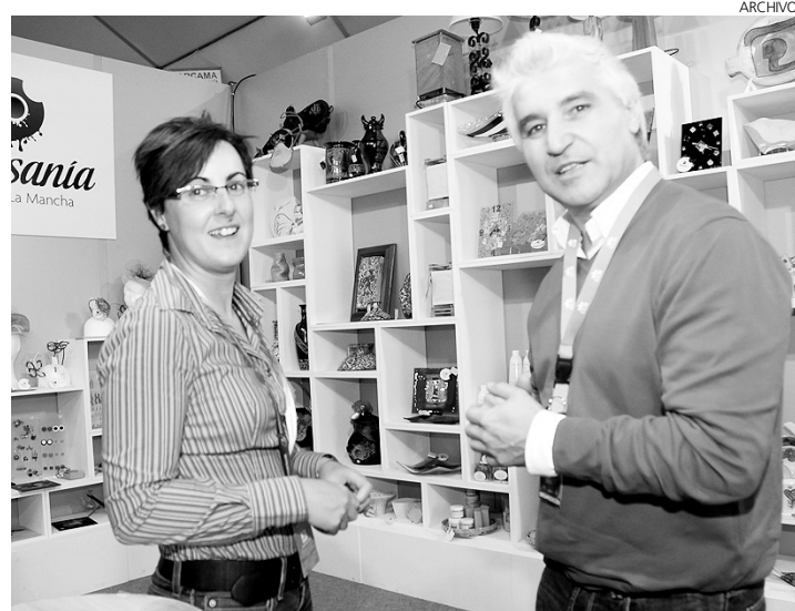
Los artesanos intentan sobrevivir a la crisis.