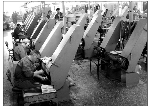
Las empresas, asfixiadas por los impagos.