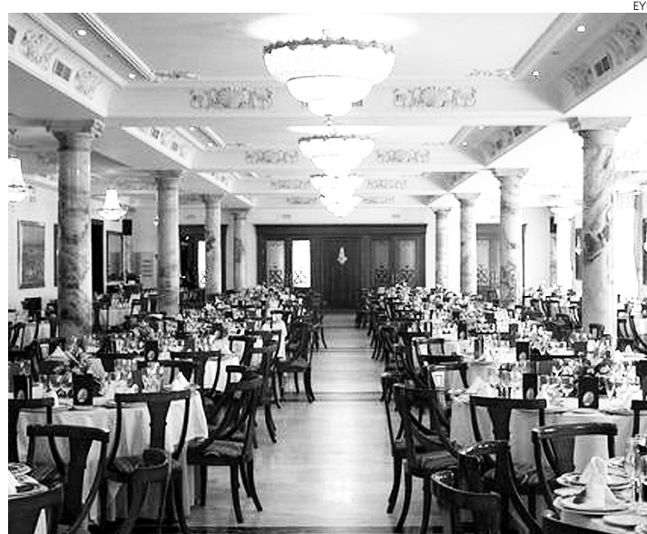
Restaurante que cuenta con la Q de calidad.