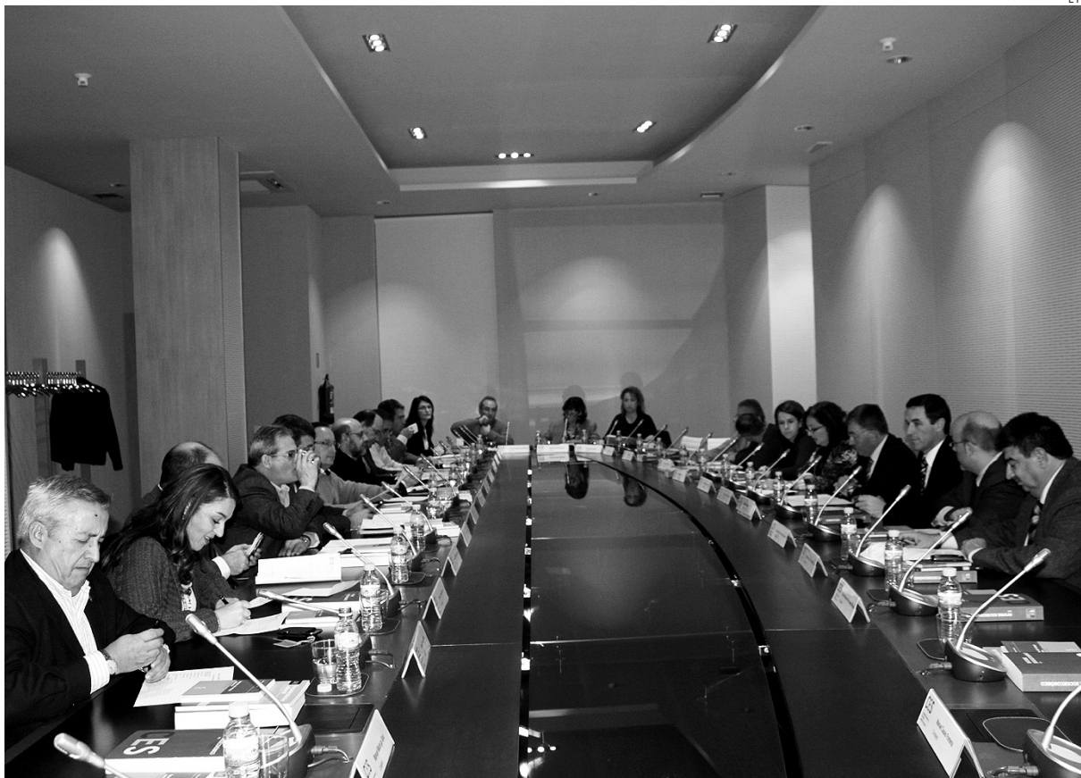
Última reunión del pleno del Consejo Económico y Social de Castilla-La Mancha.

Aunque se reconoce que el endeudamiento neto contemplado en el Proyecto de Presupuestos se reduce en un 57,73% respecto al ejercicio anterior, el Consejo quiere resaltar la necesidad de que la Administración regional sea especialmente cuidadosa con las condiciones financieras de estas operaciones, teniendo en cuenta que las circunstancias actuales de los mercados no son tan favorables como las existentes en el pasado reciente.