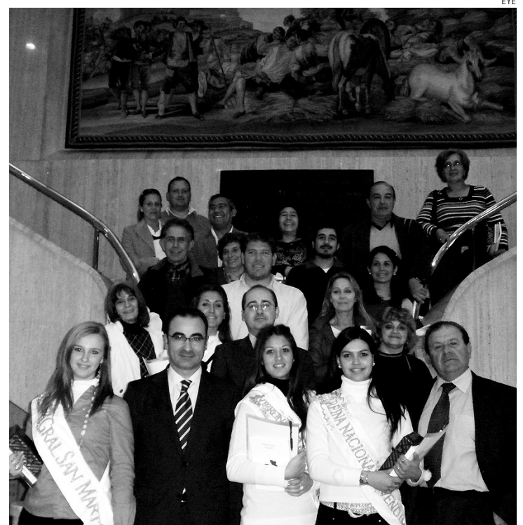
La rural de Ciudad Real recibió a una expedición de San Martín de Mendoza.