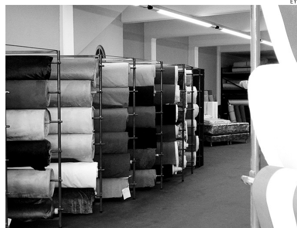
El sector textil se beneficiará de subvenciones.

Esta iniciativa responde al compromiso expresado por el presidente Barreda en el