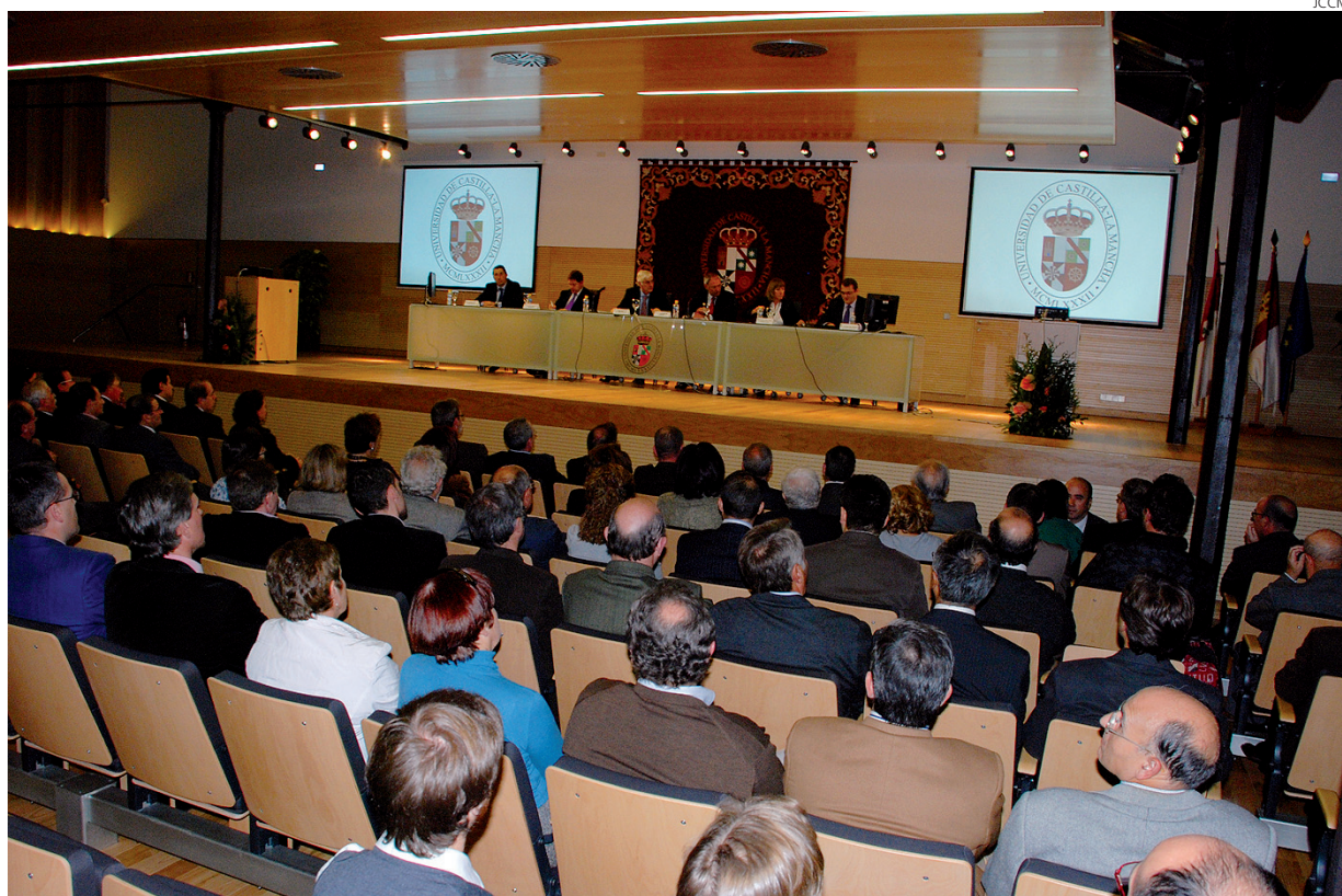
Momento de la presentación del estudio elaborado por el IVIE.

La UCLM lidera las actividades de I+D en Castilla-La Mancha