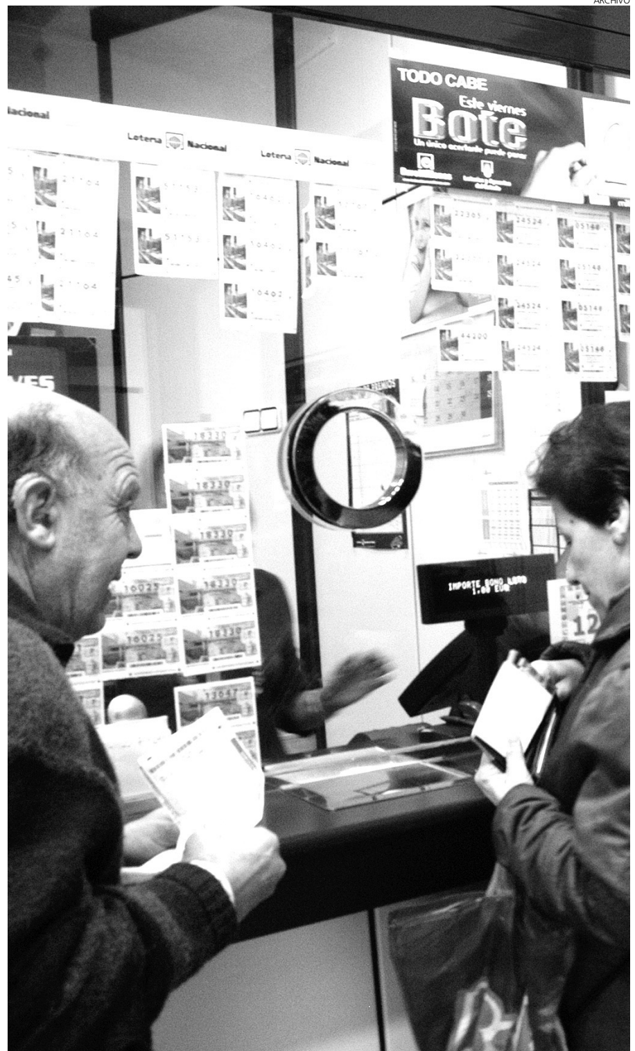
Baja la venta de lotería del Estado en Castilla-La Mancha.

Pero desde la Onlae aseguran que la prueba definitiva de esta nueva tendencia a la recuperación llegará el 21 de diciembre, cuando se conozcan los datos de venta de la lotería nacional de Navidad, que es un verdadero barómetro.