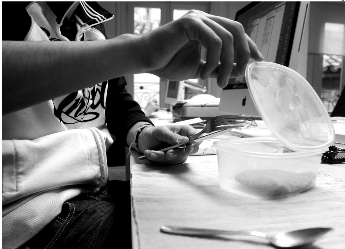
La crisis está llevando a que los trabajadores opten por llevarse la comida de casa.

El coste medio por persona en España es de 275 euros al mes, siendo Madrid la más cara, con 330 euros de media, seguida de Bar-