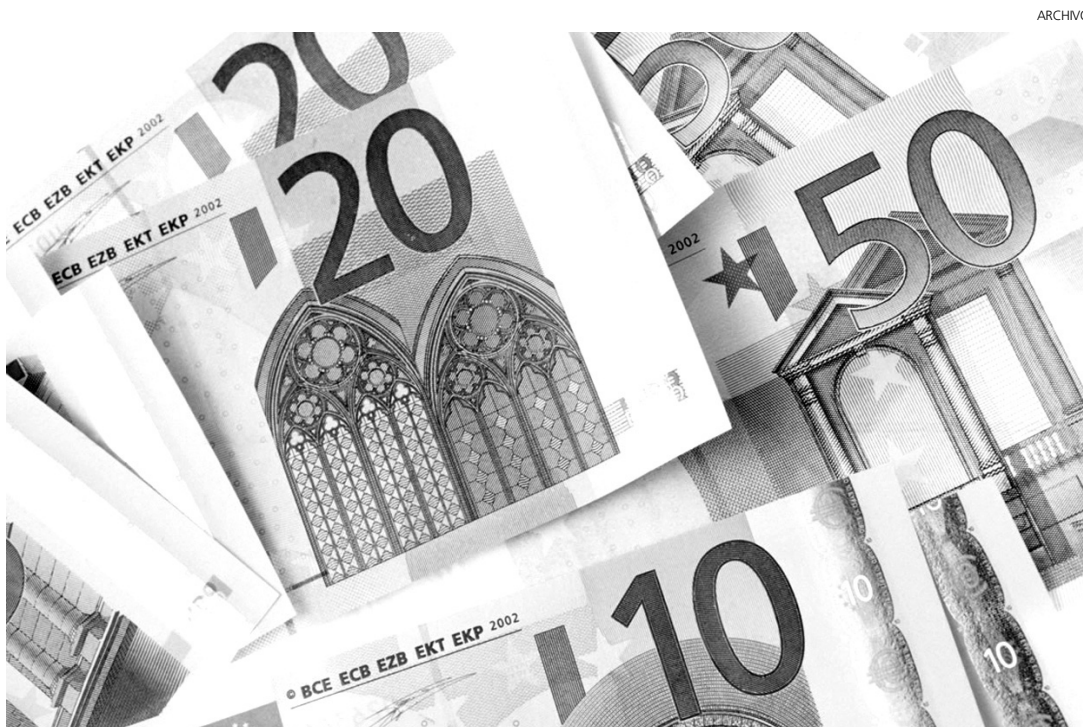
Las políticas de las autoridades monetarias serán fundamentales a partir de ahora.

Los mecanismos de coordinación y de coacción mutuos dentro de la eurozona han tenido que reconsiderarse