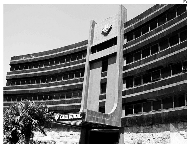
Edificio central de Caja Rural de Toledo.

corporando un amplio catálogo de regalos que supera la veintena, entre los que se encuentran algunos tan demandados como el "IPad de 16 Gb" o la "PlayStation 3 de 120Gb". Igualmente, incorpora cinco combinaciones diferentes de bonificaciones en dinero, dependiendo de la fidelidad del cliente.