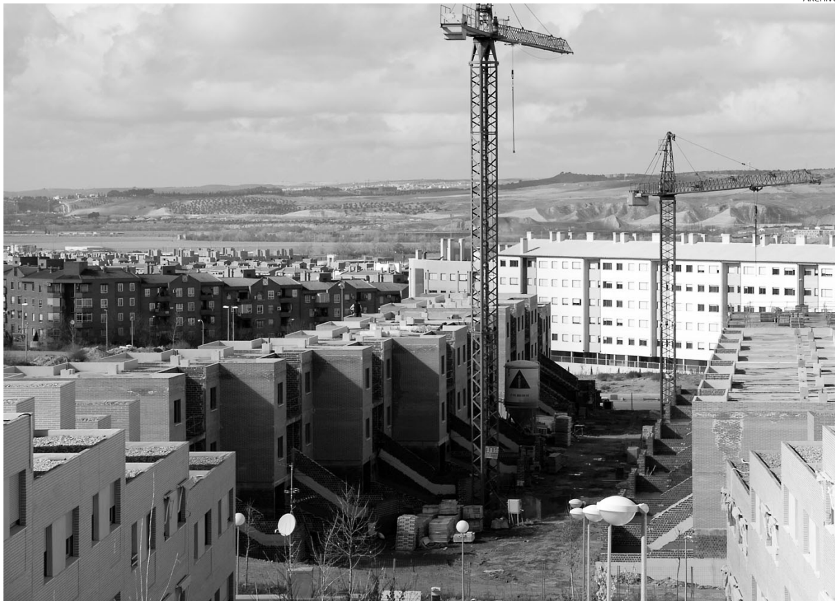
La economía regional tiene una gran dependencia de la construcción.

El Consejo Económico y Social (CES) de Castilla-La Mancha insistía recientemente en la necesidad de apostar por los sectores que aporten mayor valor añadido desde el punto de vista tecnológico y de cambiar el modelo productivo regional, caracterizado por la excesiva dependencia de la construcción. Una tarea complicada, esta última, si se tiene en cuenta que el peso del Valor Añadido Bruto (VAB) de este sector en el Producto Interior Bruto (PIB) regional se sitúa en el 12,4%, el se-