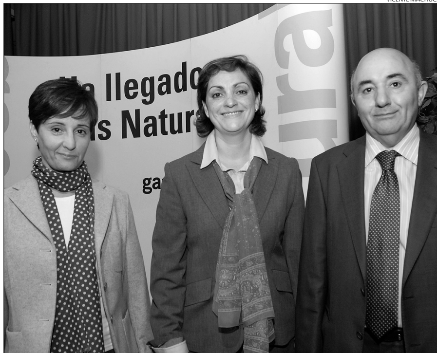
El delegado de Gas Natural C-LM Norte, junto a la jefe de Ventas y la alcaldesa de Pantoja.

Asimismo se dio a conocer a los vecinos presentes todo lo relacionado con esta energía, su uso, su distribución y comercialización, así como las diferentes aplicaciones de esta energía tanto a nivel de los hogares, como en industrias de la localidad.