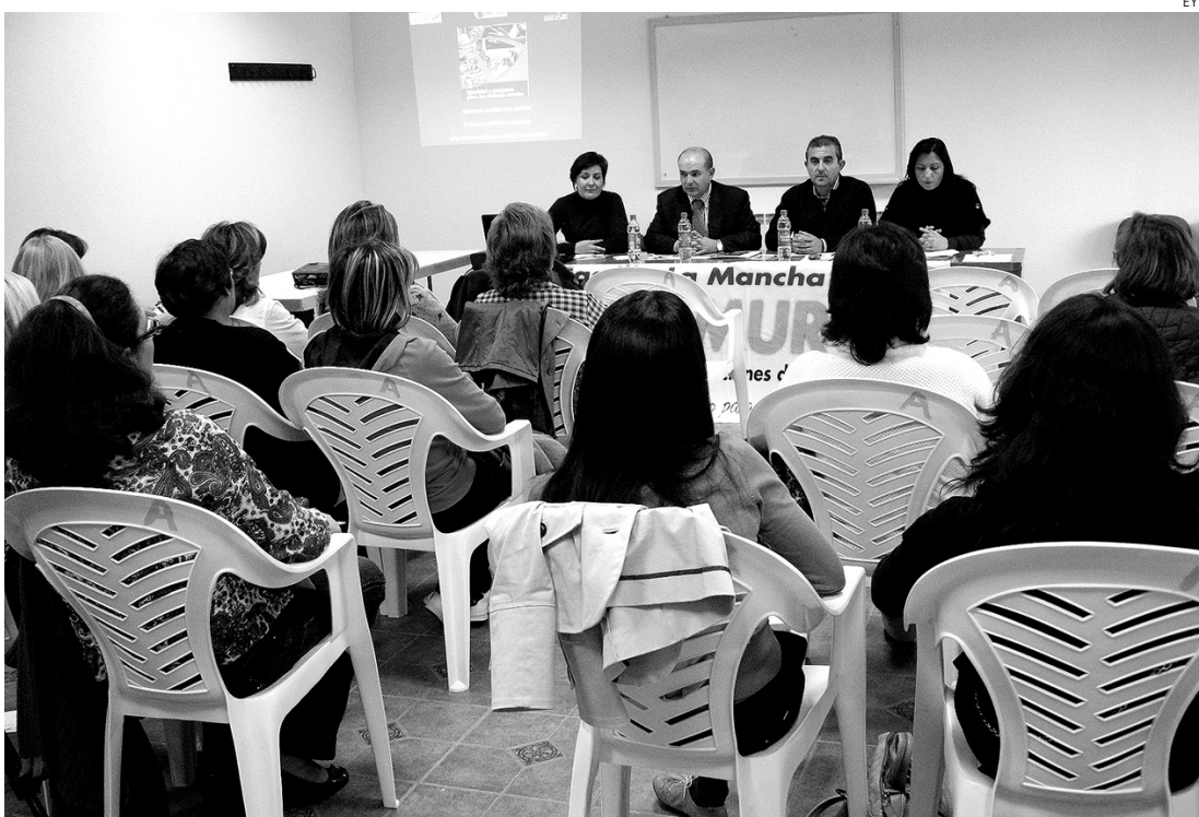
Fademur organizó unas jornadas en La Puebla de Almoradiel.

Rurales de Castilla-La Mancha (Fademur) en colaboración con el Instituto de la Mujer para fomentar la igualdad de oportunidades en el medio rural teniendo como protagonistas a las mujeres del ámbito rural (foto inferior izquierda). En la foto inferior derecha, Caja Rural de Ciudad Real recibió a una expedición de San Martín de Mendoza, hermanada con Socuéllamos.