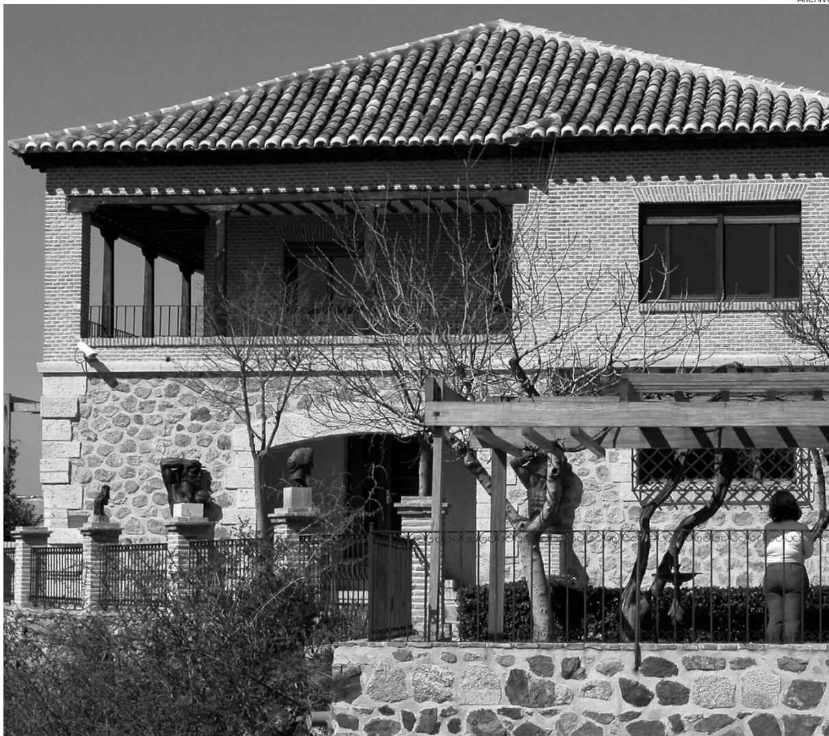
Real Patronato de la Fundación de Toledo.

Una dispersión que también ha sido criticada desde