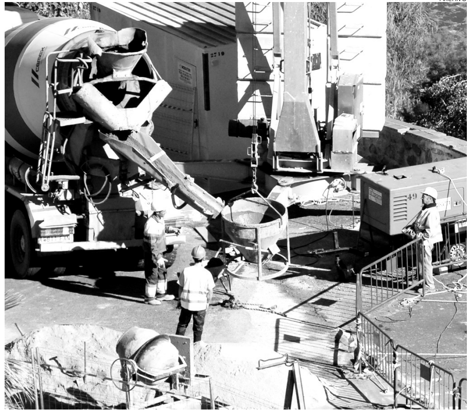
Los obreros tendrán que tener la TPC para trabajar a partir de enero de 2011.

manario que incluso se está barajando la posibilidad de pedir una moratoria con el fin de que todos los trabajadores que quieran seguir en el sector puedan trabajar a partir del 1 de enero de 2011.