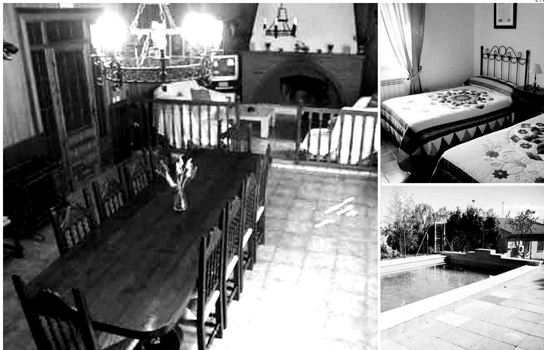
Los apartamentos están situados en el Pantano La Torre de Abraham.