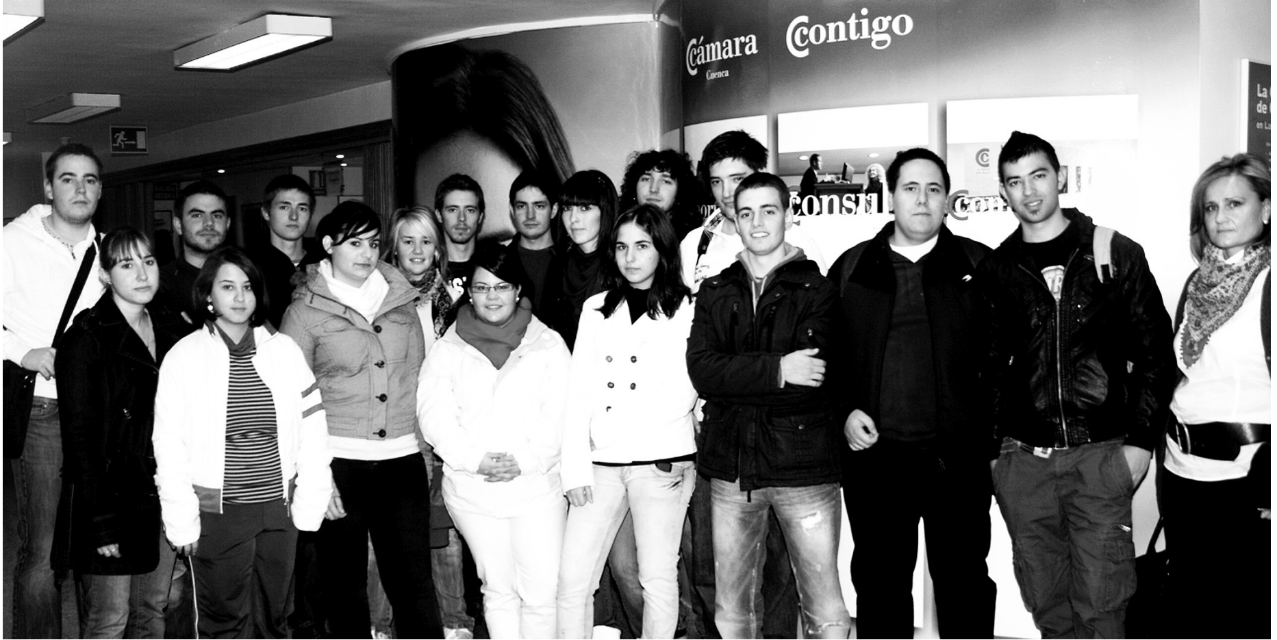
Estudiantes del grado medio y superior que cursan la asignatura de "creación de empresas" visitaron la Ventanilla Única Empresarial de la Cámara de Comercio de Cuenca.