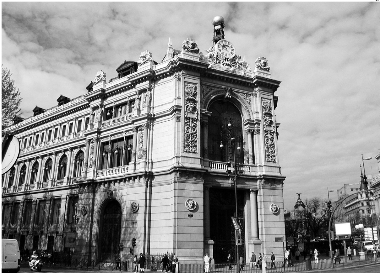
El Servicio de Reclamaciones del Banco de España no cumple con las expectativas de los consumidores.

En este sentido, las reclamaciones desde la región