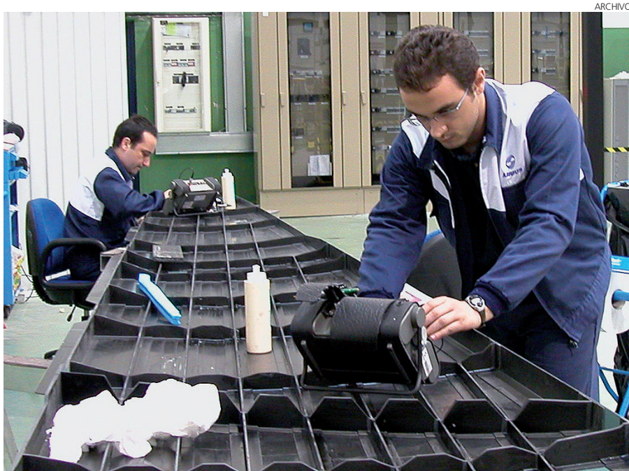
Cecam está informando a las empresas.

Para cumplir con el deber de registrar estas sustancias, las empresas deben presentar un expediente de registro a la Agencia Europea de