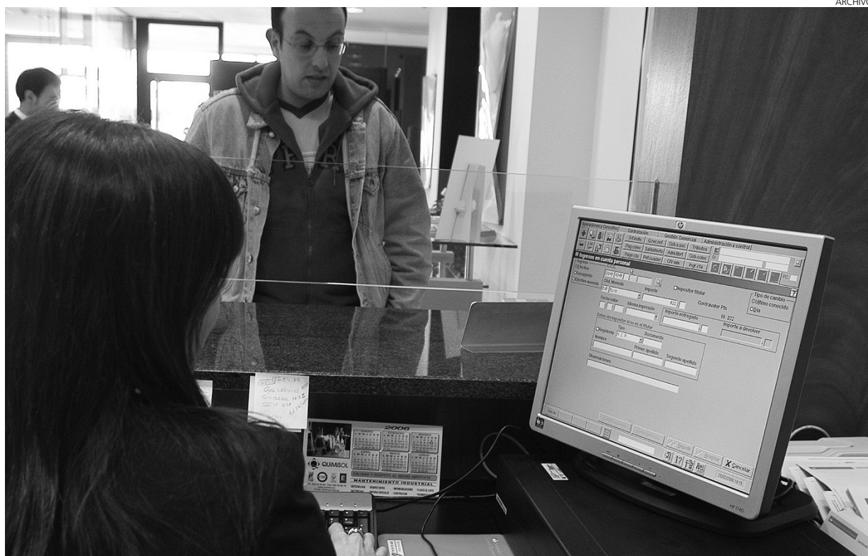
Las ejecuciones hipotecarias han crecido un 59% a lo largo del año 2009.