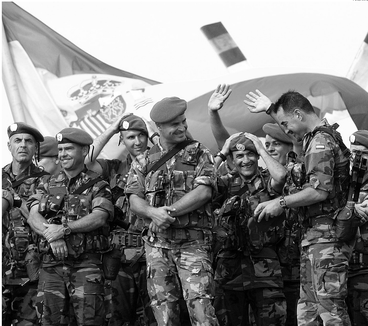
Ser soldado profesional se ha convertido en una entrada al mercado laboral para muchos jóvenes.

En el último año por cada plaza de soldado hubo cinco candidatos, a los que hay que unir la convocatoria para policías y guardia civiles