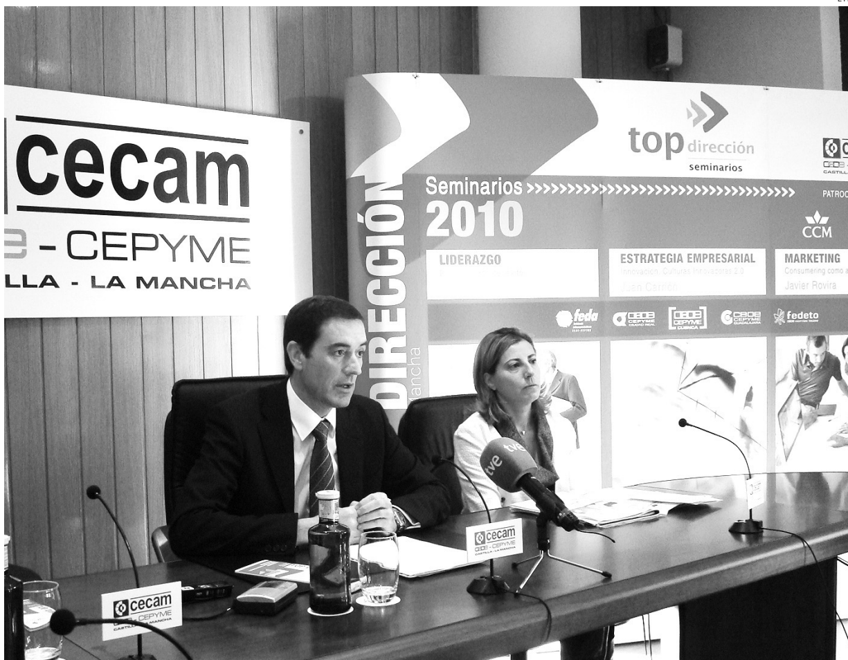
El secretario general de Cecam hizo balance de los quince Seminarios TOP Dirección organizados en 2010.