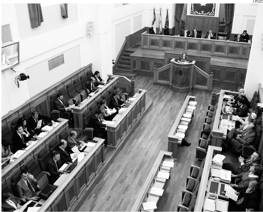
El Pleno de las Cortes Regionales aprobó la Ley de Cooperativas.

La norma nace con la vocación de seguir creando empleo en las zonas rurales