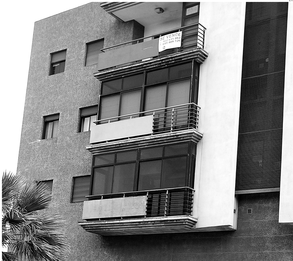
La banca está financiando sólo el 62% del valor de tasación de los pisos.

Las inmobiliarias critican la competencia que tienen por parte de los bancos a la hora de vender viviendas