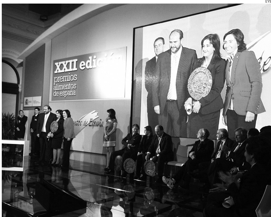
Momento de la entrega de premios celebrada en el Ministerio de Medio Ambiente.

Dos empresas castellano-manchegas fueron premiadas en esta edición