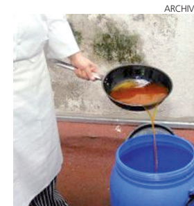
Recogida de aceite usado en la provincia.

de Cuenca gestiona en El Terminillo. El contrato contempla la aplicación del servicio en todos los municipios de la provincia de Cuenca de forma gratuita, así como la adquisición de los contenedores y la gestión integral del servicio de recogida, asumiendo en esta gestión todos los costes derivados de la misma.