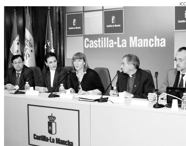
Momento de la presentación del Plan del Románico.

"Este ambicioso Plan es un compromiso del Presi-