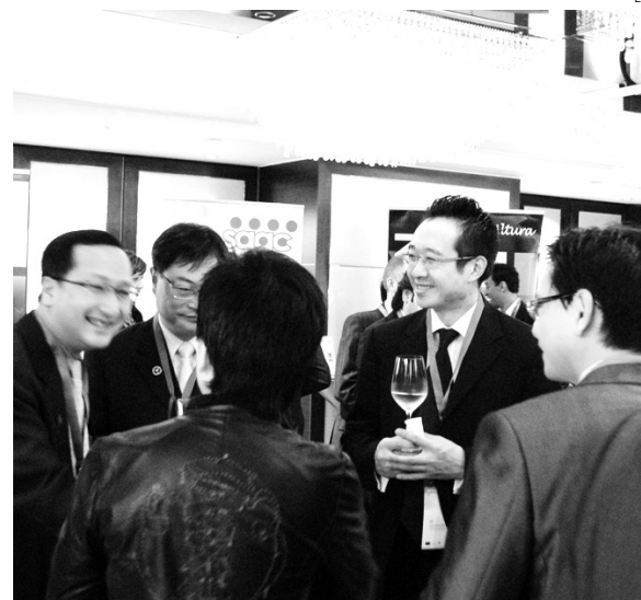
La D.O. Manchuela defendió sus vinos en Hong Kong.