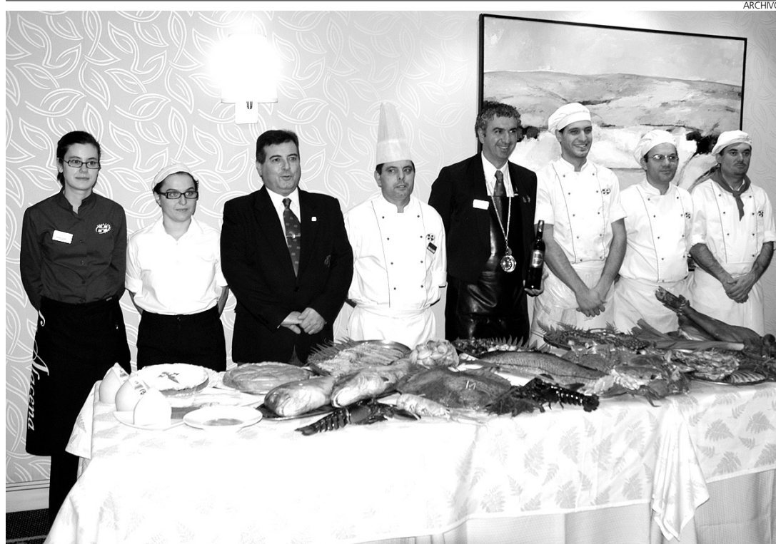
La hostelería va recuperando terreno.