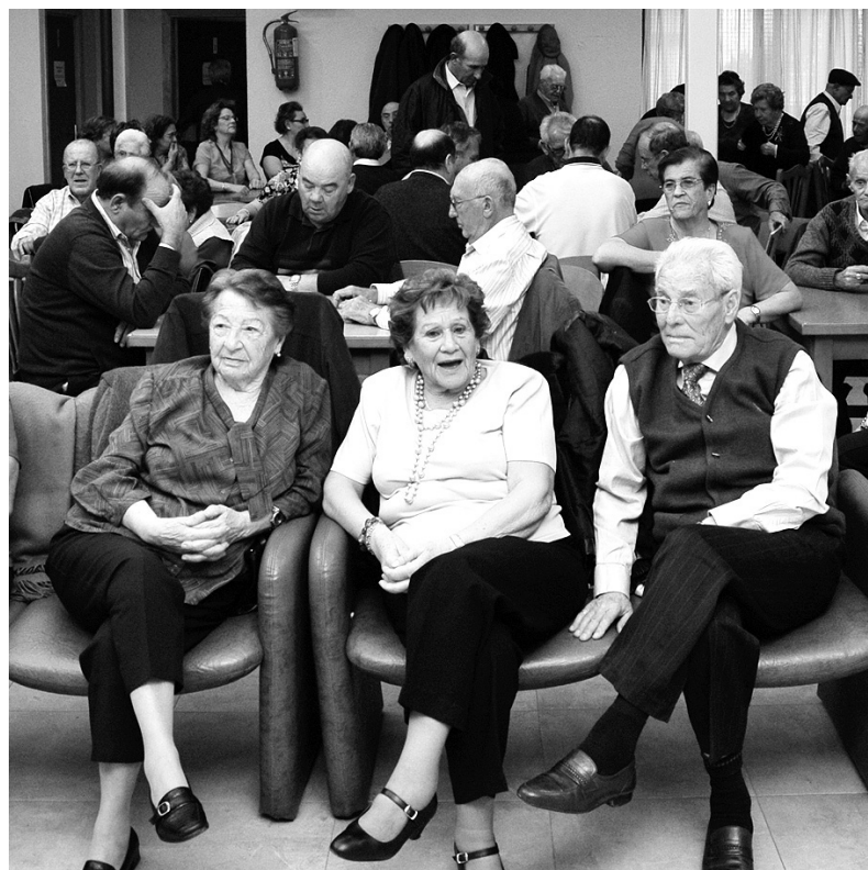
El debate sobre el futuro de las pensiones está abierto.

La tendencia a un menor número de personas que cotizan por jubilado