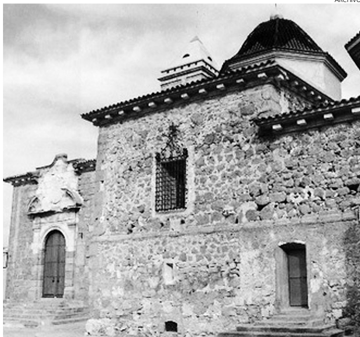
Alborea es una localidad de Albacete.

En sus inmediaciones se encuentra un testimonio tangible de su historia