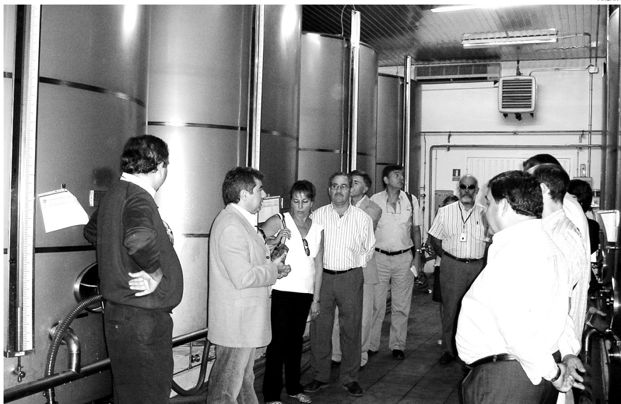
Las visitas a empresas se están consolidando como alternativa al turismo tradicional.

Como estrategia de comunicación empresarial, las visitas contribuyen además a la promoción del espíritu de empresa entre los jóvenes y la sociedad en su conjunto y resulta, en consecuencia, de interés para todo tipo de firmas, más allá de las que tengan un atractivo turístico implícito (agroalimentarias o arte-