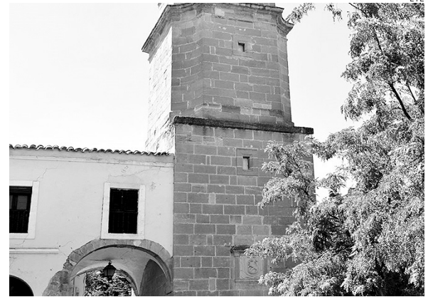
El Ayuntamiento ha programado un presupuesto austero.