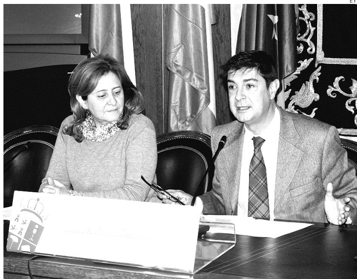
Presentación del Plan en la sede de la Diputación de Cuenca.

Con esta nueva modalidad, los Planes Provinciales para el año 2011 supondrán una inversión de 9,3 millones de euros, cifra que supone un incremento de 765.000 euros respecto al año anterior y que será asumido por fondos propios sin recurrir a ninguna operación de préstamo.