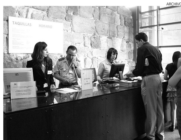
La entrada a los museos, gratis esos días.

El Ayuntamiento se compromete igualmente a adecuar y facilitar la disponibilidad de lugares públicos para la celebración de los actos durante esos días así como a realizar una campaña de limpieza previa en los