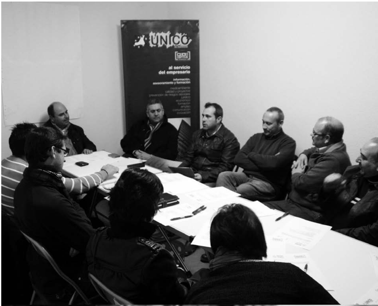
La Asociación Comarcal de Empresarios y Comerciantes de El Provencio celebró junta directiva.