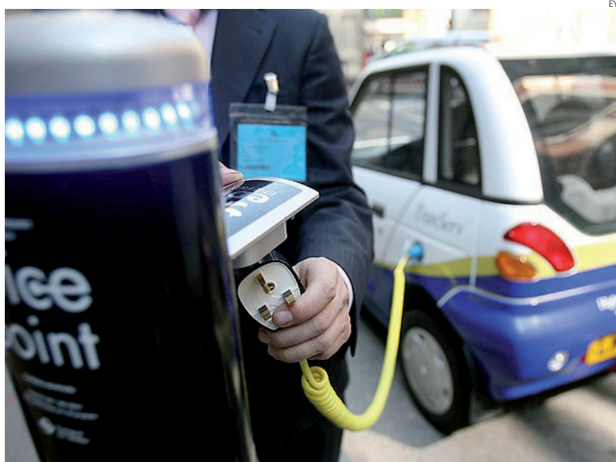
El coche eléctrico tiene todavía mucho camino por recorrer.

Una cantidad que, aunque pequeña, para sí quisiera el resto del sector del automoción, inmerso en una