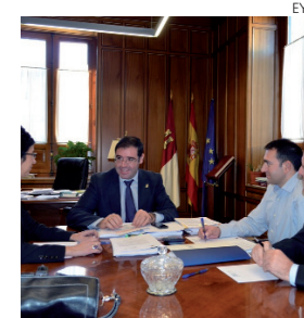
Reunión mantenida en Cuenca.

Este Centro Tecnológico para la Investigación, Desarrollo e Innovación en Biocombustibles en Cuenca tiene como objetivo el desarrollo económico del sector de los biocombustibles mediante la prestación de servicios que respondan a las necesidades técnicas y de investigación en esta materia.