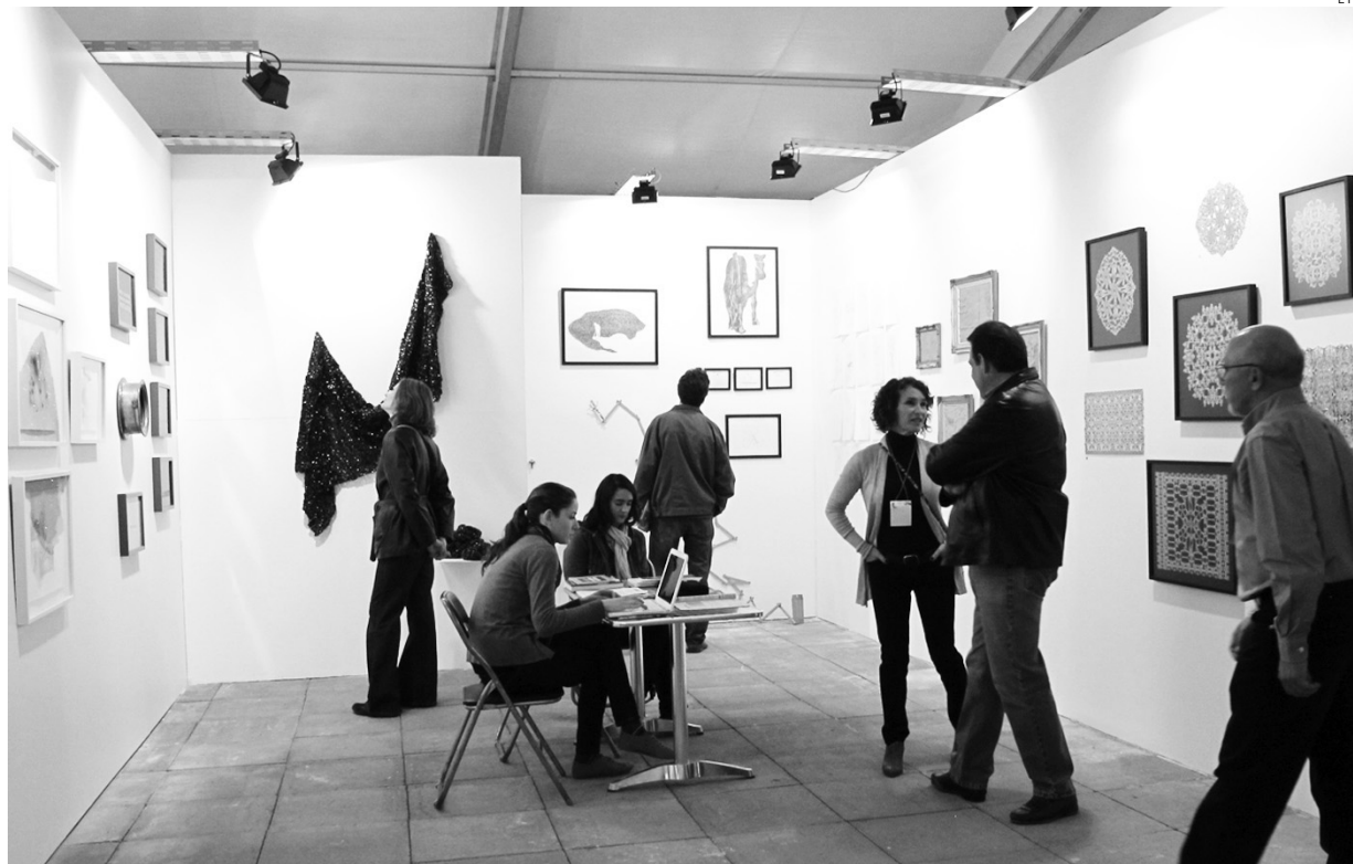
Las galerías de arte están pasando un mal momento.

“No hablamos ya de la adquisición o coleccionismo, sino de que no hay interés para visitar las exposiciones y el trabajo que se realiza, que son gratuitas, y esto desmotiva el trabajo de los galeristas y de los artistas dado que hay escas interés en visitar