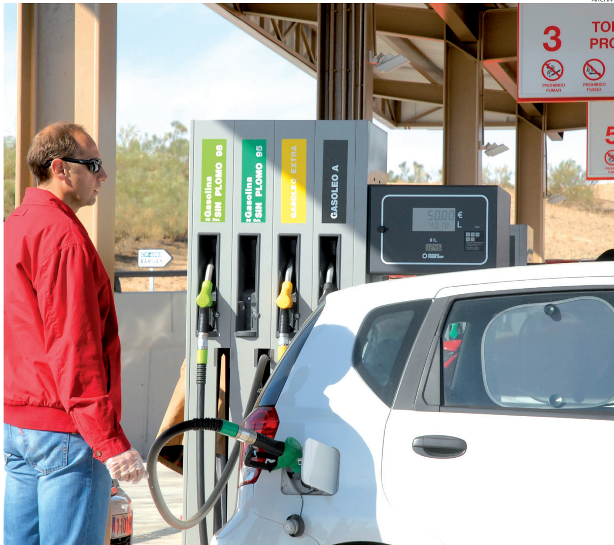
Las gasolineras se han visto obligadas a diversificar sus negocios para subsistir.

En términos absolutos dejaron de ingresar 4,5 millones de euros