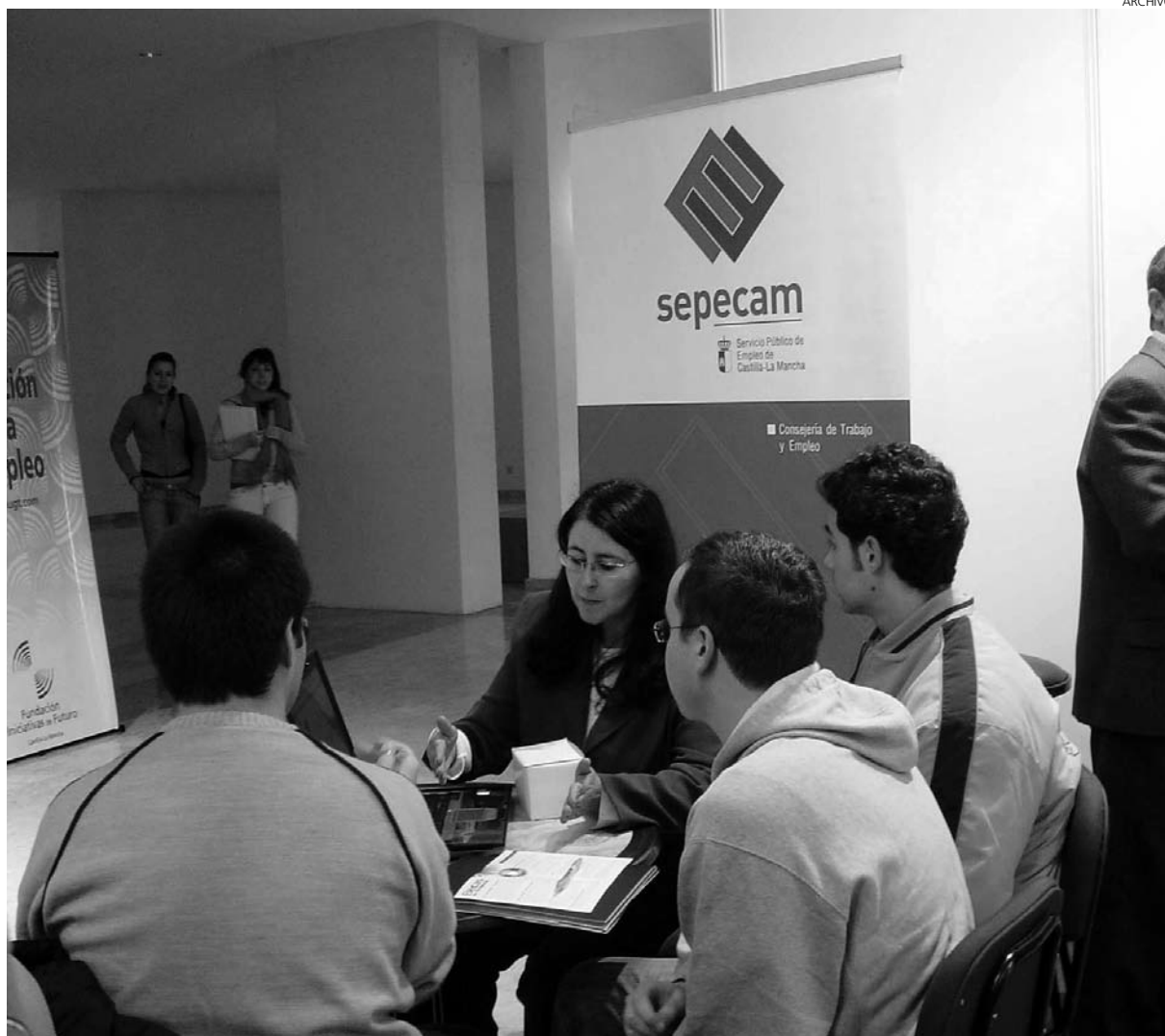
La tasa de paro juvenil en la región es una de las más altas en Europa.

Con estos parámetros, no es de extrañar que sean muchos los que se muestren escépticos ante los nuevos objetivos fijados por la Comisión Europea de cara al 2020, de