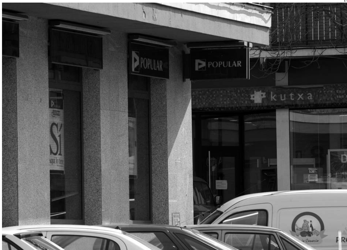
El nuevo proceso de reestructuración del sistema financiero está a la vuelta de la esquina.

Cerca de 2.167 trabajadores del sector en Castilla-La Mancha