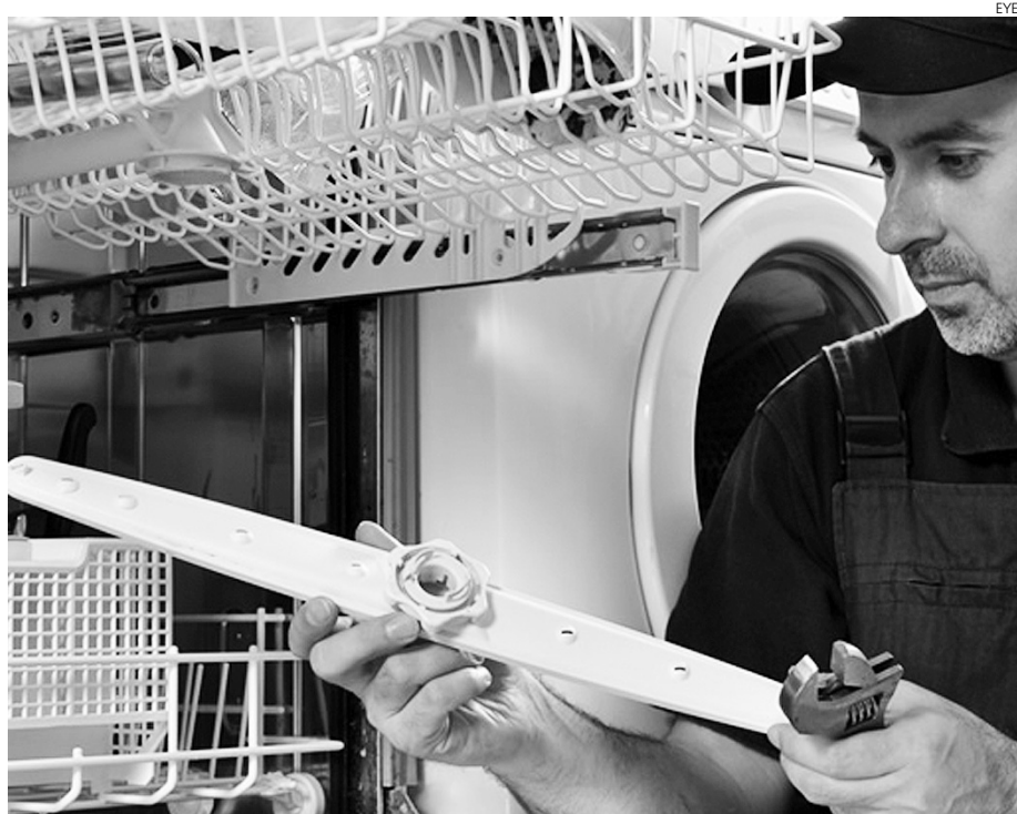
Crecen ligeramente las reparaciones de electrodomésticos.

Las ventas por el contrario siguen cayendo, sobre todo en aparatos de gran tamaño