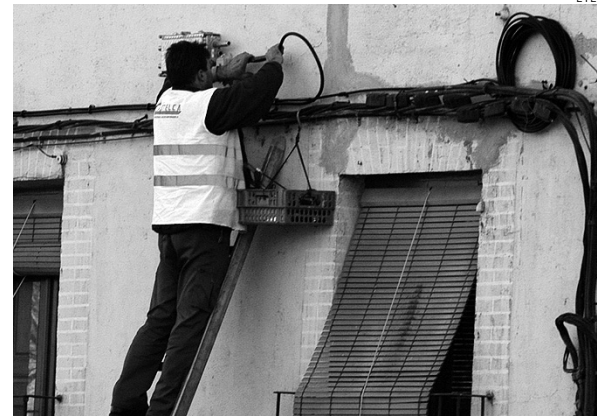
Las empresas lo siguen pasando mal.