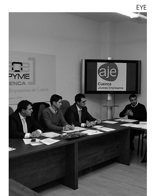
Momento de la reunión de AJE.

De este modo, además de facilitar la labor diaria del joven empresario, quieren tener una presencia más activa dentro de la sociedad cuenseña, realizando una serie de actuaciones que pongan en valor y premien la actividad de los emprendedores.