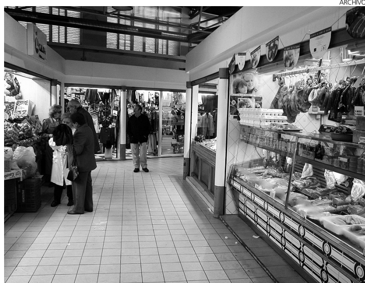
El sector de la alimentación no es de los que peor están.

SERVICIOS DE INSTALACIÓN Y REPARACIÓN MULTIOFICIOS S.L. Cmno. Los Yeseros, 1 Carranque Toledo Capital social: 20.300,00 euros Objeto social: Servicios de gestión, educativos, ocio, administración.