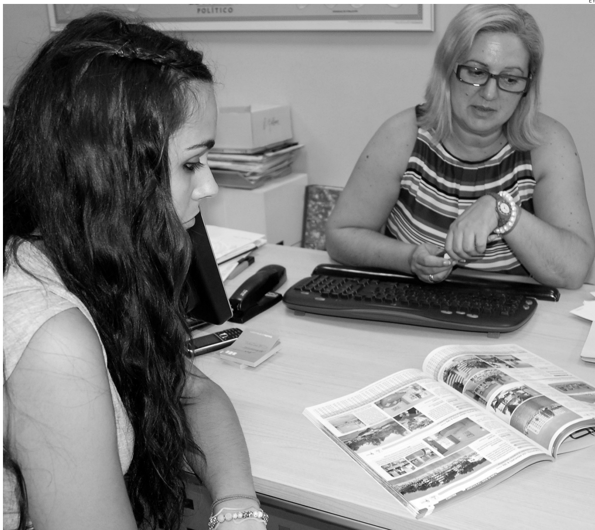
Los cruceros siguen siendo una clara apuesta del sector turístico.

El sector no cree que el accidente sufrido hace unos días por el Costa Concordia en tierras italianas vaya a perjudicar