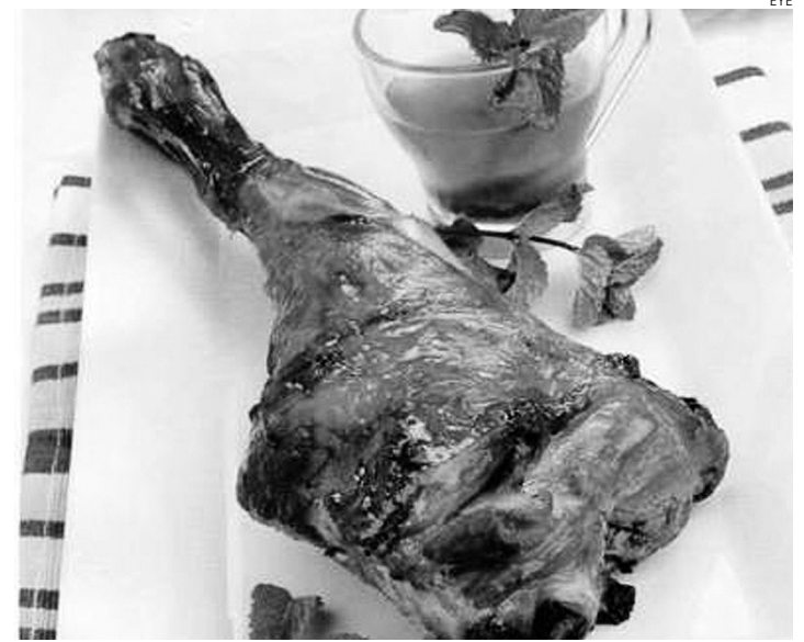
La pierna de lechal es uno de los platos típicos.