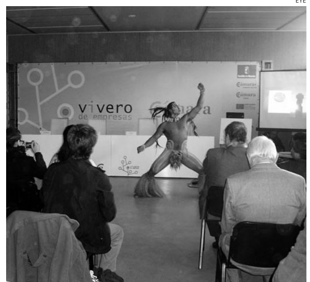
Convenio entre las Cámaras de Toledo y la de la Isla de Pascua.