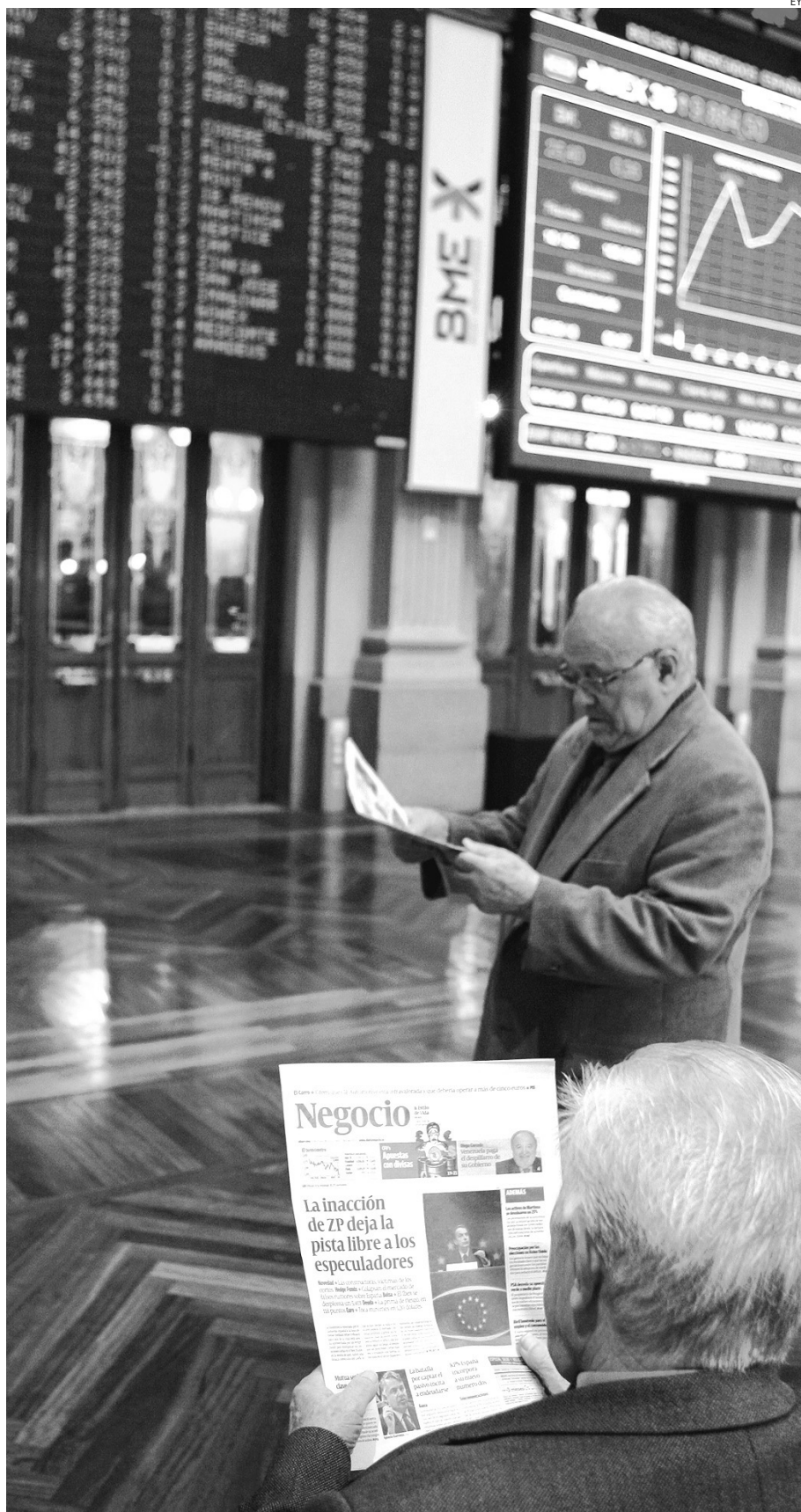
Las calificaciones de las agencias de rating inciden en las decisiones de los mercados.

Una circunstancia que no hace sino sembrar un poco más de incertidumbre a unos mercados que no dan para sorpresas negativas en los últimos tiempos. "Nosotros pensamos que efectivamente debe de haber algún tipo de regulación a efectos de un calendario unificado, como por ejemplo las empresas a la hora de publicar sus resultados, fechas de dividendos, etc con el fin de no publicar sus