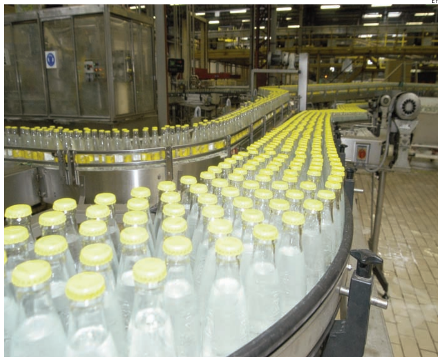
Las bebidas se encuentran entre los productos que más se exportan.

Pero en medio de este aluvión de datos positivos, también hay lugar para una cierta preocupación, ya que la excesiva dependencia hacia los países de la zona euro puede traer consigo efectos negativos si los problemas