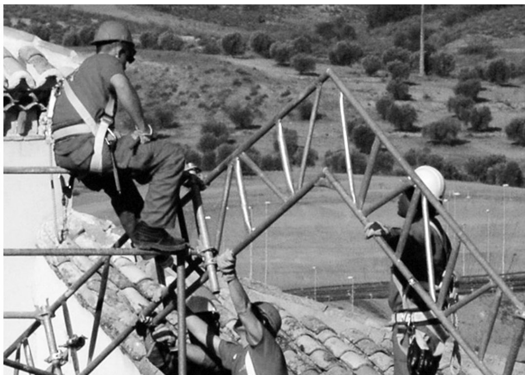
Construcción es uno de los sectores que concentra la mayor siniestralidad laboral.

• Referida a prevención de riesgos laborales y teórica y práctica. La mera formación en contenidos teóricos no supone un cumplimiento de la obligación empresarial, debiendo necesariamente acompañarse de una formación que implique la puesta en práctica de los conocimientos