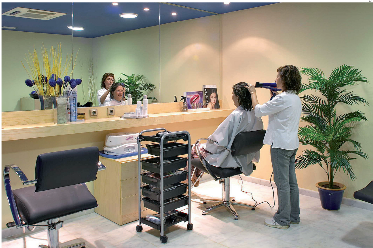
El sector de las peluquerías es uno de los más afectados por el intrusismo profesional.

La crisis está provocando que haya más economía sumergida