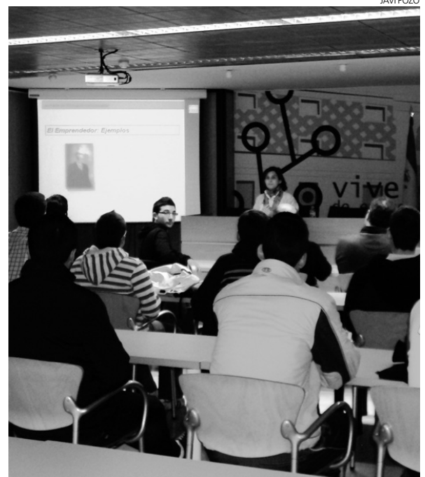
Jornada de Motivación de Fundación CEEI-Talavera.