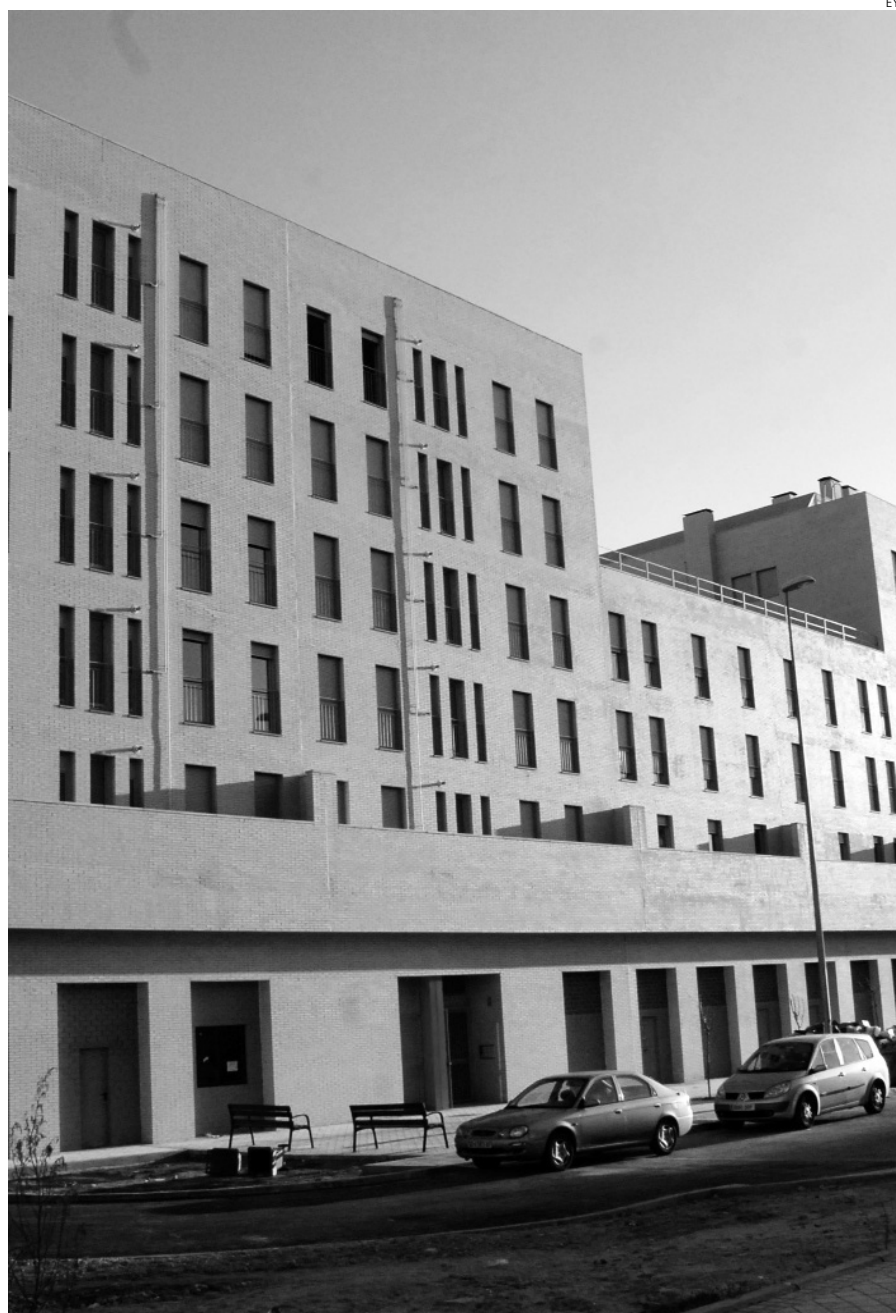
Los expertos no se ponen de acuerdo sobre si la vivienda seguirá bajando o no.

En el lado opuesto se sitúa la provincia de Ciudad Real, con una caída en el precio durante los últimos cuatro años del 4,4%, hasta los 1.020,1 euros de media por metro cuadrado. En Cuenca, el descenso en el valor de los inmuebles a lo largo de este período ha sido del 4,6%, hasta los 1.037 euros, mientras que en Albacete se situó en el 12,8%, colocando el precio medio de los mismos al finalizar 2011 en 1.159 euros.