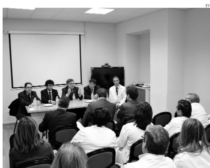
Reunión de la Comisión de Seguimiento para el futuro Hospital.