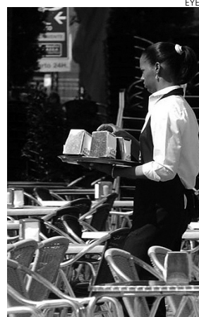
Castilla-La Mancha ha perdido cotizantes de fuera.

En Castilla-La Mancha hay 69.493 afiliados de fuera, la mayoría de ellos en el régimen general. La tasa interanual es negativa, situándose en un 1,30% menos de cotizantes.