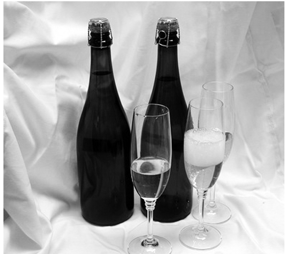
El mosto de la región podría salir beneficiado si se logra que el vino sólo se enriquezca con él.

como se debe hacer. "Sabemos que es legal, pero lo suyo es enriquecer de esta manera y no de la otra, así es que confiamos en lograrlo", acabó diciendo.