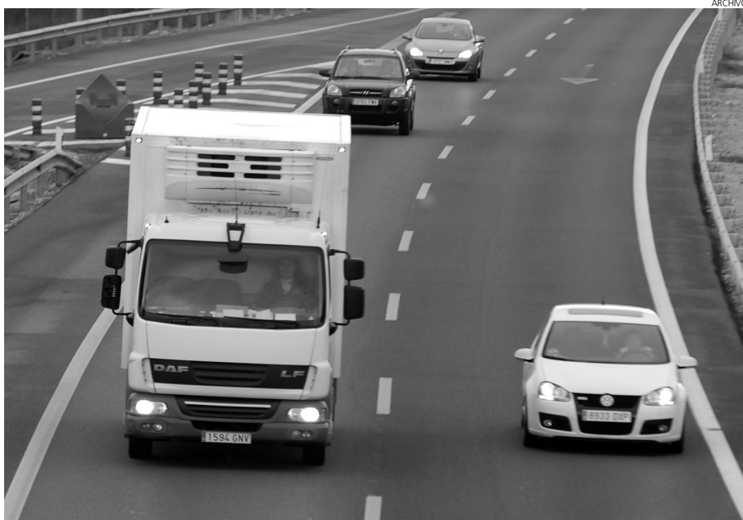
El transporte de mercancías ha comenzado el año con problemas.