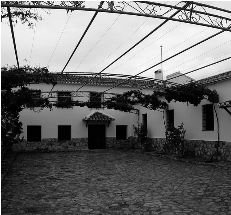
La casa rural está situada en la localidad de Villanueva de la Fuente.