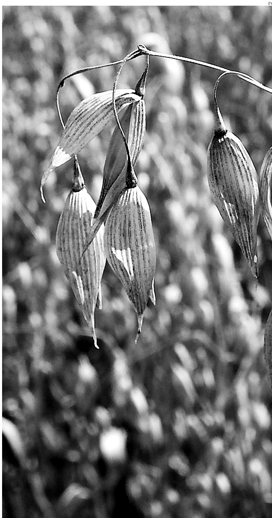
La avena es uno de los cereales que tiene más tirón en Castilla-La Mancha.

“Los precios del gasóleo, fitosanitarios, etc...nos están haciendo polvo y cada vez nos hundimos un poco más”, lamentaba.