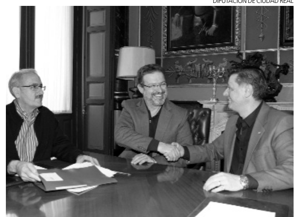
Momento de la firma del convenio de financiación.