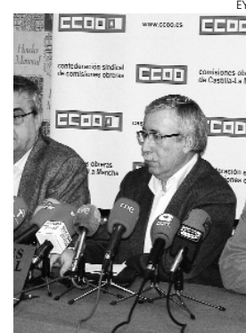
Rueda de prensa de CCOO en Toledo.

El secretario regional de FITEQA ha indicado que la pérdida de empleo de este