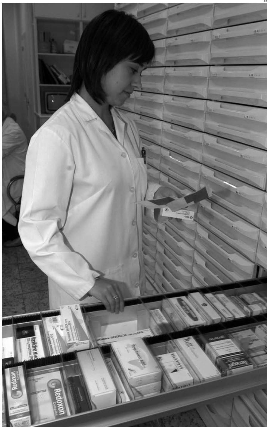
Las farmacias atraviesan una situación económica muy delicada.

Que no es poca, ya que al cierre del ejercicio de 2011 ascendió a 5.230 millones de euros, lo que supone un 26% más que la registrada el año anterior. De este importe, 406 millones corresponden a la Junta de Castilla-La Mancha.