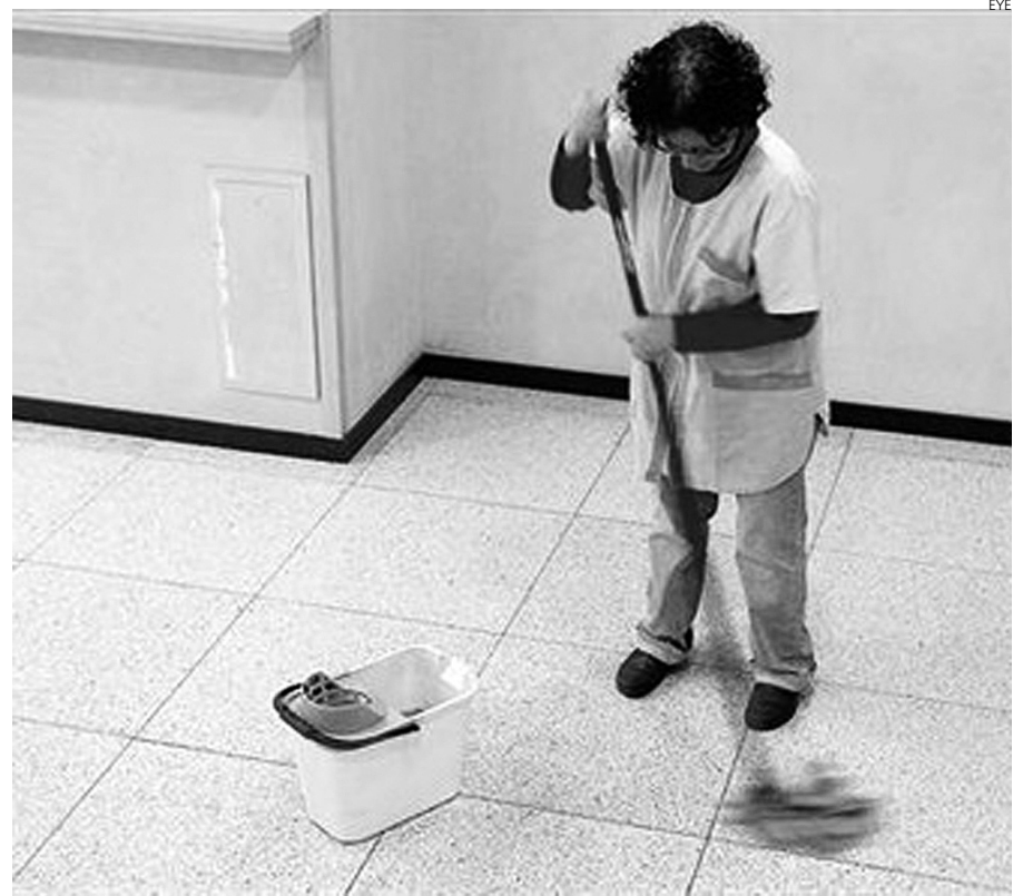
El empleo doméstico está preocupado por su nueva situación.

De cualquier forma, los empleadores tienen hasta julio para solucionar este tema.