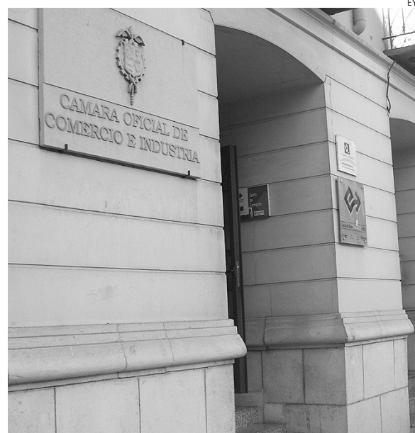
Fachada de la Cámara de Comercio de Cuenca.