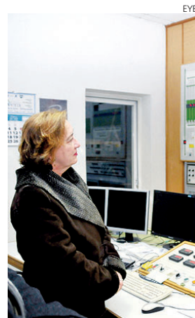
En la imagen, María Luisa Soriano durante su visita.

En el transcurso de su visita a la cooperativa ganadera Avicon en el municipio toledano de Consuegra, Soriano resaltó el esfuerzo que está realizando el Gobierno regional para impulsar el sector de la agricultura y la ganadería, "porque somos un gobierno que cree en la agricultura, un sector que genera riqueza y empleo y que estamos convenidos de que puede contribuir a paliar la crisis económica en Castilla-La Mancha".