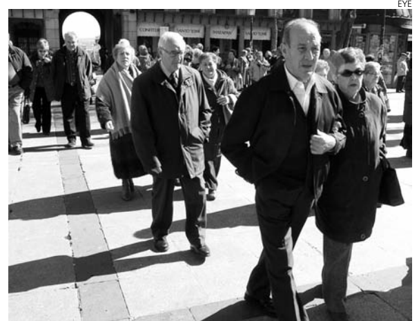
El número de pensionistas ha subido un 1,2%.

En cuanto a la pensión media del Sistema, se situó en 806,77 euros al mes.