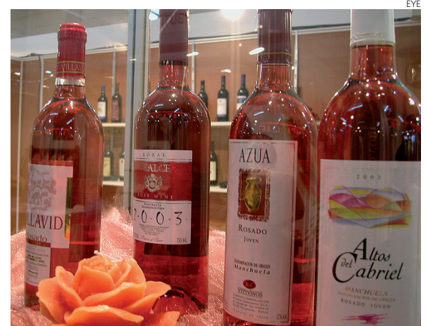
Las bebidas encabezan el ranking de las exportaciones.

Por países, dentro de nuestros principales clientes, Portugal sigue en la primera posición, con un ligero ascenso del 4,5%.