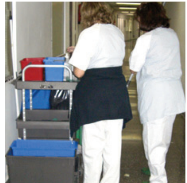
El CES ha realizado un informe sobre los contratos iniciales.