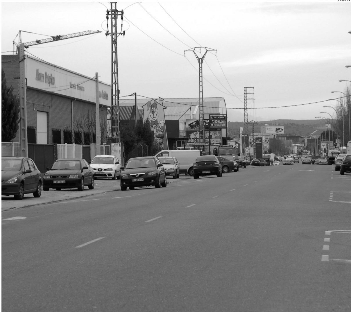
El problema de la falta de financiación se acrecienta día a día en las empresas.

La medida llega en un momento difícil para todas las compañías