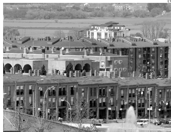
Se espera que esta medida reactive al sector.

Pero todo ello no puede obviar el principal problema a la hora de comprar vivienda, que es la falta de financiación y las restricciones al crédito. Por ello, se echa de menos que se hubiesen puesto en marcha