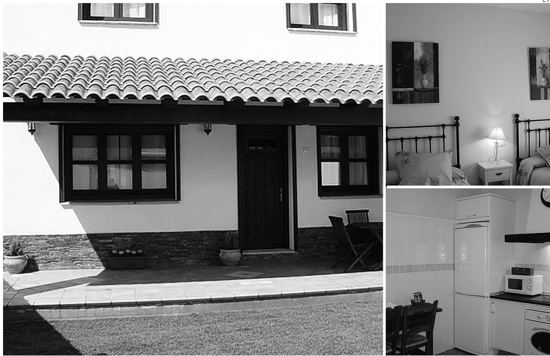
La casa rural está situada en la localidad de El Robledo.