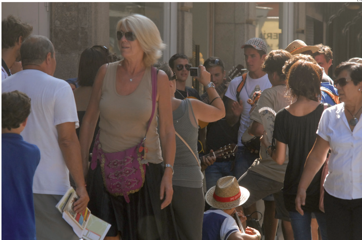
Castilla-La Mancha es una comunidad atractiva para los turistas.

El número de establecimientos hosteleros se mantiene