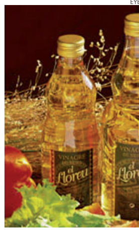
El vinagre español goza de buena calidad.

ción de "Especialidad Tradicional Garantizada" respecto de los nuevos y españoles vinagres balsámicos, aterciopelados con los mostos de uva concentrados/rectificados de Castilla-La Mancha, Valencia y Extremadura, y que el consumidor los prefiera "pues el vinagre balsámico es una metodología de elaboración simple y pura". La Asociación espera que se comience a buscar en las etiquetas de los lineales el término 'vinagre balsámico de España'.