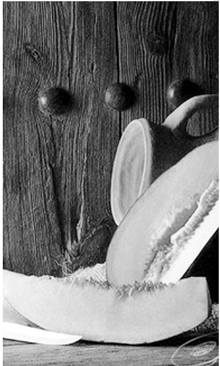
El precio del melón está por los suelos ahora mismo.

Casero confía que los precios comiencen a comportarse mejor ahora que Murcia ha dejado de recoger para que los agricultores no pierdan tanto dinero. Unos agricultores cuyos ánimos están muy bajos. “Cuesta mucho producir este tipo de cultivo y luego te encuentras con estos inconvenientes por lo que la gente está desanimada y es normal”.