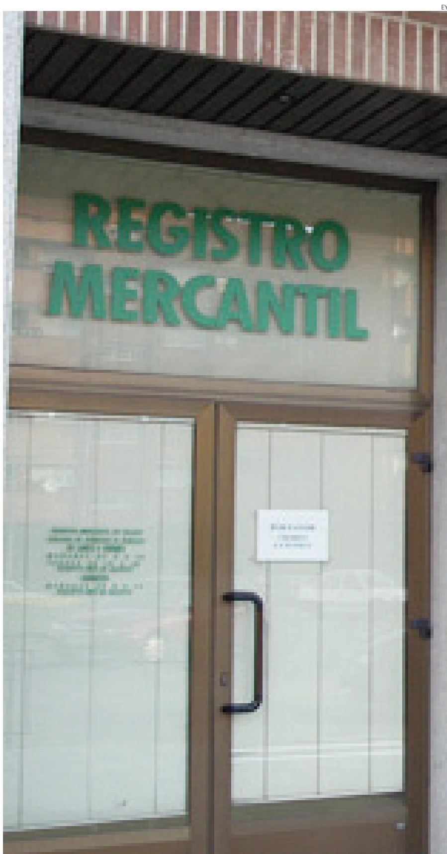
Aún no existe dinamismo en la creación de empresas en la Región.

Estos datos ponen de manifiesto el esfuerzo que los pequeños y medianos empresarios están realizando para contribuir a la recuperación económica y a la creación de empleo.