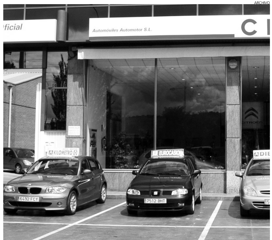
Agosto, según Ganvam, es un buen mes para renovar la flota de vehículos.

Ganvam reivindica a las Administraciones que establezca incentivos y mecanismos que no suponen coste alguno para la renovación del parque automovilístico.