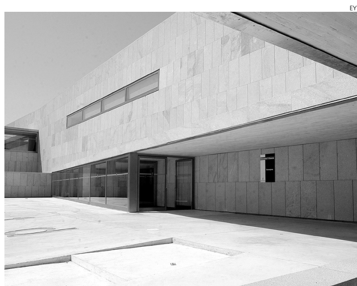
La Consejería de Educación contará con coordinadores provinciales.

Junto a los servicios centrales de la consejería de Educación, Cultura y Deportes, integrados por la viceconsejería de Educación y