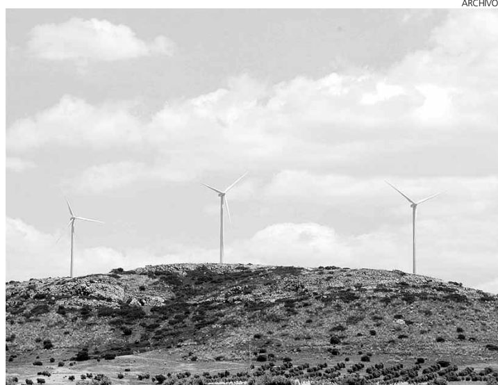
La energía eólica sigue subiendo enteros.

ABADA SERVICIOS DESARROLLO S.A. AMPLIACIÓN DE CAPITAL 1.000.000,25 euros RESULTANTE SUSCRITO 3.013.954,69 euros