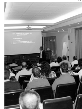
En la imagen, un momento de uno de los encuentros.

Otro de los aspectos más cuidados por la Cámara de Comercio de Cuenca duran-