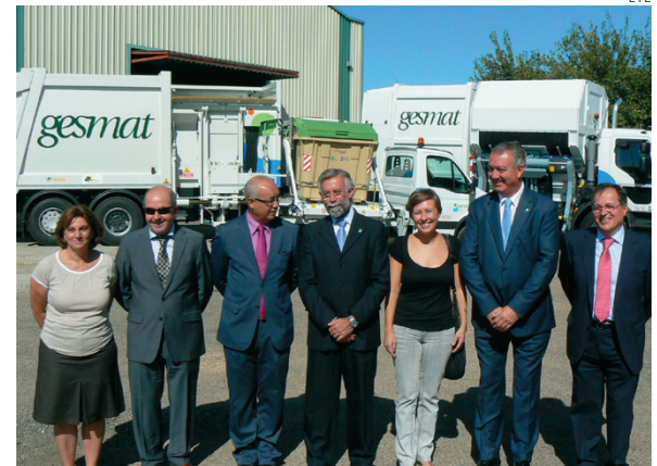
El presidente del Consorcio y algunos de los alcaldes.