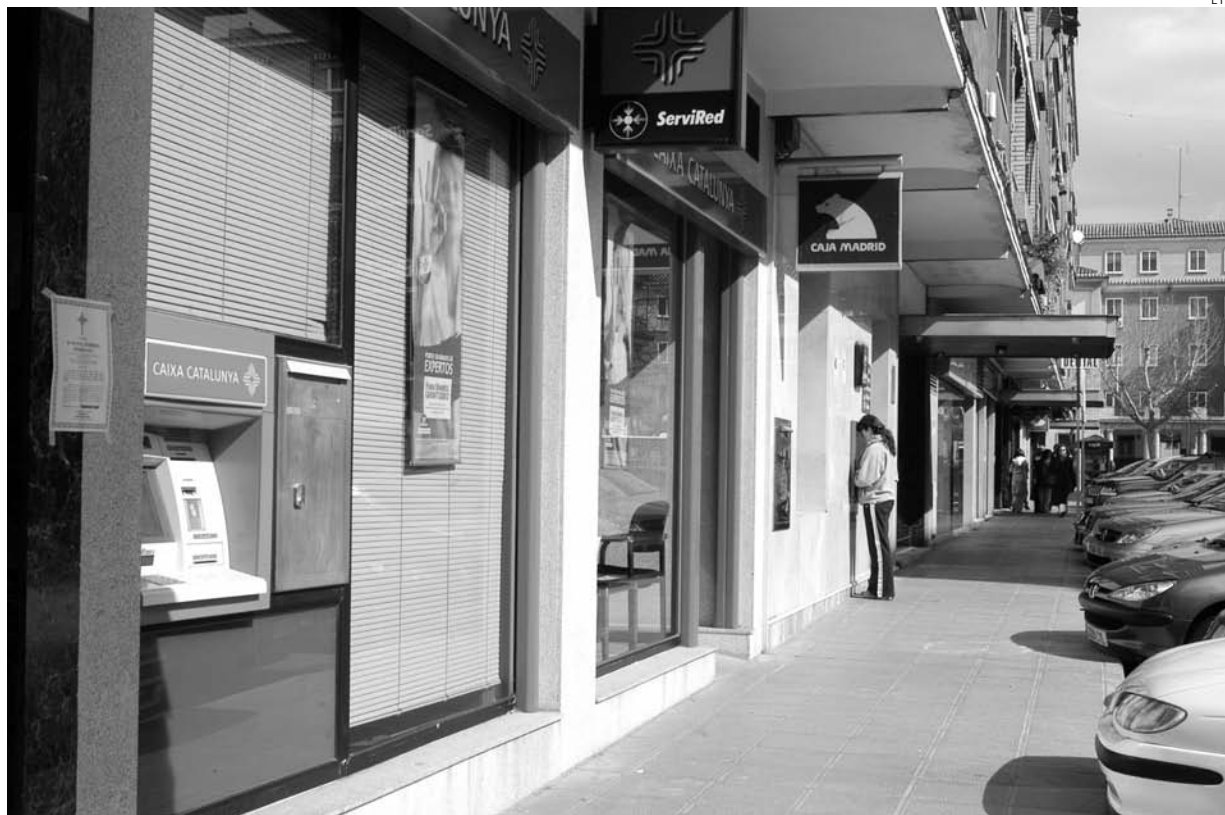
Las comisiones y los trámites burocráticos entorpecen la labor de todos los ciudadanos, hasta de la Administración.

A partir del 30 de junio Hacienda comenzará con la anulación