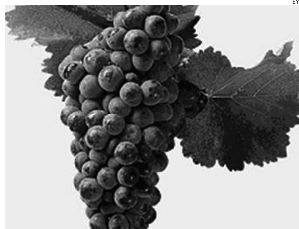
Los precios de la uva son insuficientes para Asaja.

Asaja C-LM denuncia, una vez más, la posición de dominio del sistema de formación de precios del sector industrial. La Asociación Agraria-Jóvenes Agricultores rechaza este sistema “impositivo y nada concertado”.