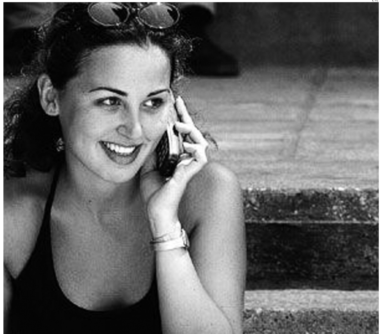
Los consumidores están aumentando las quejas relacionadas con los teléfonos móviles.

Todas las empresas de este sector económico tienen quejas pero es Vodafone la que registra mayor número