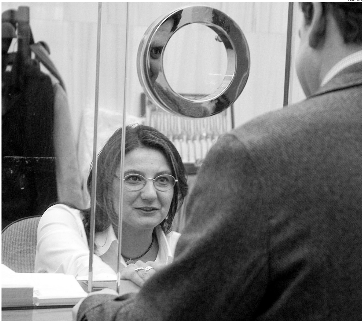
Los ciudadanos cada vez tienen que pagar más a los bancos y cajas por tener su dinero.

Las comisiones por mantenimiento de cuenta corriente, según se desprende de los datos del Banco de España, se han incrementado entre enero y julio de este año un 13,38% (en lo que al valor medio se refiere), y en relación a hace un año el crecimiento ha sido del 21,71%. Pero el incremento es aún mayor si se compara con ene-