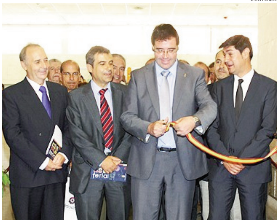
Momento de la inauguración de la Feria de Artesanía se Cuenca.

Se ha celebrado hasta este domingo y ha sido un éxito de visitantes durante todos los días que ha durado