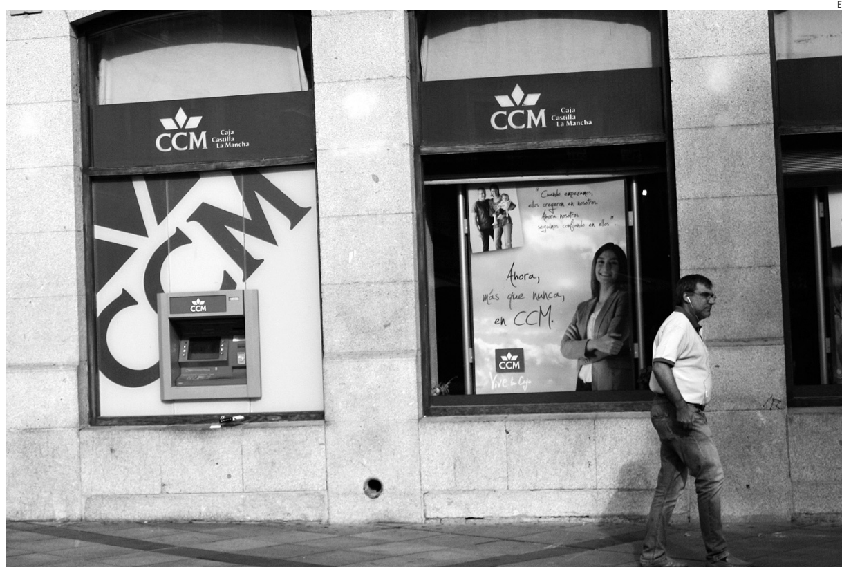
Algunos empleados de Banco CCM han recibido notificación de traslado de Castilla-La Mancha hasta Asturias.

Este verano, 56 empleados han recibido la notificación de cambio de trabajo a más de 25 kilómetros de su domicilio, algunos de ellos traslados desde Canarias, Andalucía, Comunidad Valenciana, Castilla-La Mancha, Cataluña hasta el Principado de Asturias.