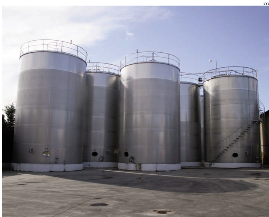
Desencuentro entre el sector industrial y el productor en Valdepeñas.

El precio que las bodegas de la comarca de Valdepeñas pagarán por la uva en esta vendimia ha provocado un nuevo desencuentro