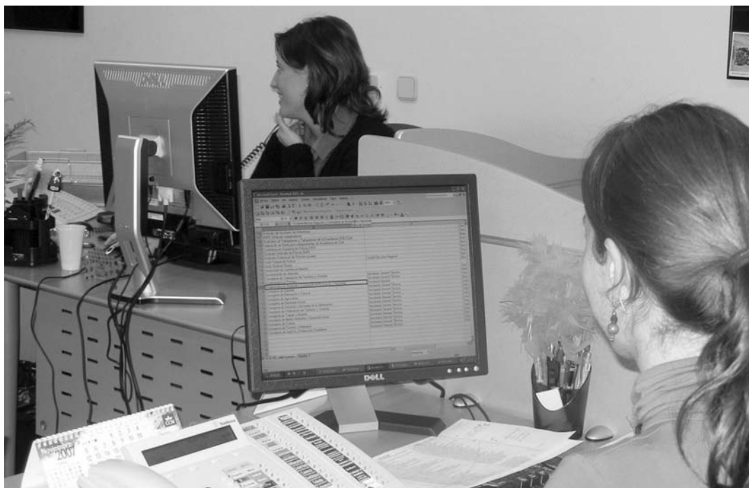
La promoción interna de los empleados es valorada por las compañías.

Más del 40% de las empresas recurre a las promociones internas de sus propios empleados