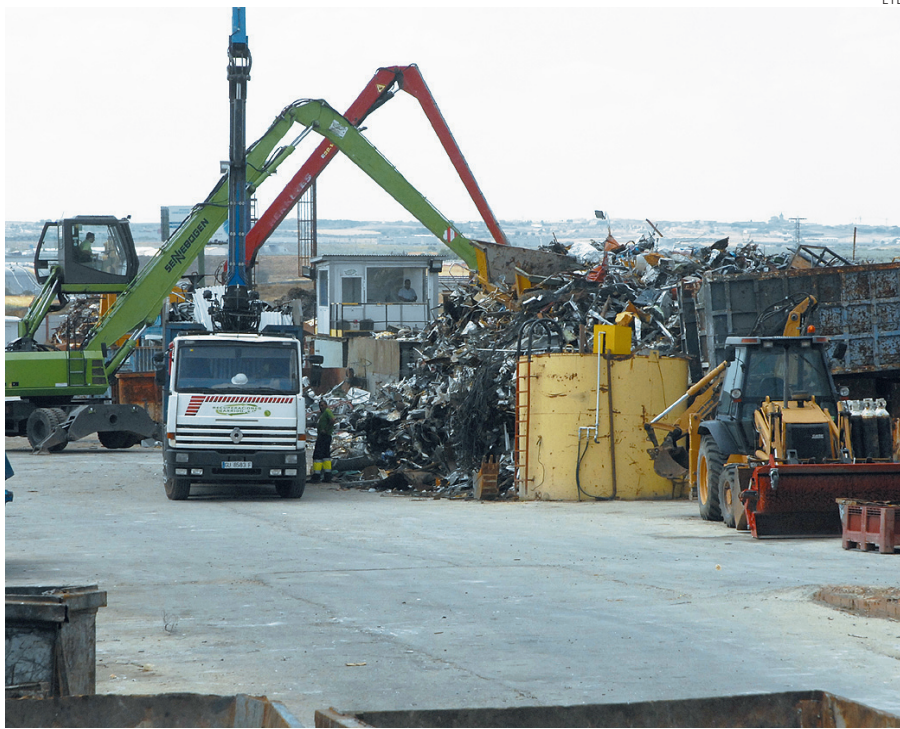
Los chatarreros temen por sus negocios.

Se trata, en definitiva, de mantener un encuentro para explicar el contenido