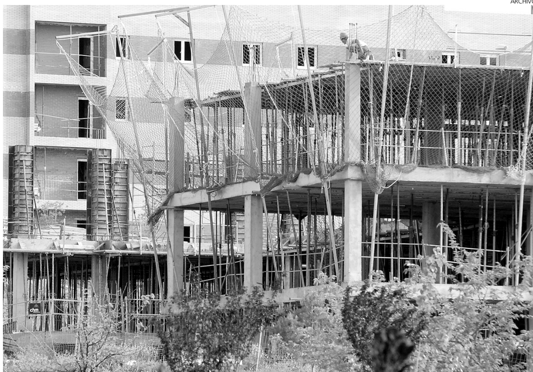
La construcción intenta salir de la crisis con las nuevas medidas del Gobierno.