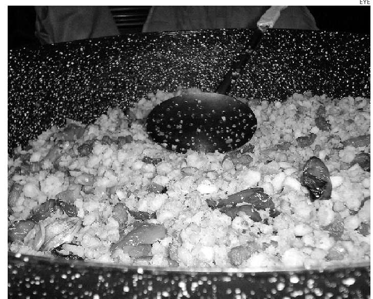
Las migas manchegas es uno de los platos típicos.