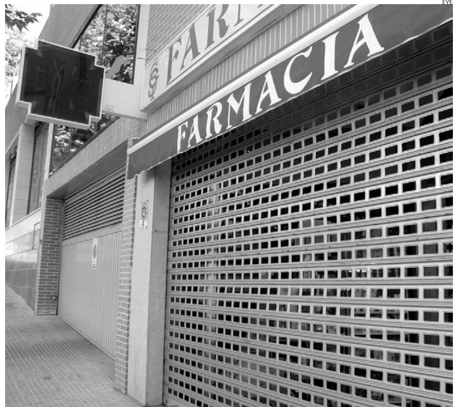
Las farmacias están dispuestas a seguir adelante con el cierre.

que "si siguiéramos con el despilfarro que se ha llevado a cabo en los últimos años, literalmente hablando, en 2013 tendríamos que haber cerrado la Comunidad Autónoma".