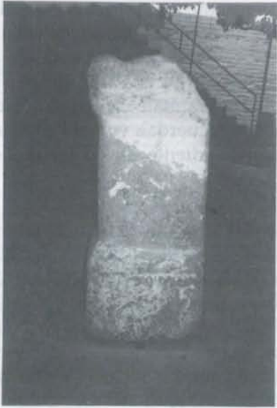
Fig. 1.- Ara, anverso.