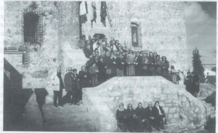
Socios en el Castillo de Manzaneque.