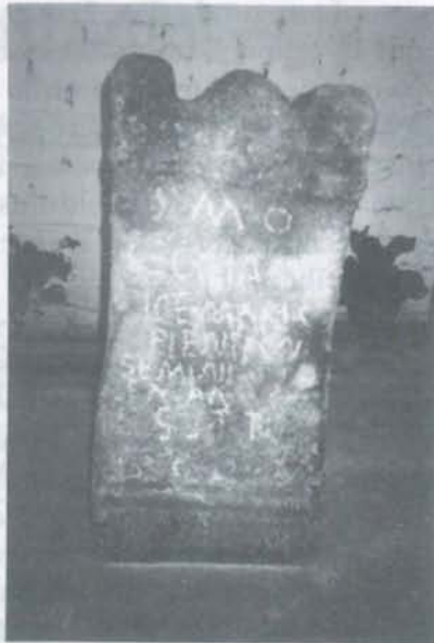
Fig. 2.- Estela funeraria, anverso