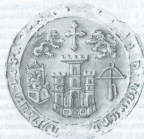
Fig. 2.- Sello de la Hermandad Vieja de Ciudad Real. 1497-1515.