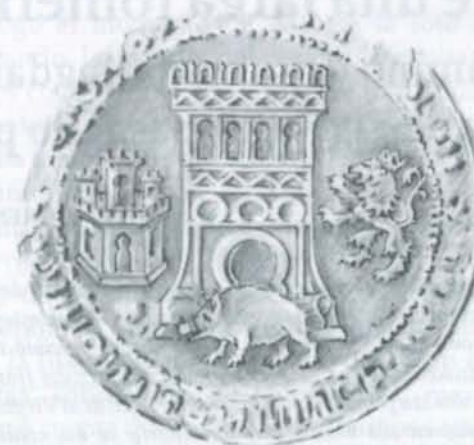
Fig. 1.- Sello de la Hermandad Vieja de Talavera. 1495. (Dibujo de Luis Riaño)

No hemos encontrado curiosamente ningún sello de la Hermandad de Toledo, aunque conocemos su simbología del siglo XVI, fecha en la que se reforma y unifica la composición sigilográfica hermandina adoptando las tres instituciones un escudo contracuartelado de Castilla y León timbrado de un coronel, todo ello acompañado y aquí la diferencia simbólica, la de Toledo de dos cuadrilleros con ballesta al hombro una a cada lado, la de Talavera, de un cuadrillero ajusticiando a un malhechor o "golfín" y bajo el escudo un jabalí y una colmena (1519) y la Hermandad de Ciudad Real desconocemos qué simbología utilizó en esta reforma, pese a existir un sello de 1594. El diámetro disminuye a 4,5 cm.