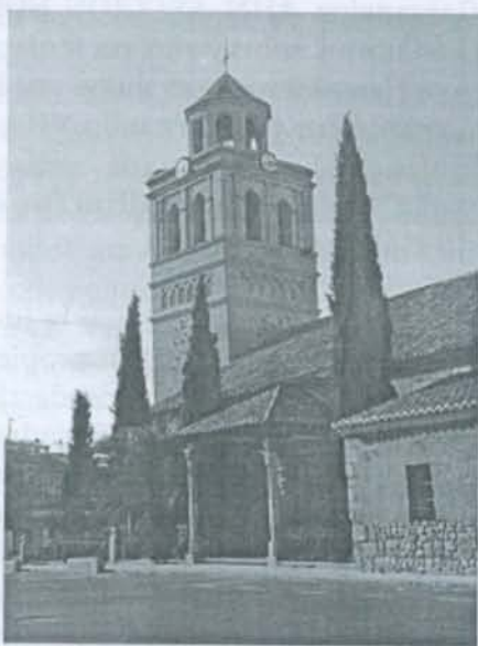
Iglesia y torre de Gálvez.