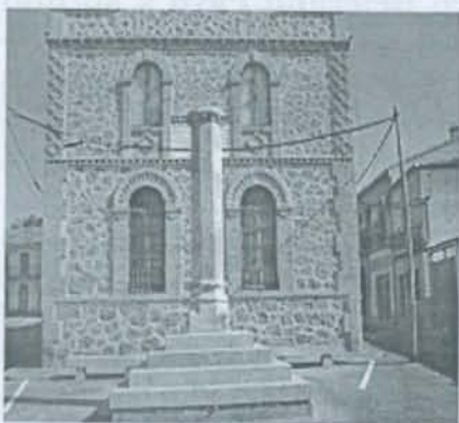
Rollo de justicia.