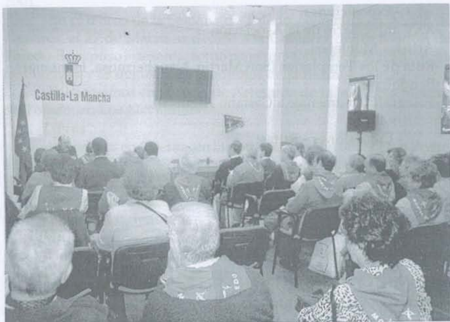
En la sala de conferencias de la FITUR 2002, en el momento de presentar los proyectos del XXV aniversario. (Foto: J. López).

-Sala de exposiciones en nuestra sede de la Puerta del Cambrón.