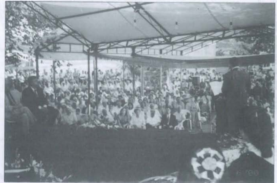
Aspecto de la Plaza durante el acto popular.

Y calle el pregonero, cese el pregón aunque su canto sea canto de amor. Y muchas gracias por haber escuchado estas palabras.