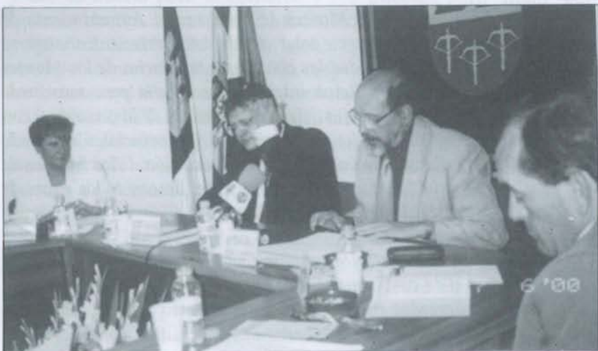
Llega del año 2000. Navas de Estena.

Con ello se dio por concluido la llega del año 2000.