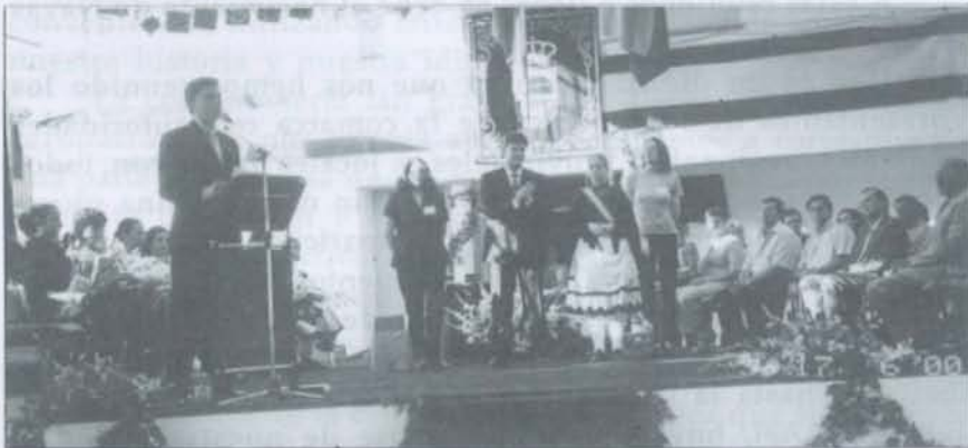
Acto popular presidido por los alcaldes y reinas de los pueblos monteños.