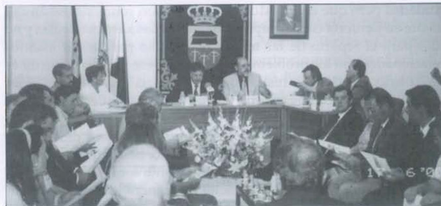
Llega del año 2000. Navas de Estena.