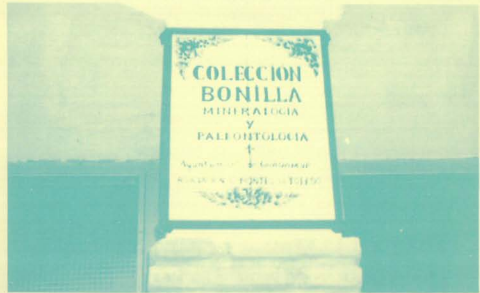
Placa colocada en la entrada de la Casa de la Cultura.