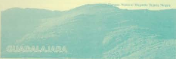
Parque Natural Hoces de Peña Negra

Si aún no conoces los contrastes naturales, la riqueza histórica, la variedad gastronómica y la hospitalidad que te esperan en Castilla - La Mancha, no sabes lo que te estás perdiendo