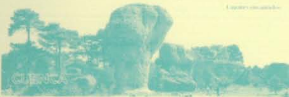
Lacortes con arbores

Sierras, hoces, ríos, llanuras, paisajes lunares o reservas naturales. La ruta del Románico, la de los Caballeros, las de las sierras de Alcaraz, Segura o Cuersca.