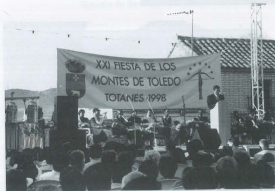
Un aspecto de la Fiesta.