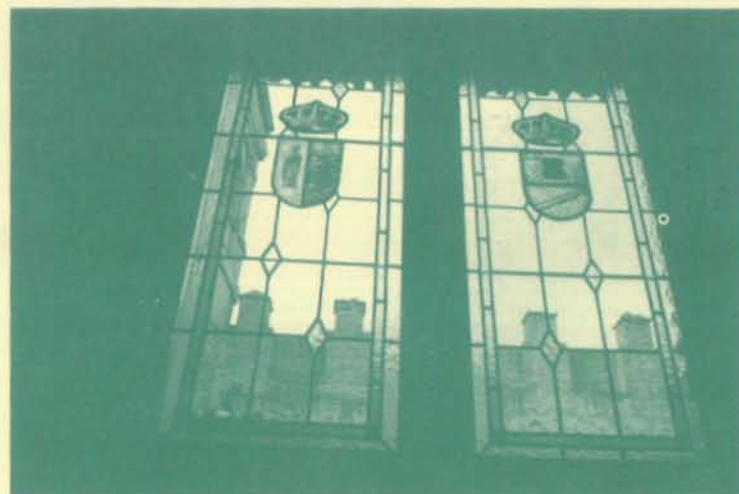
Escudos de San Pablo y Retuerta.

NUEVAS VIDRIERAS BLASONADAS EN LA SEDE DE LA ASOCIACIÓN