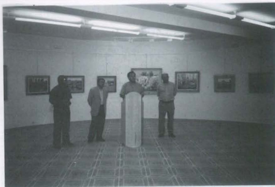
Homenaje a Leopoldo Morán.

VIDRIERAS EN LA SEDE.- La Casa de Oficios Municipal de Toledo con la colaboración del Ayuntamiento y el FSE han confeccionado para las ventanas de nuestra Sede Social en la Puerta del Cambrón 28 vidrieras de estilo castellano y técnica de emplomado, pintadas con grisalla y esmalte de color al horno en la que aparecen los escudos de Los Yébenes, Ventas con Peña Aguilera, San Pablo, Retuerta, Fontanarejo, Navahermosa, Alcoba, Hontanar, Los Navalucillos, Los Navalmorales y el de la Comarca de los Montes de excelente trazo y elegante composición que descubren una depurada técnica y profesionalidad del taller de vidrio.