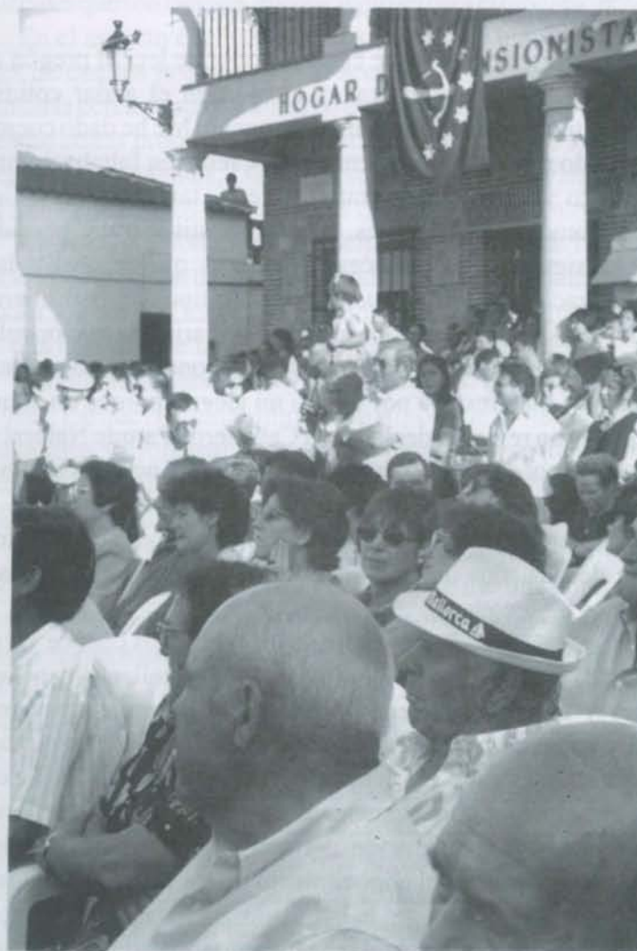
Un aspecto de los asistentes al acto popular de la XXI Fiesta de los Montes.

entregada como obsequio a todas las autoridades junto con un facsímil de una mapa de la comarca fechado en la segunda mitad del siglo XVIII; al Ayuntamiento le fue entregada una ballesta, símbolo de la comarca.