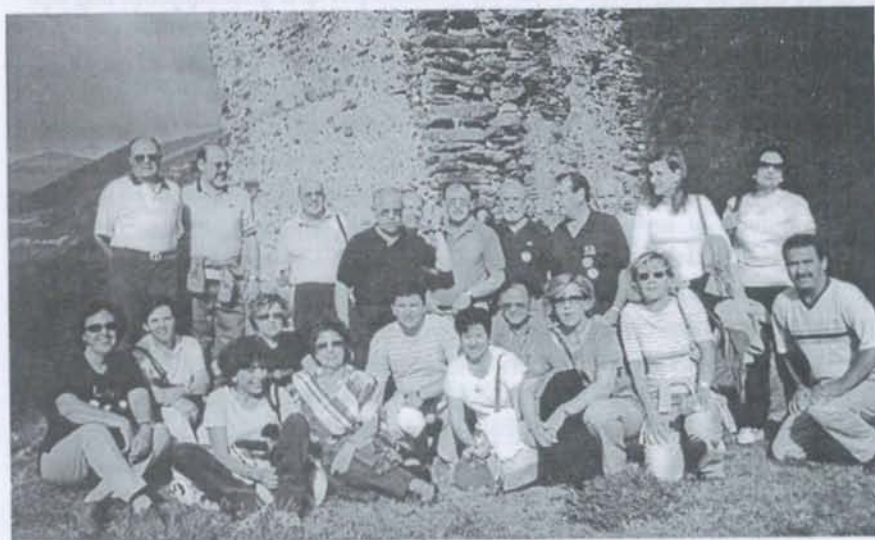
Excursión a los Pirineos. En el Castillo de Rialp.

También recorrimos un año más con los amigos de Ajofrín y de los Montes, el Camino del Pastor Magdaleno con sus ocho leguas largas, esta vez incrementando el número de caminantes y mejorando la infraestructura. Entramos en San Pablo más de 150 peregrinos. El camino de cada año es más popular.