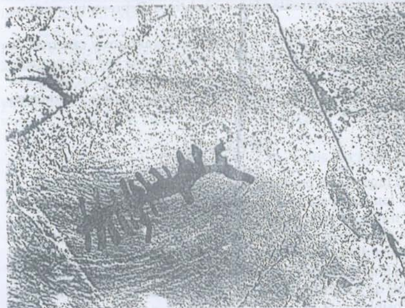
Abrijo II. Calco de figura echa por Jesús Victor. Arroba de los Montes. Agosto 2001