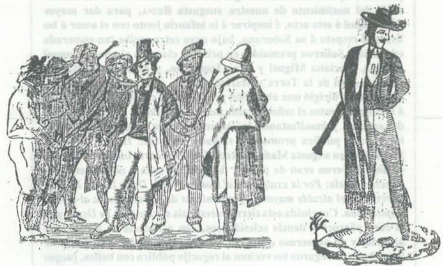
Ilustración de la misma versión anterior impresa en el s. XIX.