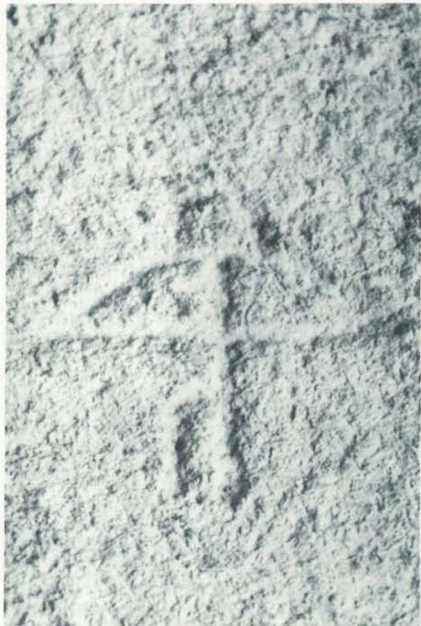
Ballesta grabada en la torre exterior del Puente San Martín, salida hacia los Montes.