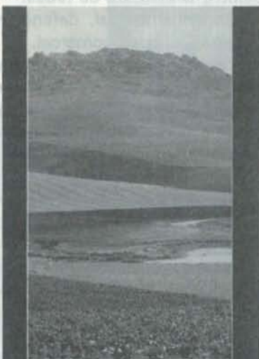
Ruta Montes de Toledo