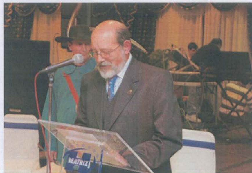
El Presidente de la Asociación durante su intervención.