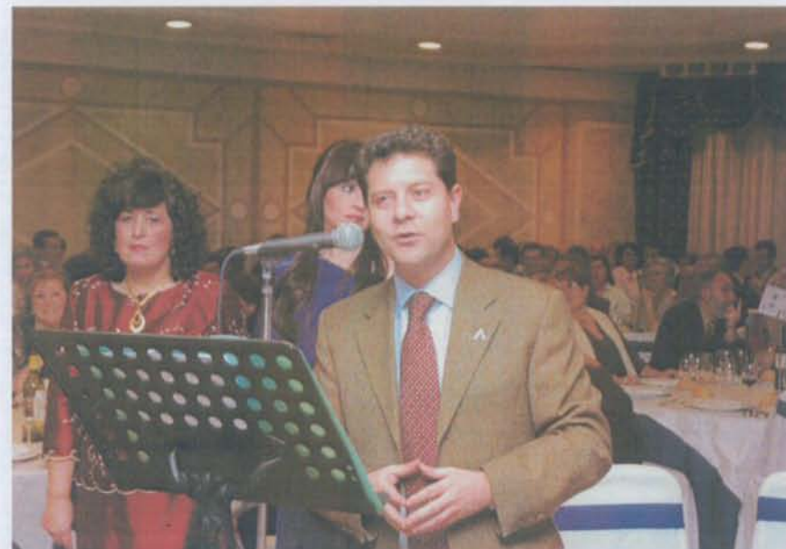
D. Emiliano García Page, Alcalde de Toledo, en un momento de su bienvenida.