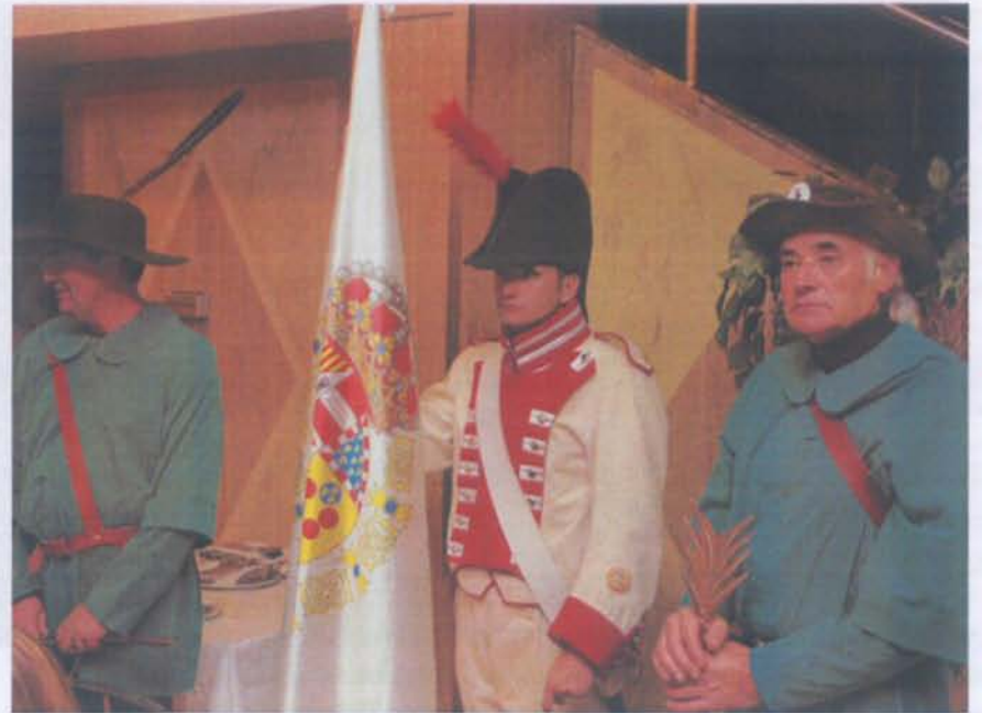
Soldado ataviado con el uniforme y bandera del Batallón Universitario de Toledo de 1808, flanqueado por dos cuadrilleros monteños.