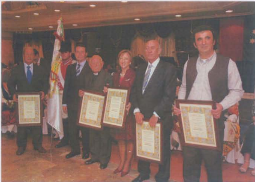
Monteños distinguidos en 2007.