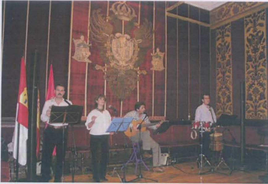
Grupo "Sol de Otoño" durante su intervención en la Sala Capitular del Ayuntamiento de Toledo.