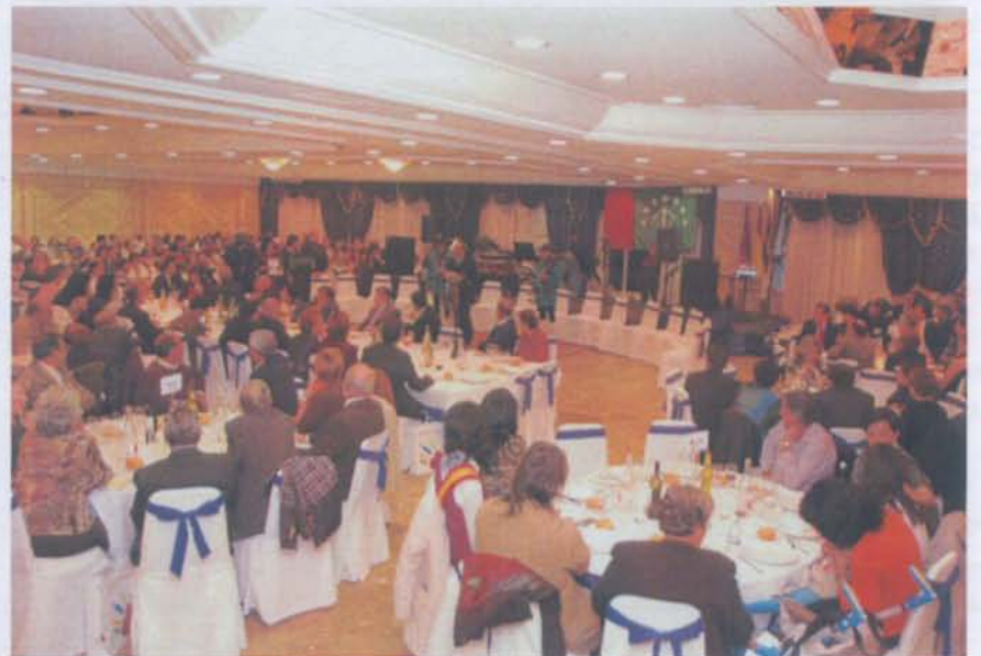
Aspecto general del salón.