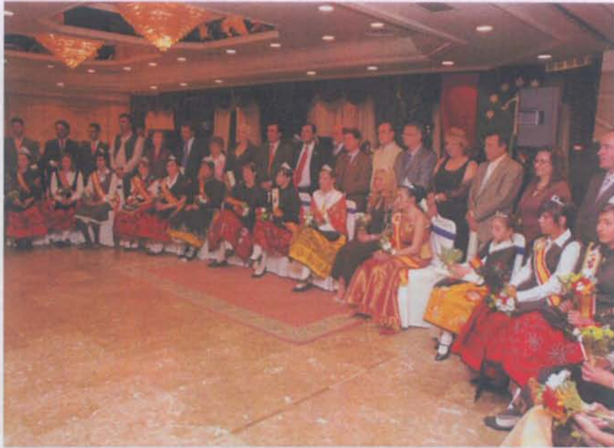
Alcaldes monteños con las reinas de las fiestas de sus respectivas poblaciones.