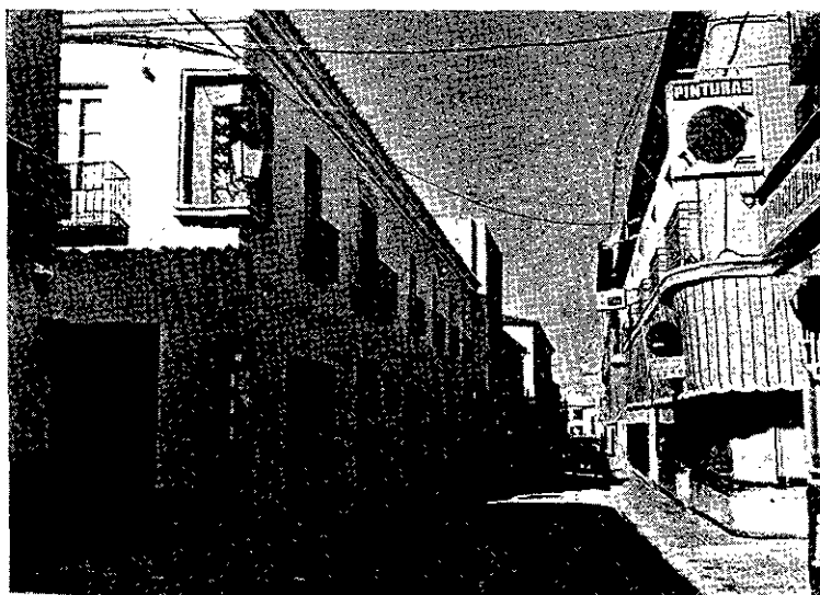
CALLE DEL GENERALÍSIMO (ANTES "EMPEDRADA")

Y volviendo a nuestra primera zona, próxima a la plaza principal (de José Antonio), hemos de recordar que entre la calle del Gene-