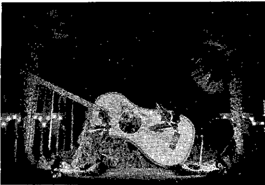
El Nacimiento instalado en la Plaza de José Antonio llamó poderosamente la atención. Las figuras simbólicas estuvieron cobijadas en el interior de una artística guitarra.

Pasó la Navidad entrañable de todos los años. La Navidad, como auténtica noticia, se nos mostró con sus matices tradicionales y su singularidad expresiva, invadiendo el ambiente con la fuerza incontenible de su mensaje. Mensaje bello del que sentimos no puedan participar todos los países del mundo. ¡Ah, las guerras y las discordias! Gracias a Dios en nuestras ciudades, pueblos y aldeas voltearon campanas de plata acompañadas de cánticos de gloria comunicando la grata recordación del nacimiento del Hijo de Dios.