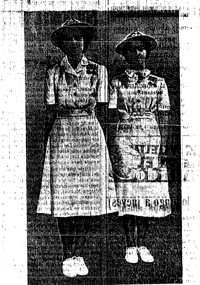
Admiren ustedes en la foto de la izquierda el nuevo uniforme de Cornellina del Cuerpo Moral femenino inglés destinado a los estudiantes. El de la derecha es el antiguo uniforme que también tiene algo de admirar. Y el que admiren ustedes también a estas dos marineritas que nos hacen la gracia de la foto de la derecha es el nuevo de San Antonio de Guayaquil.

no una cosa casual para una determinada hora de aquella misma tarde. Luego colgo, y fue en aquel preciso instante, cuando la última oportunidad de conservar su presencia libertaria se esfumó como voluta de humo ante un cierto invernal.