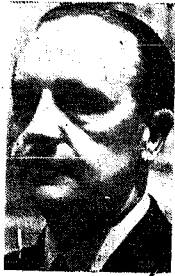
El Ministro Secretario General del Movimiento, camarada Fernández Cuesta.

DISCURSO DEL DELEGADO NACIONAL DE SINDICATOS Afirmo en sí que se quiere la utopía exterior contra España, a la que se quiere arrastrar ciertos pueblos occidentales, en su afán de crear la inestabilidad económica y el dinamismo perturbador y revolucionario de Rusia, y que los Naciones Unidas van a ser sacrificadas a España no era sino un tributo a grandes objetivos socialistas. Se ha abierto paso a la mano de nuestro pueblo cuando se congregó en la Plaza de Franco burlando a Dios por habernos concedido tal fe en semejante testamento y se dispuso a realizar fuera de toda ley precisa, con esa moral que permitía los españoles en las causas justas y grandes cuando se nos salía de encima. Se refiere a 1918 y señala la diferencia del clima, con lo que por entonces se respiró en España y lo que Franco ahora ha sembrado al mundo la avidez de las posibilidades. Se refiere a la situación económica, los temas sobre producción y distribución de riquezas y los problemas jurídicos de la política y de la justicia social, como conclusiones y conclusiones, salidas, entrecruzadas, de todas las fuerzas económicas del país, y trata de las relaciones entre el sector económico, destacan como el marxismo se esforcó al pretender interpretar la historia sobre el esquema teórico del material. Considera error político grave el que se desconociera de sus posibilidades al hombre de Estado y le hace creer que su misión se reduce a obedecer, en vez de orientar y encarrilar las aspiraciones del pueblo.