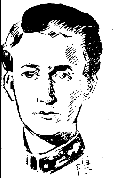
LEOPOLDO III, DE BELGICA

El 22 de julio, en virtud de la opinión mayoritaria del país, favorable al retorno al Trono del Rey Leopoldo III, este volvió a Bélgica asumiendo sus regias prerrogativas. Diez días después, el 1 de agosto, como símbolo del valor que a las decisiones democráticas dan los partidos marxistas cuando esas decisiones son contrarias a sus planes y a sus intereses, el Rey Leopoldo III se ve obligado a ofrecer el apartamiento de las funciones de jefe de Estado, y su posterior abdicación porque los socialistas desataron la campaña de agitación y violencia durante el curso evidentemente muy democrático—ante la que no caben más que una de estas dos actitudes: energética decisión en los órganos del Poder para hacer respetar la voluntad de la mayoría del país y salvar el Trono, o débil debilidad que puede tener sospechadas derivaciones.