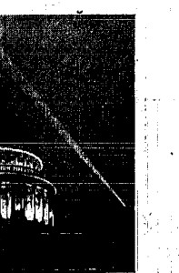
La cúpula de la Catedral de San Pablo (Madrid) ofrece una importante perspectiva