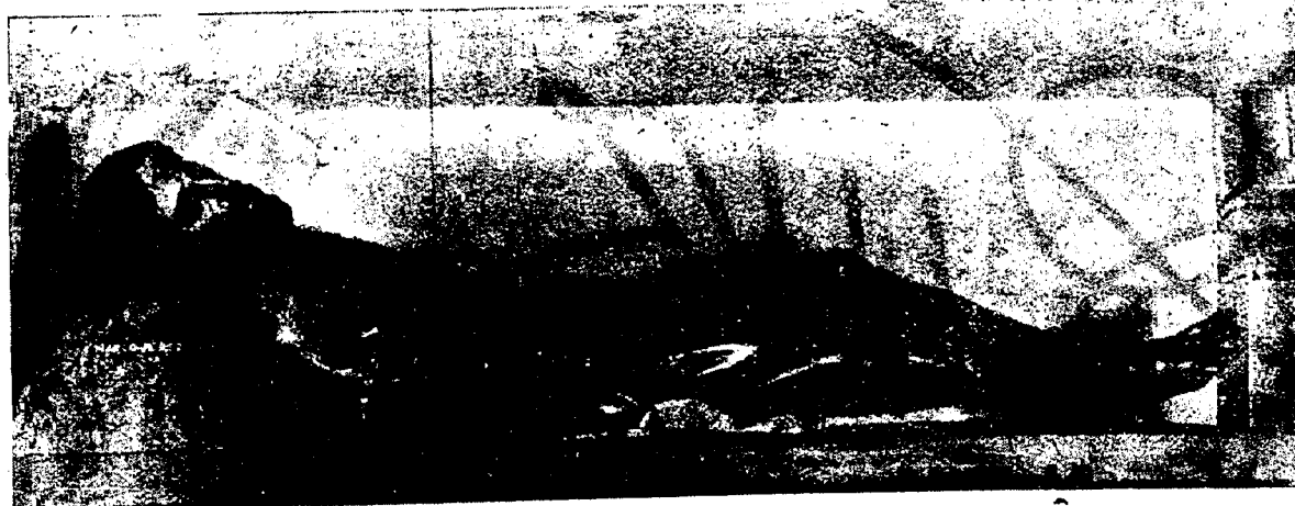
«Jesús Yacente» es el «paso» de la orden capitular de los Caballeros del Santo Sepulcro, que desfiló en la última procesión del Viernes Santo

¡Ya... Han pasado los días y las horas en vertiginoso desfile. Jornadas de evocación de recuerdo que fueron y ya no son. Han cruzado por mi mente, por mi mirada, por mi ser toda la grandeza de mi ciudad castellana. Cuando esto cais ra... también, no estaré entre vosotros. Otra vez en mi trabajo y en mi ocupación. Ahí os queda Cuenca para que la guardéis con ese cariño con que se acaricia al ser querido. Nosotras, desde lejos, componemos su vanguardia siempre en pie, siempre alerta, en eterna vigilancia. Por nuestra ciudad, por Cuenca. ¡Ya!