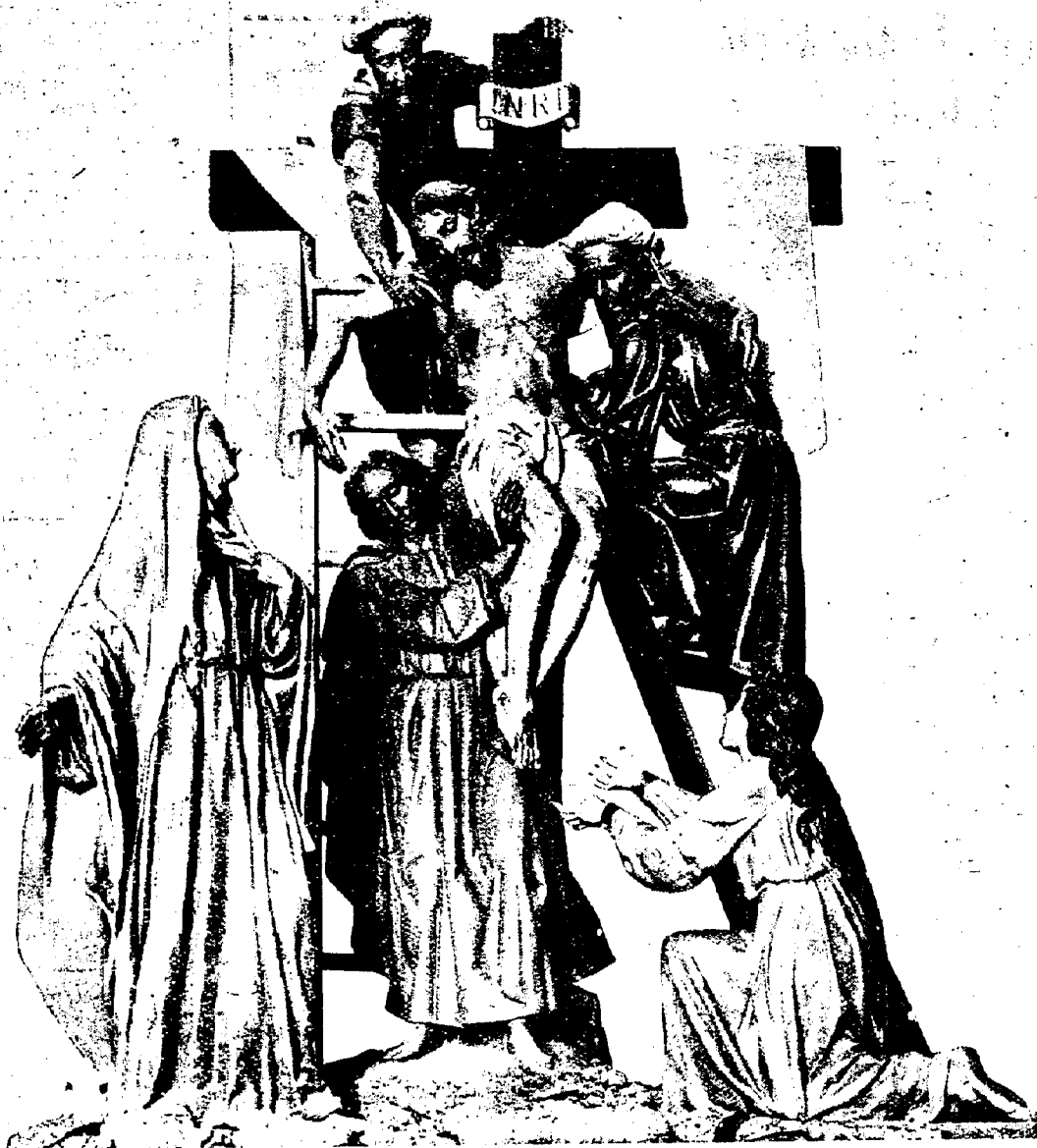
El “paso” del “Descendimiento” del escultor conquense Marco Pérez, que figuró en el desfile procesional del Viernes Santo, de las once de la mañana y que destacó a su paso por las calles de nuestra capital, despertando la admiración del numeroso público que presenció el desfile