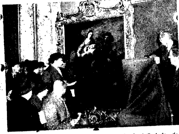
El 8 de junio se inauguró en Londres la Feria de Antigüedades de este año. Constituye un certamen al que acuden compradores de todo el mundo por la gran importancia de los artículos expuestos. La concurrencia examina "La huida de Egipto", cuadro de Murillo que se vendió en 3.360 libras esterlinas.—alpe.