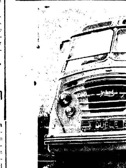
Autobús de lujo, de fabricación inglesa, que se exhibirá en Nueva York en la Exposición que ha de celebrarse en esa capital. Se espera que en breve sean muchos los que "rueden" en los Estados Unidos.