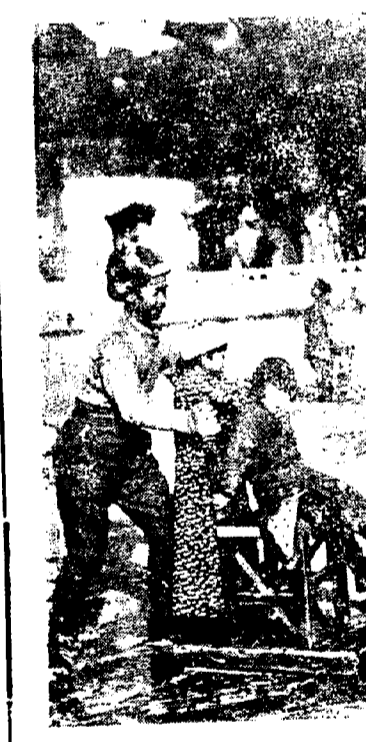
Amén del aprendizaje sobre la democracia que los vencedores han impuesto a los vencidos, en el Japón, ha despertado un extraordinario interés el patinaje sobre hielo. Al norte de la isla de Yezo, la práctica de este deporte es entusiasta como lo demuestra este papa que corre la pista sobre cuchillas mientras hace paternalmente un poco el burro empujando el trineo en el que sus hijos se divierten y toman lecciones sobre lo bien... que se va sentado.