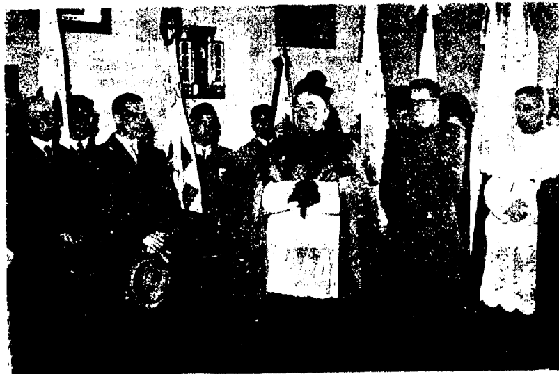
Un momento de la recepción celebrada en el Palacio episcopal, el "Día del Prelado"