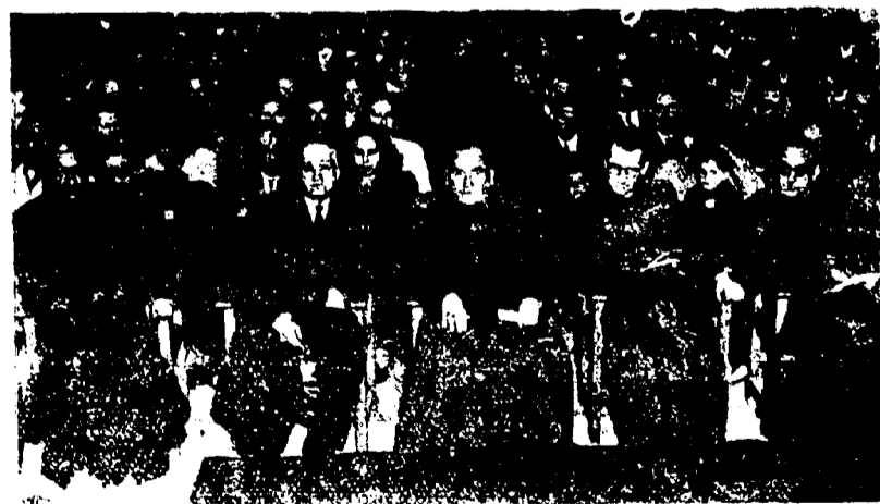
Una panorámica del aspecto que ofrecia el Salón de Actos de la Escuela del Magisterio, el «Día del Prelado» con motivo del acto que se celebró en honor al Sr. Obispo

Fuó, en resumen, una jornada en que la Diócesis se ha sentido unida en el homenaje a su Prelado—demostrando en todos los actos antedichos la adhesión y el cariño que por él siente.