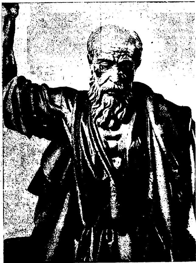
Un primer plano de San Pedro Apóstol, figura central del "paso" de la Hermandad de los Ex-combatientes conquenses, que formó parte anoche, en la procesión del "Silencio", con que dieron comienzo los desfiles religiosos en nuestra capital

En las primeras horas de la madrugada de hoy terminó esta primera procesión que nos ha hecho vivir una jornada de recogimiento y emoción al recordar, vivamente, las escenas del Gólgota.